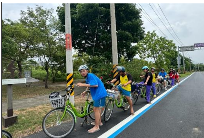
柳營國中九年級畢業生一起騎單車到德元埤荷蘭村進行海洋教育活動