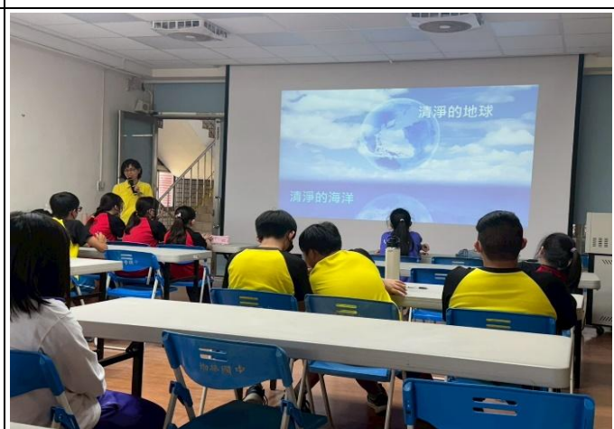
海洋教育與海洋污染的議題值得關切