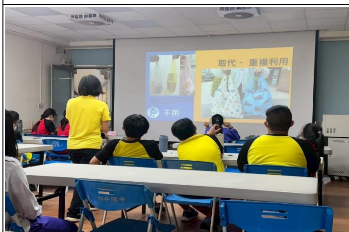
邀請校外講師宣講海洋教育與塑膠袋減量、重複利用對環境的重要性