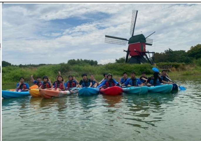
柳營國中九年級畢業生體驗水上設施