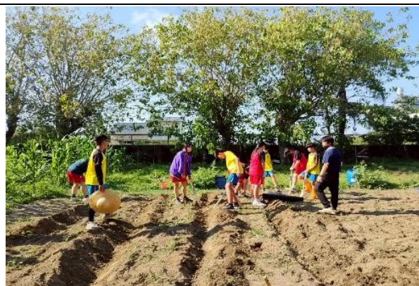
114學年度食農教育(農藝社)