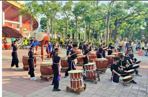
114學年度課後社團(太鼓隊)