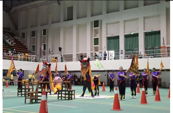
114學年度課後社團(舞獅隊)