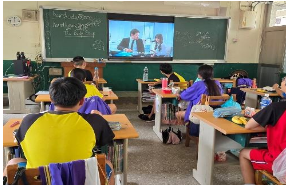
每週播放「餐前5分鐘」影片