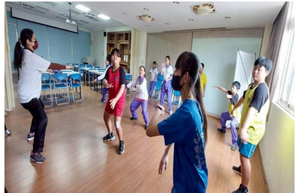
114學年度柳營國中太極社