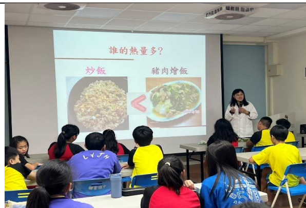
114學年度公誠國小營養師到校演講 健康飲食知能