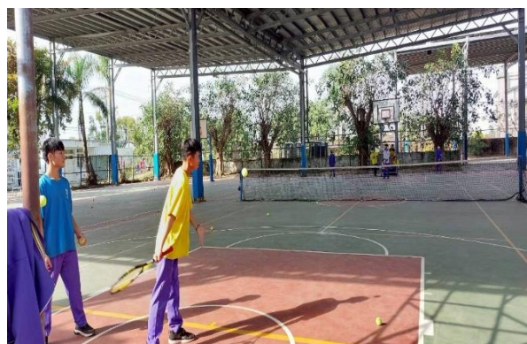
114學年度柳營國中網球社