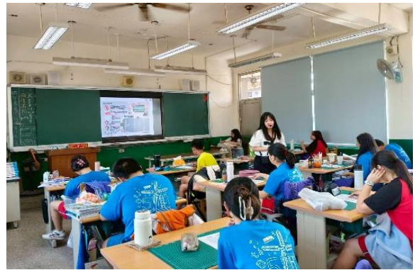
114學年度健康飲食專書教學