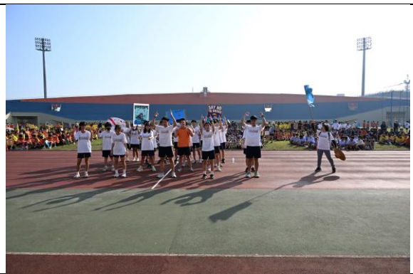
308 菸檳毒say no