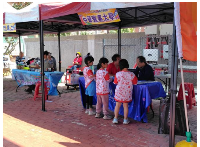
說明：中華醫事大學設攤共同推動健康促進