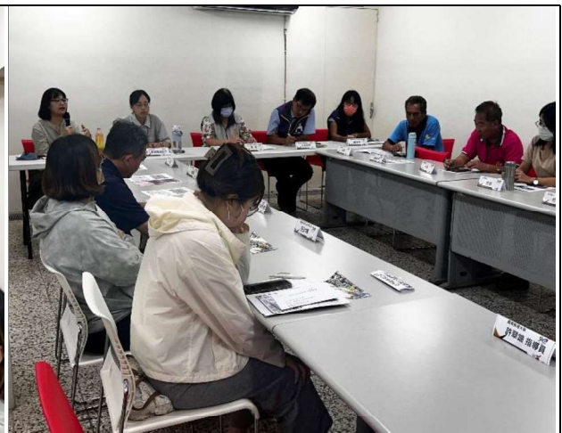
圖2. 北門區高齡友善會議照片