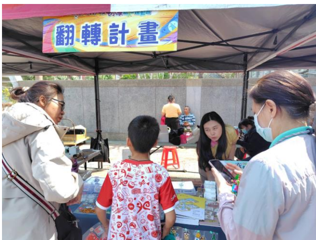
說明：北門區圖書館設攤共同推動健康促進