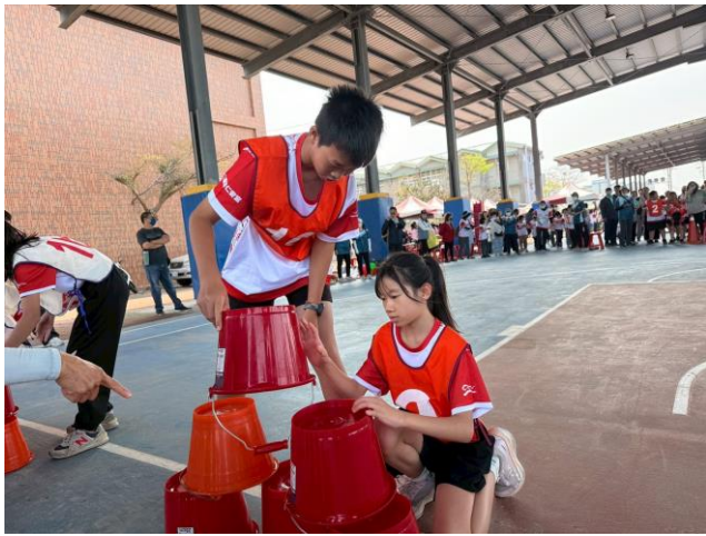
說明：趣味競賽~體現團隊合作精神