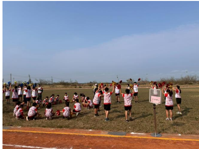
說明：文山、三慈、蚵寮國小大會舞表演