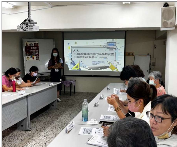
圖1. 北門區高齡友善會議照片