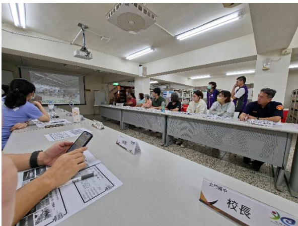
說明：會議簡報推動計畫