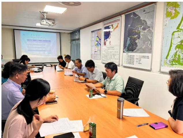
說明：各校校長與區公所召開運動會協調會