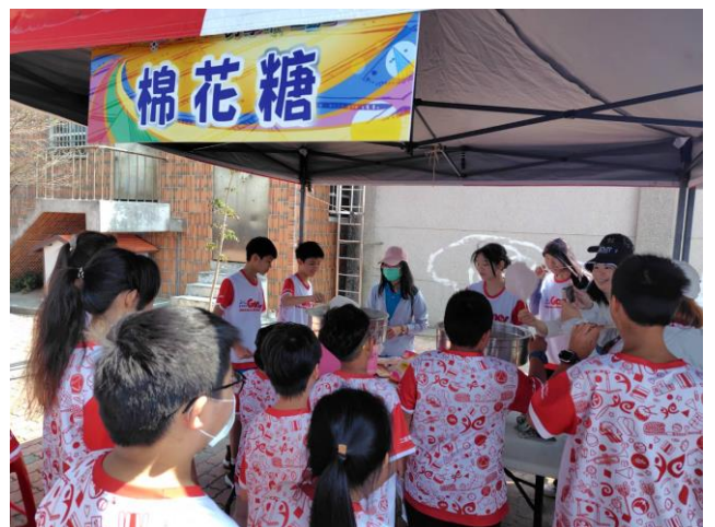
說明：自製棉花糖體驗攤位