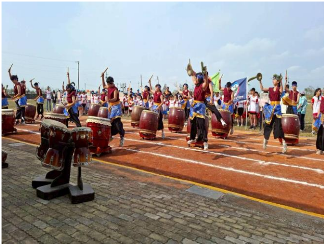
說明：北門國中戰鼓表演揭開序幕