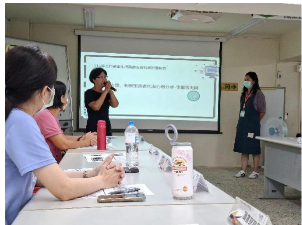
說明：社區長者分享