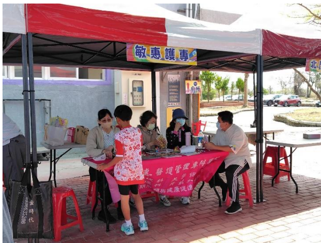
說明：敏惠護專設攤共同推動健康促進