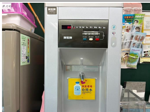
說明：飲水機張貼”就是愛喝白開水”標語