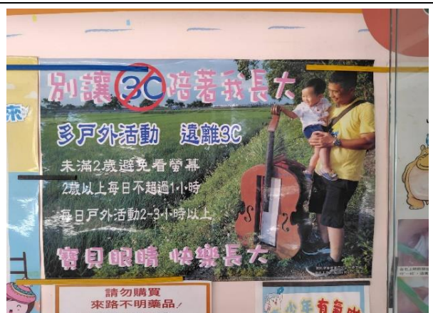
說明：公佈欄張貼護眼海報，強化學童護眼概念