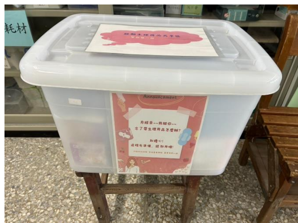
說明：健康中心內設置生理用品共享盒