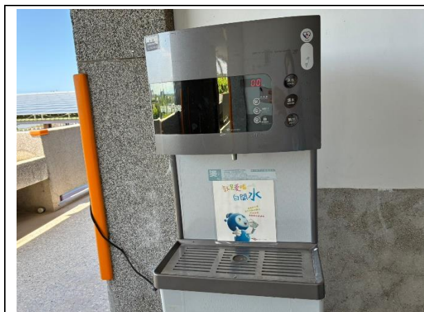
說明：飲水機張貼”就是愛喝白開水”標語