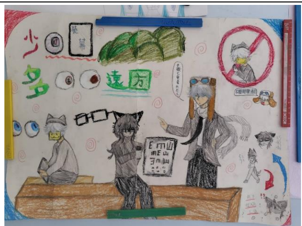
說明：少看3C，多看遠方