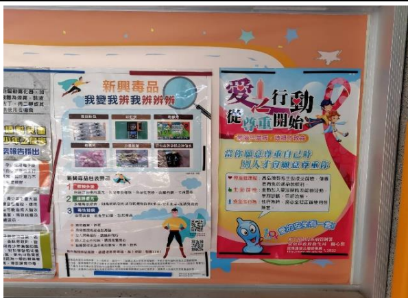
說明：公佈欄張貼反毒海報，營造無毒校園