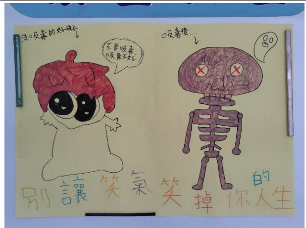
說明：別讓笑氣笑掉你的人生