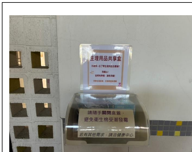
說明：一樓女廁內設置生理用品共享盒