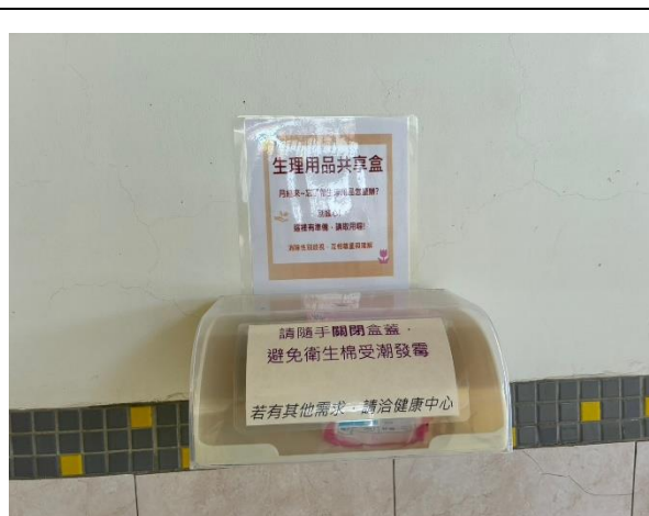
說明：二樓女廁內設置生理用品共享盒