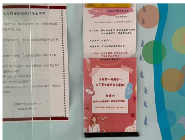
說明：張貼生理用品共享盒公告