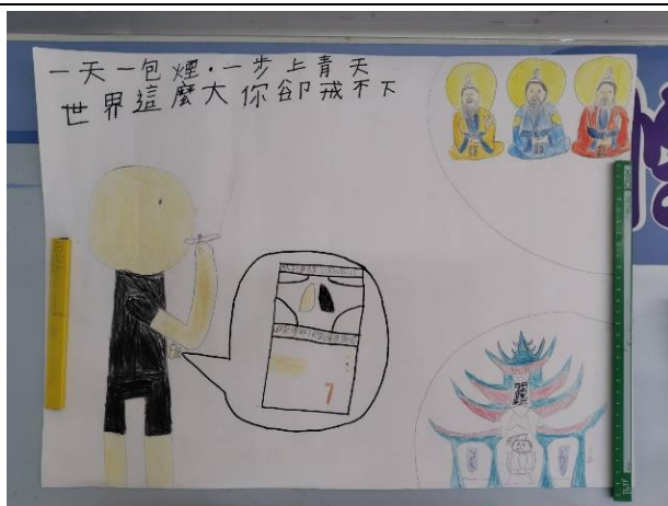
說明：一天一包菸，一步上青天 世界這麼大，你卻戒不下