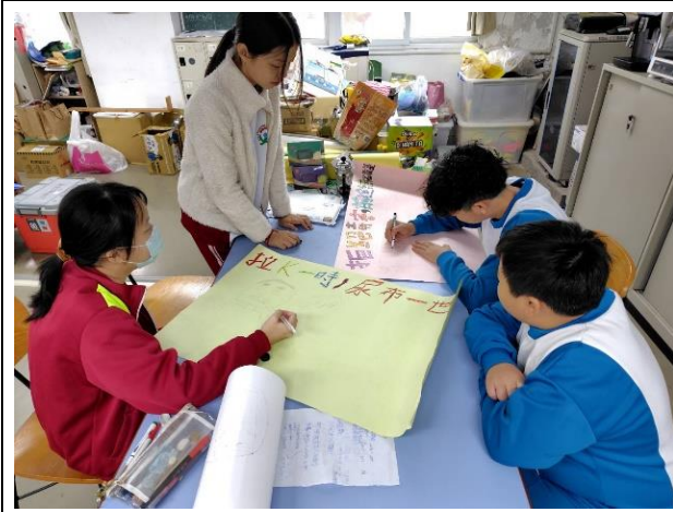
說明：學童認真作畫