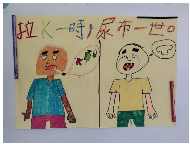
說明：拉K一時，尿布一世