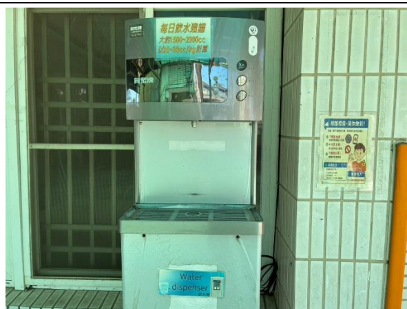
說明：飲水機張貼”每日飲水量”標語