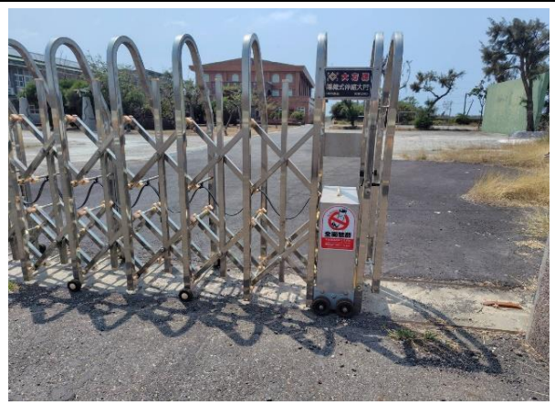
說明：校門口張貼禁菸標誌營造無菸校園