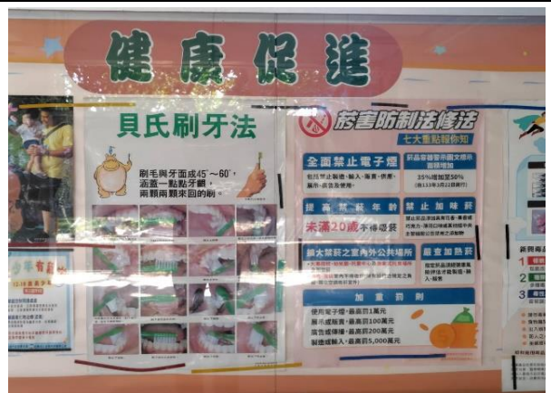
說明：公佈欄張貼貝氏刷牙法海報，強化學童潔牙技能