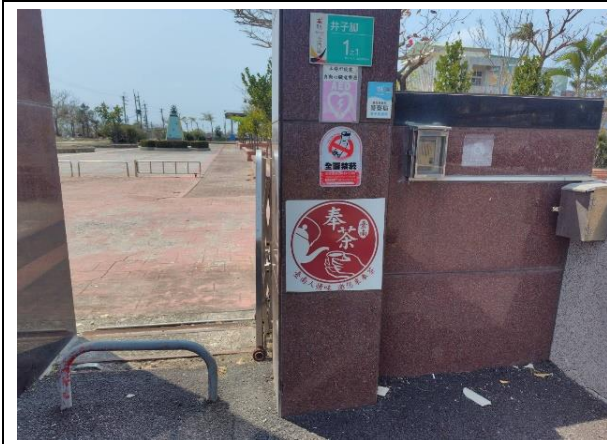
說明：校門口張貼禁菸標誌營造無菸校園