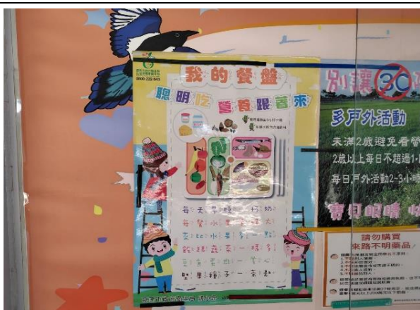
說明：公佈欄張貼我的餐盤海報，強化學童均衡飲食概念