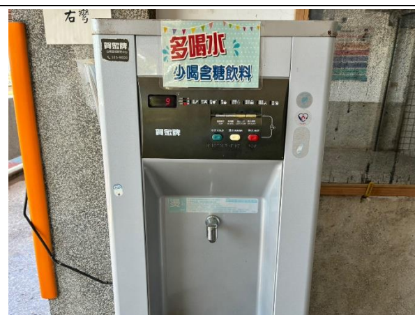
說明：飲水機張貼”多喝水少喝含糖飲料”標語