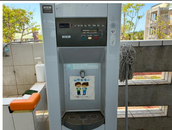
說明：飲水機張貼”相揪來喝水”標語