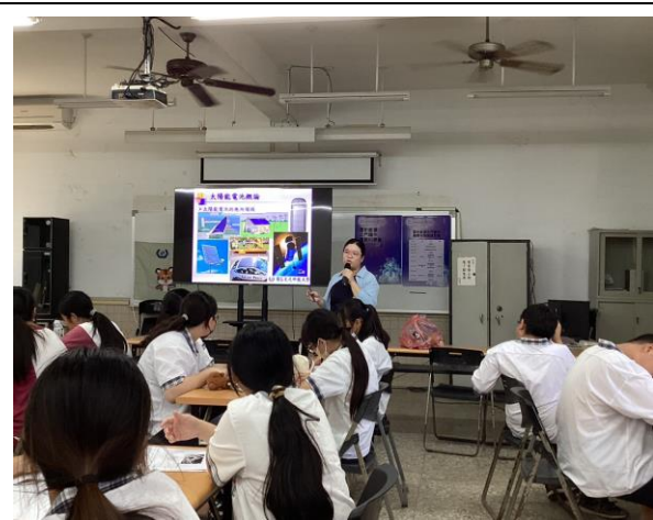
說明：說明再生能源種類~太陽能