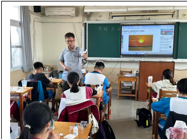
說明：介紹北門候鳥~黑腹燕鷗、黑面琵鷺