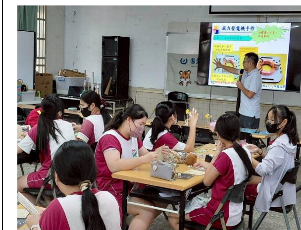
說明：手作風力發電機