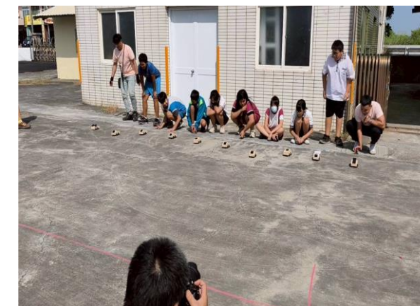
說明：太陽能皮卡車競速