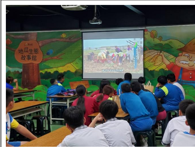
說明：學生認真聽講