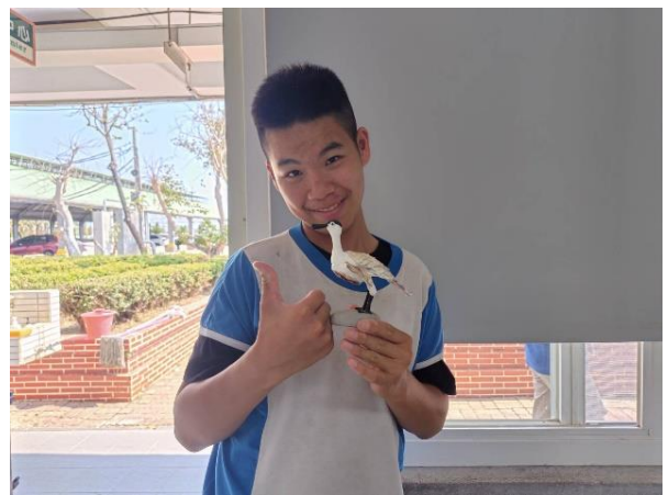
說明：蚵灰~黑面琵鷺完成