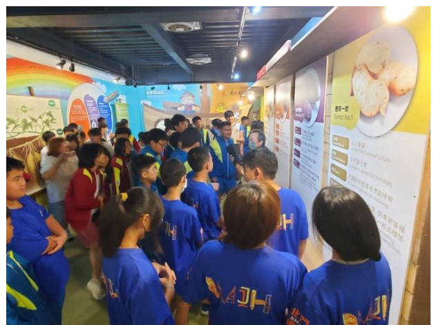
說明：學生認真聽講