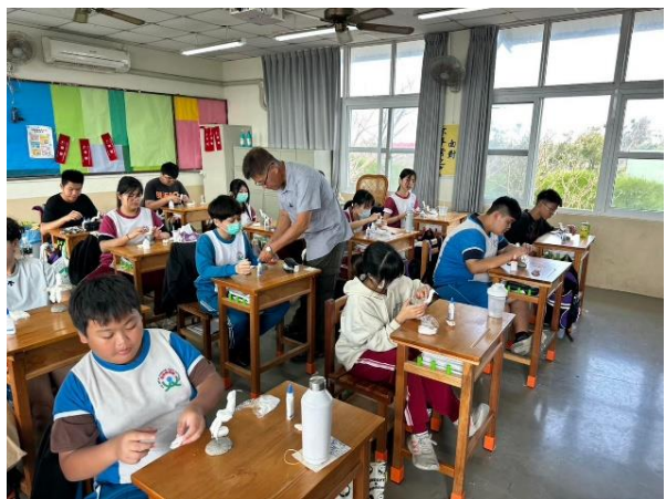
說明：學生認真實作