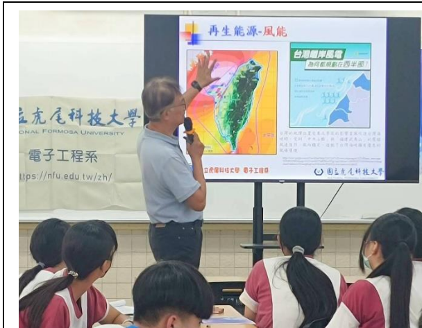
說明：說明再生能源種類~風力