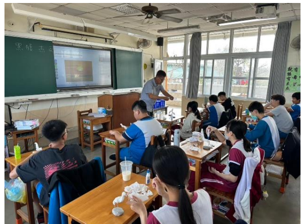
說明：以蚵灰製作工藝品