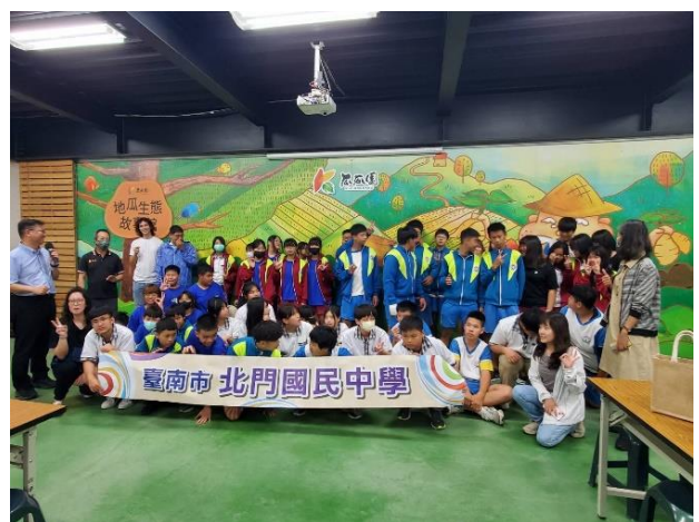
說明：留下參訪足跡