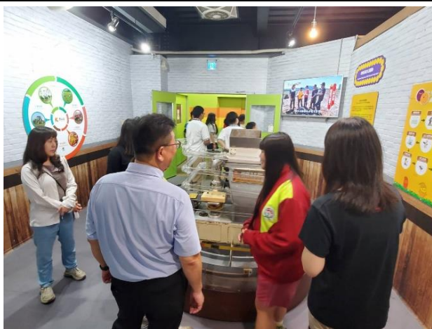
說明：地瓜產品製程參觀