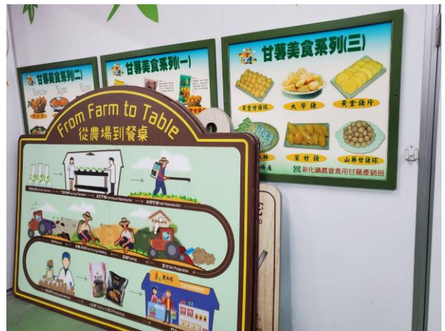
說明：地瓜產品製程參觀