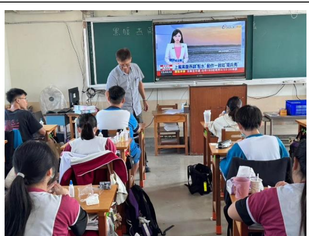
說明：介紹北門候鳥~黑腹燕鷗、黑面琵鷺