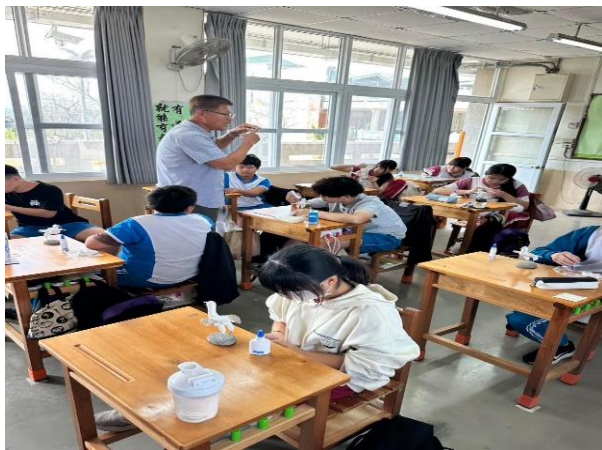
說明：說明蚵(牡蠣殼)灰結構特性