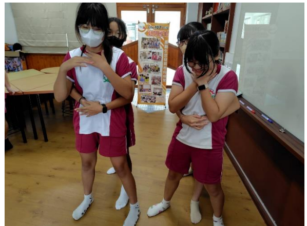
說明：學生異物哽塞回覆示教