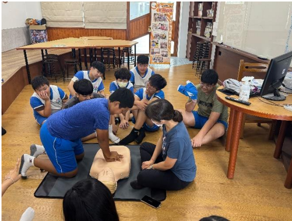
說明：學生 CPR 回覆示教