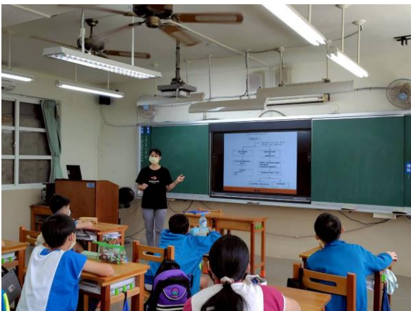
說明：護理師進行校園安全及緊急傷病宣導