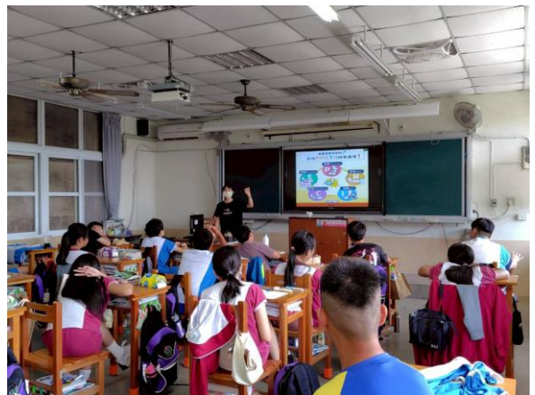
說明：護理師進行校園安全及緊急傷病宣導