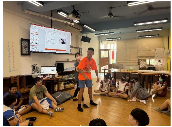
說明：護理師進行異物哽塞實作教學