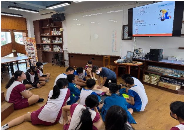
說明：護理師進行 CPR 實作教學