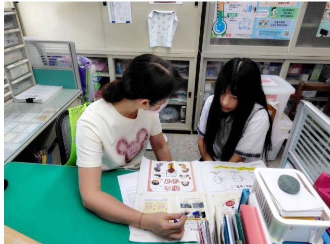
說明：高度近視學生個別衛教視力保健的重要