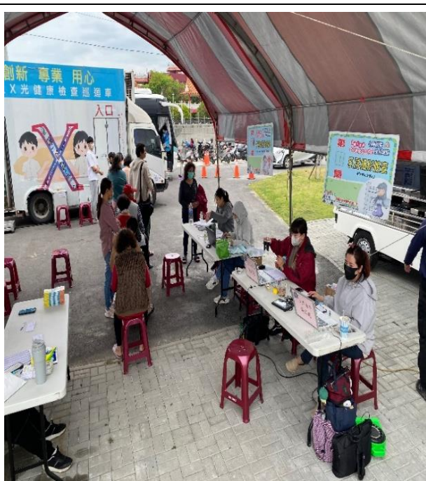
說明：引導社區民眾排隊進行胸部X光檢查