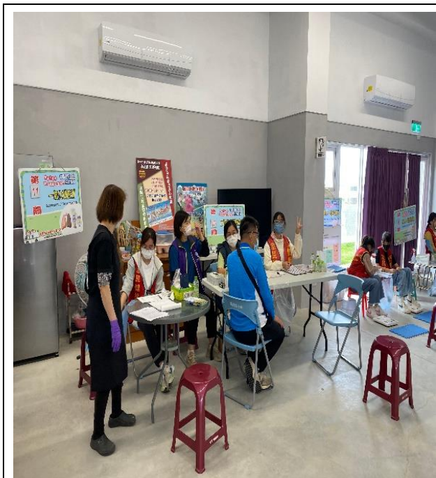
說明：協助社區民眾口腔檢查