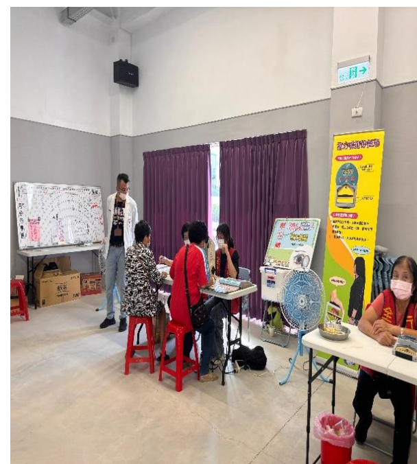
說明：為社區民眾測量視力