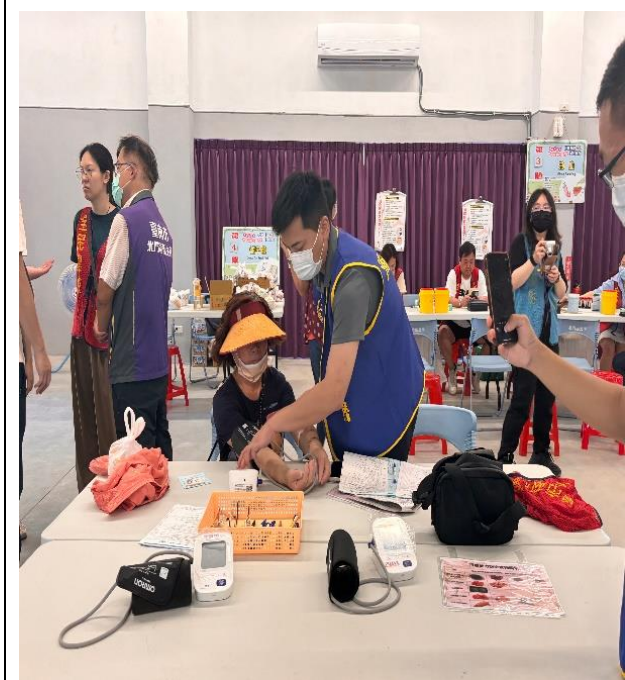
說明：為社區民眾量血壓