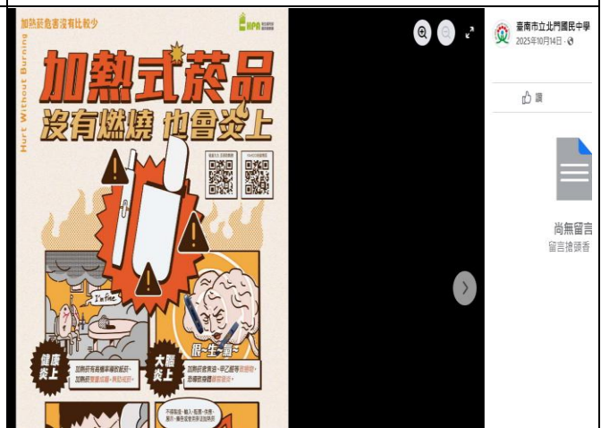
說明：在北中粉專張貼菸檳防制相關訊息