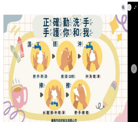
說明：在北中粉專上張貼正確洗手防疫訊息