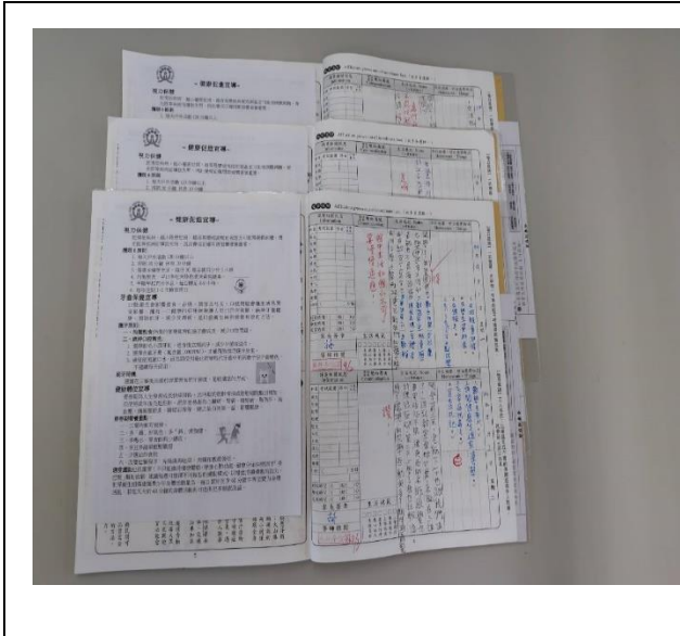
說明：聯絡簿張貼健康促進宣導單張