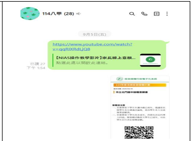
說明：利用班群張貼流感簽署教學網站及簽署QRcord