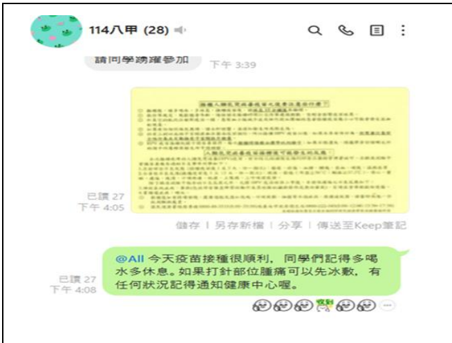
說明：於班群張貼疫苗接種後注意事項