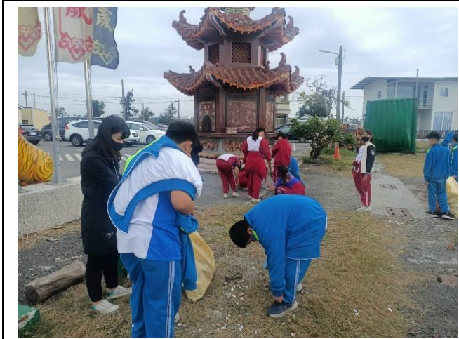
說明：環境教育路跑結合社區淨街活動