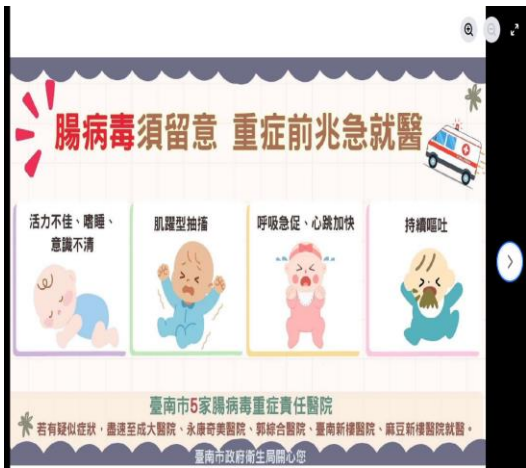
說明：在北中粉專上張貼腸病毒重要訊息