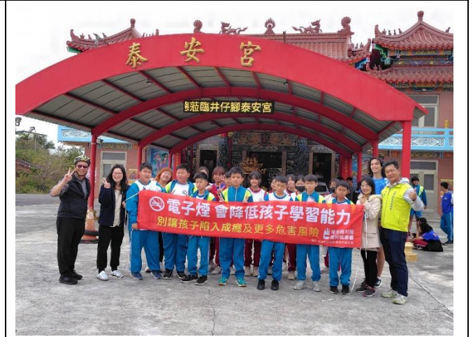
說明：於淨街活動後以紅布條倡議電子菸的危害