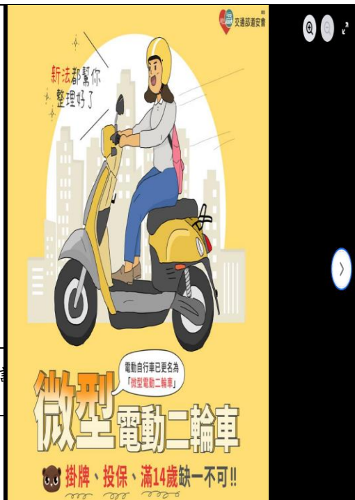
說明：在北中粉專張貼菸檳防制相關訊息