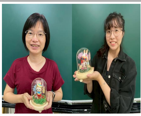
說明：教職員工的永生花夜燈手作 成品～美麗的令人心情愉悅