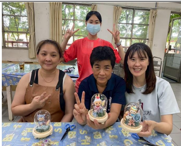
說明：教職員工的永生花夜燈手作 成品～美麗的令人心情愉悅