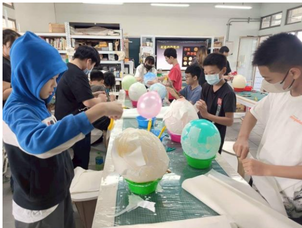
說明：辦理親職美學課程落實藝術深耕陶冶性情