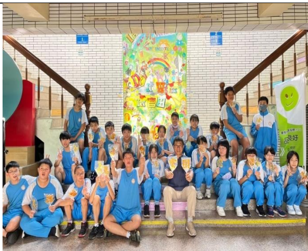
說明：食農課-畫糖藝術課程