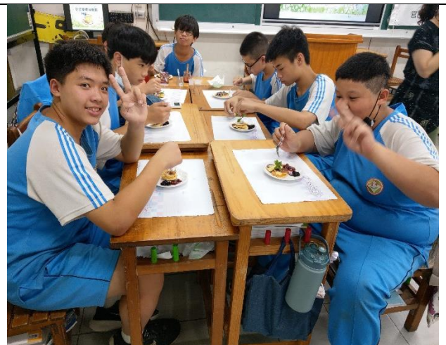
說明：食農課-香草舒服芙蕾鬆餅製作