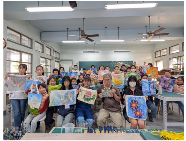
說明：親職課程藝術作品展示