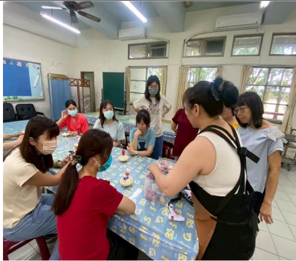
說明：教職員工透過健康促進舒壓 永生花夜燈手作研習課釋放壓力