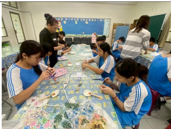
說明：透過鑰匙圈手作課程舒壓