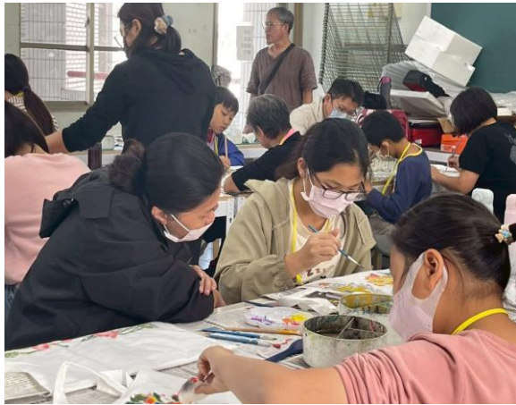
說明：辦理親職美學課程落實藝術深耕陶冶性情