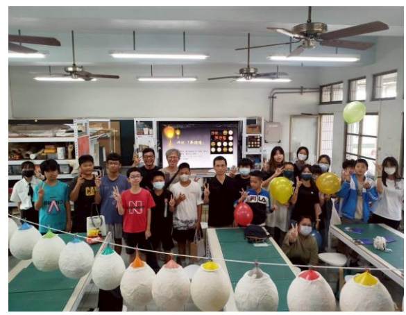
說明：親職課程藝術作品展示