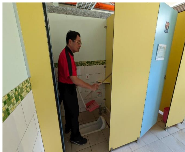
說明：校長帶領教職員清潔打掃防疫