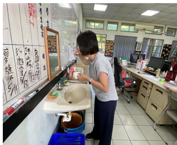
說明：教師們飯後潔牙