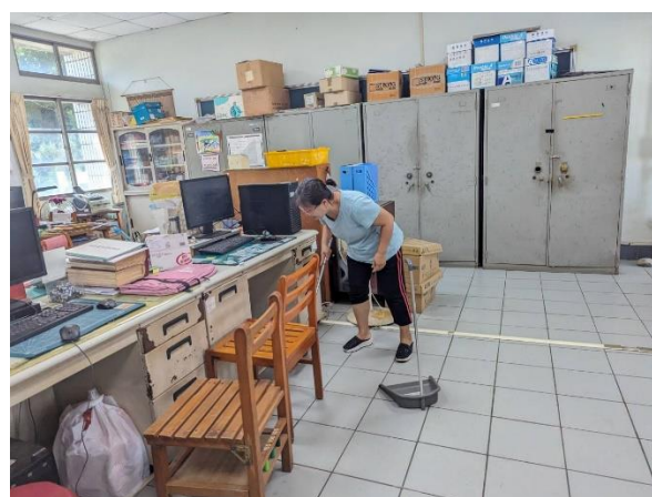
說明：教職員清潔打掃登革熱防疫