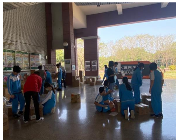
說明：校長帶領師生分配發放愛心物資