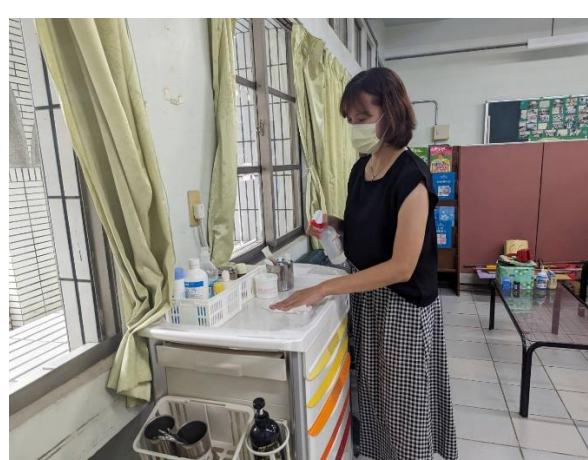
說明：教職員清潔打掃登革熱防疫