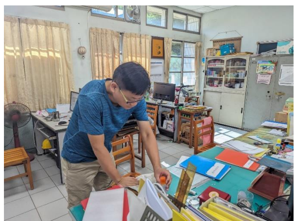
說明：教職員清潔打掃登革熱防疫