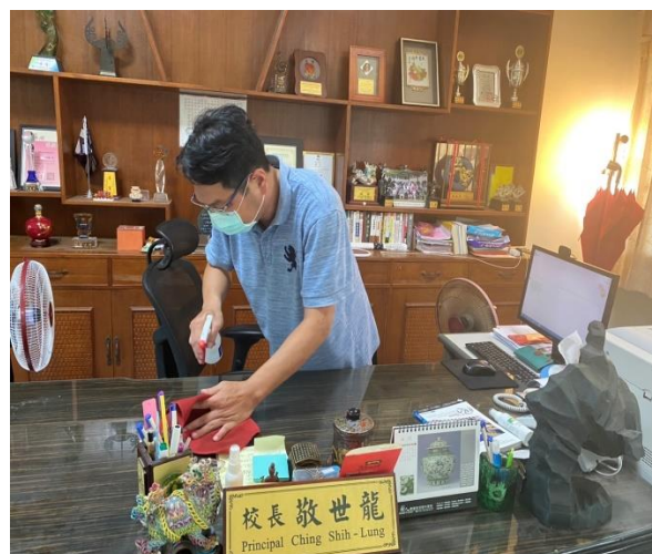
說明：校長帶領教職員清潔打掃防疫