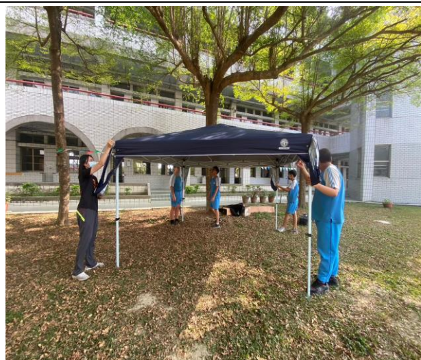
說明：教師與學生一同整理佈置場地