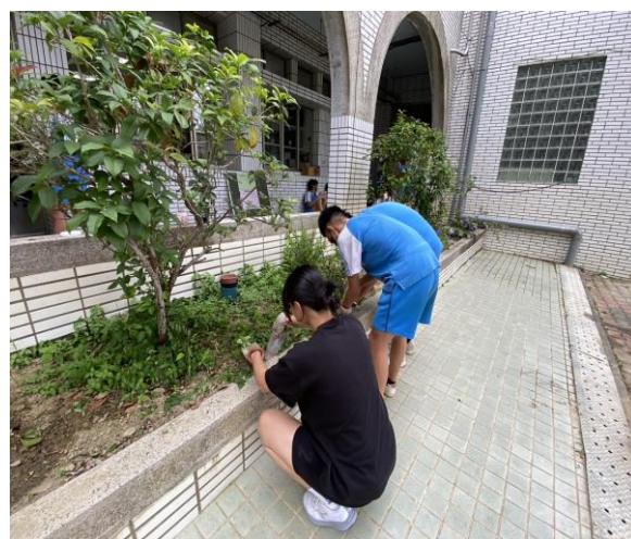
說明：教師與學生一起打掃校園環境