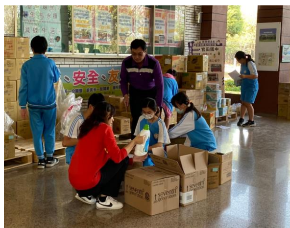
說明：校長帶領師生分配發放愛心物資