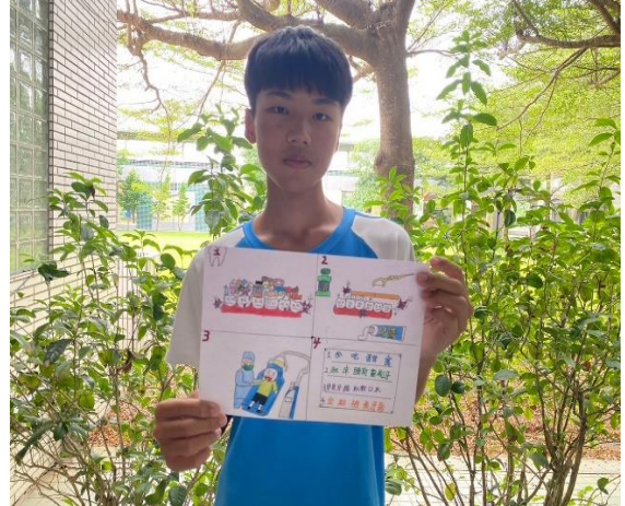
說明：健康促進標語-口腔保健