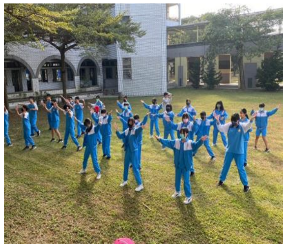
說明：體適能王比賽辦法