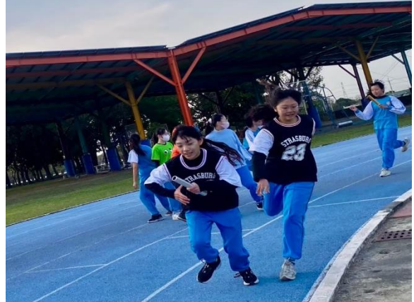
說明：全校大隊接力比賽