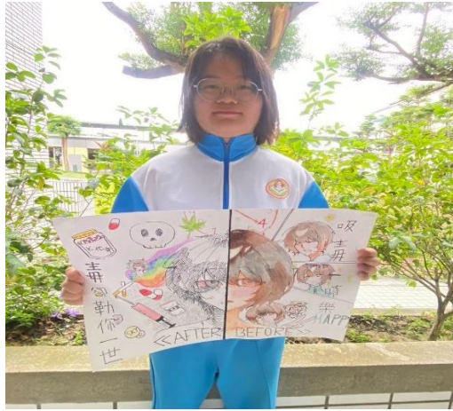
說明：健康促進標語-反毒