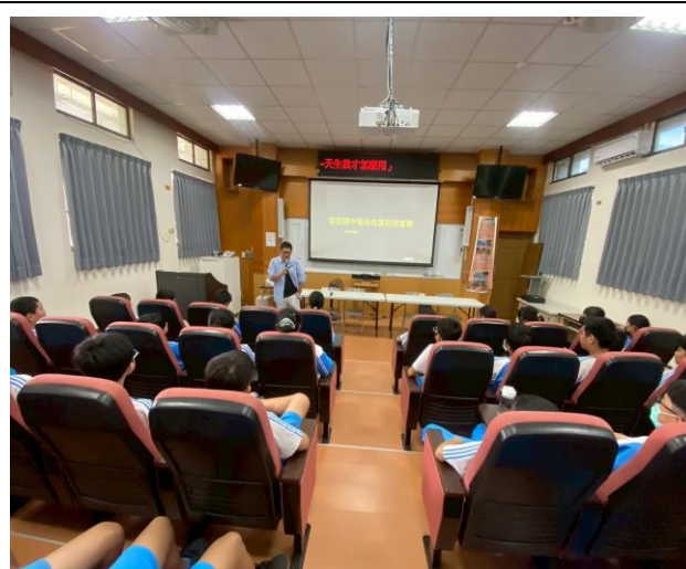
毒品危害防治宣導