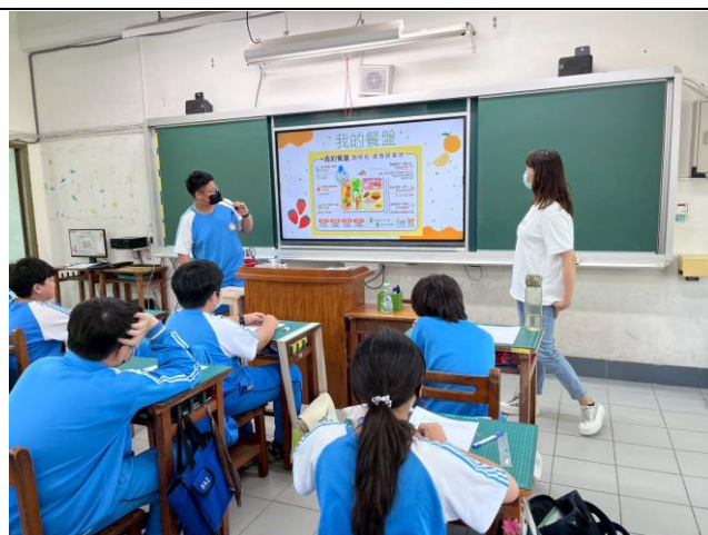
健康餐盤-心得分享