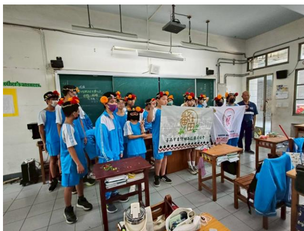
西拉雅文化-花環製作