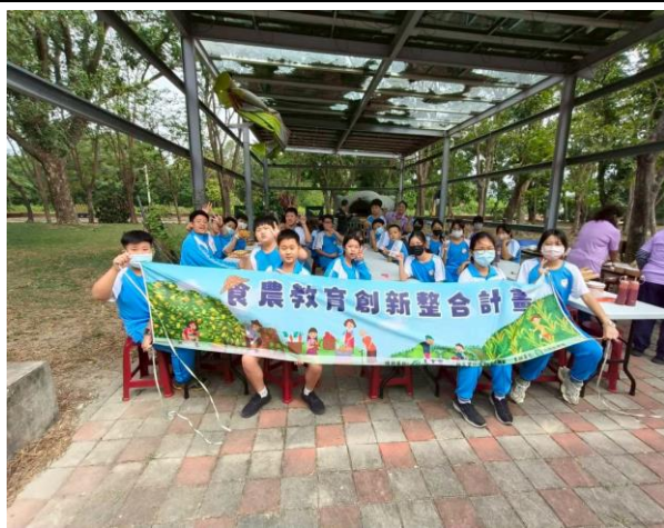
四健會結合在地食材窯烤披薩