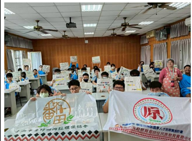
西拉雅文化-購物袋製作