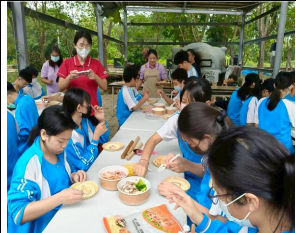
四健會結合在地食材窯烤披薩