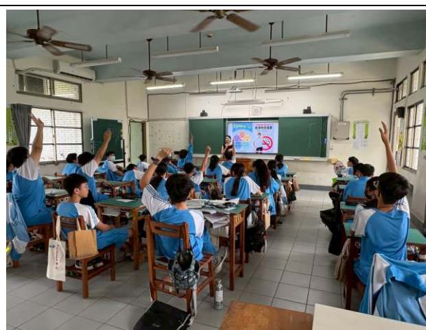
衛生所入班宣導菸檳防治