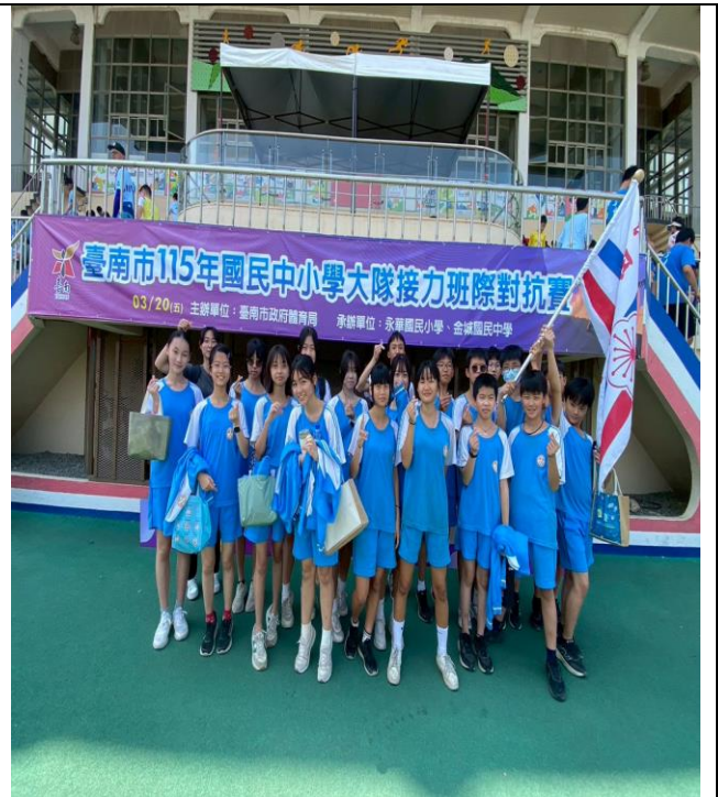
參與普及化運動-大隊接力