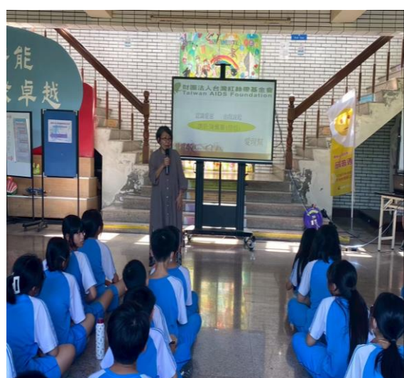
說明：愛滋教育宣導