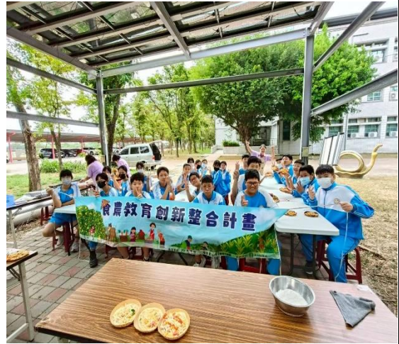
說明：食農教育課-窯烤披薩