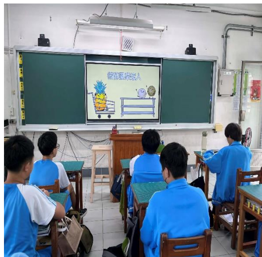
說明：餐前5分鐘主題宣導