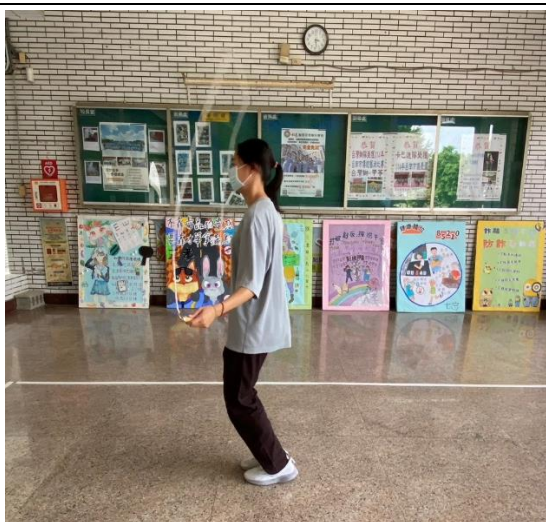
說明：教師利用課間運動