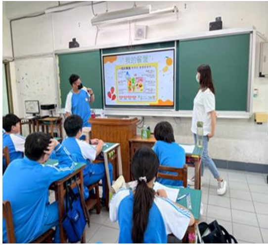
說明：我的餐盤教學