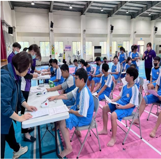
說明：健康服務-新生健康檢查