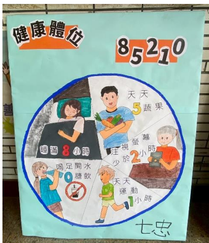
說明：運動會健康促進議題海報