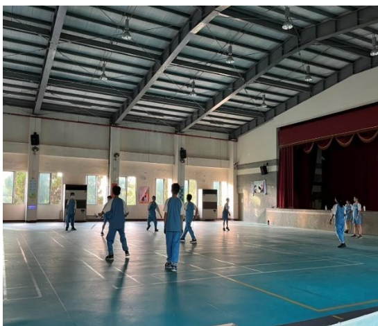
說明：SH150樂活活動-打羽球