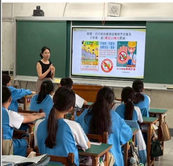
說明：防制菸檳教育