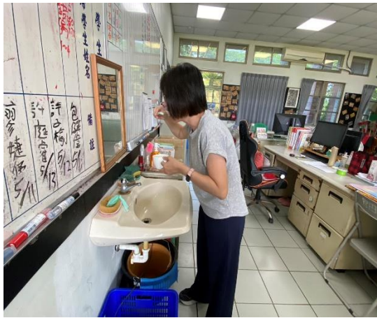
說明：推動餐後潔牙-教師