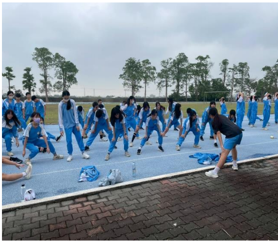
說明：週三晨間活動