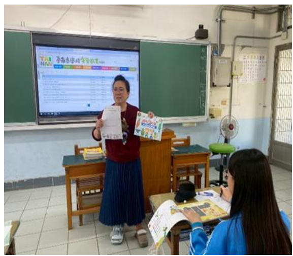
說明：導讀餐前五分鐘專書