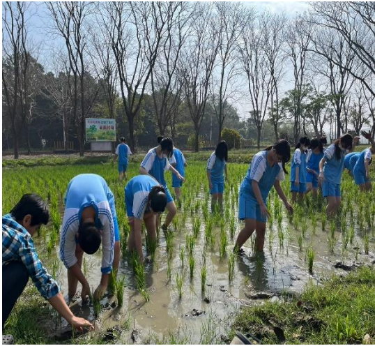
說明：食農教育課-孳草