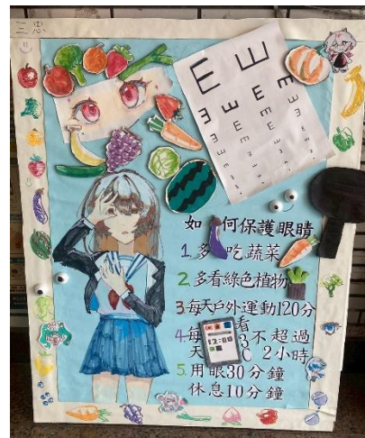
說明：運動會健康促進議題海報