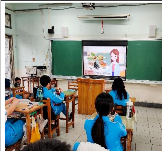
說明：餐前 5 分鐘主題宣導