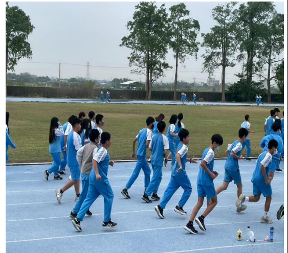
說明：週三晨間運動跑步