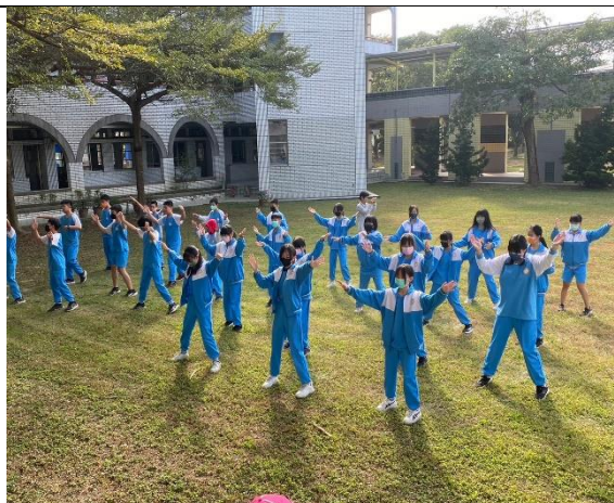
說明：辦理全校健康操比賽