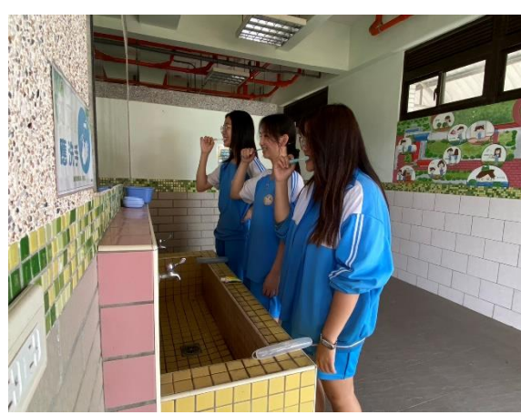
說明：推動餐後潔牙-學生