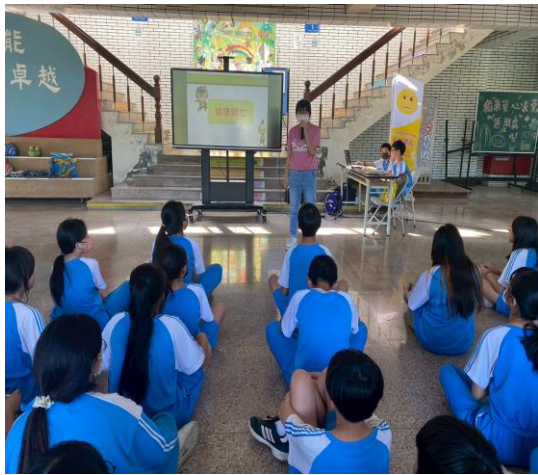
說明：健康體位宣導(減重)