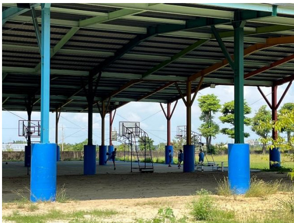
說明：SH150樂活活動-打籃球