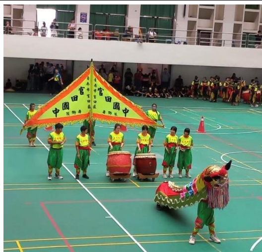
說明：推動多元運動社團-台灣獅