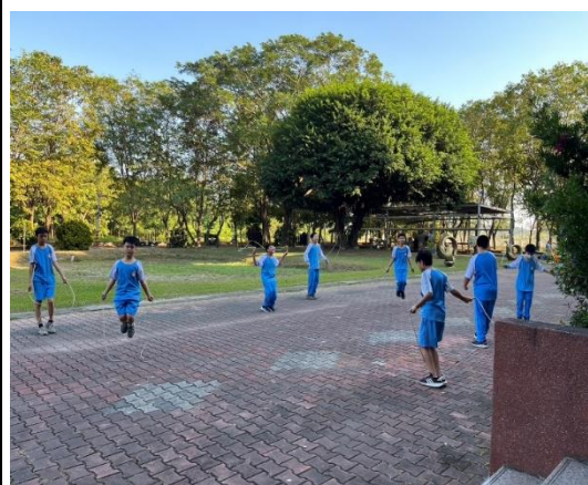
說明：SH150樂活活動-跳繩