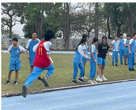
說明：辦理全校大隊接力比賽