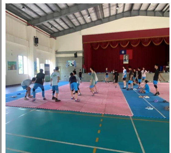
說明：推動多元運動社團-卡巴迪