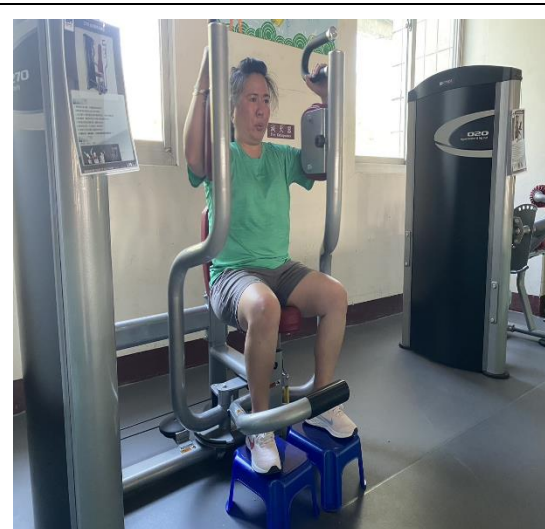
說明：教師利用課間運動