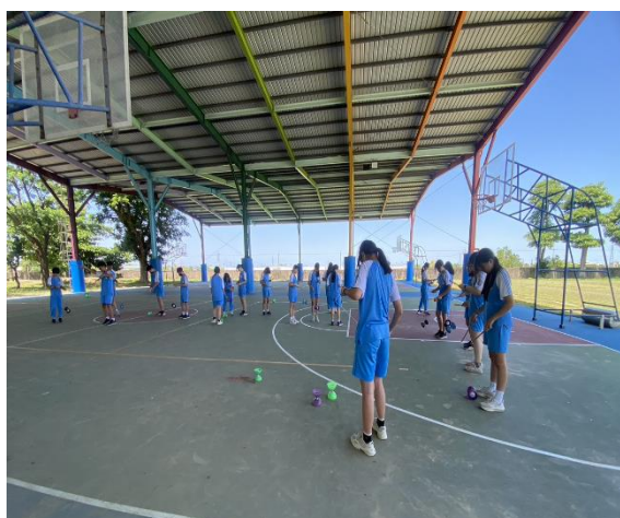
說明：SH150樂活活動-扯鈴