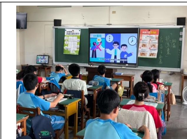
說明:利用 YOUTUBE 網路宣導抗生素使用方法