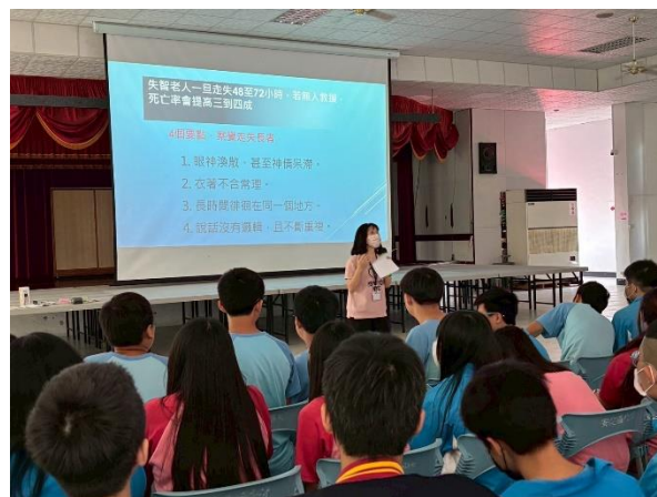
失智症的認識預防及友善