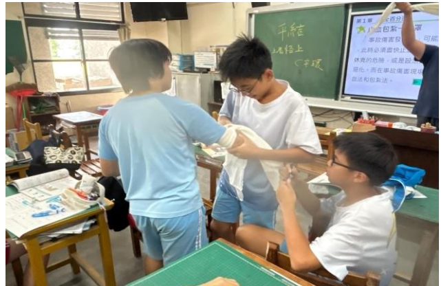
說明：學生學習包紮技巧。