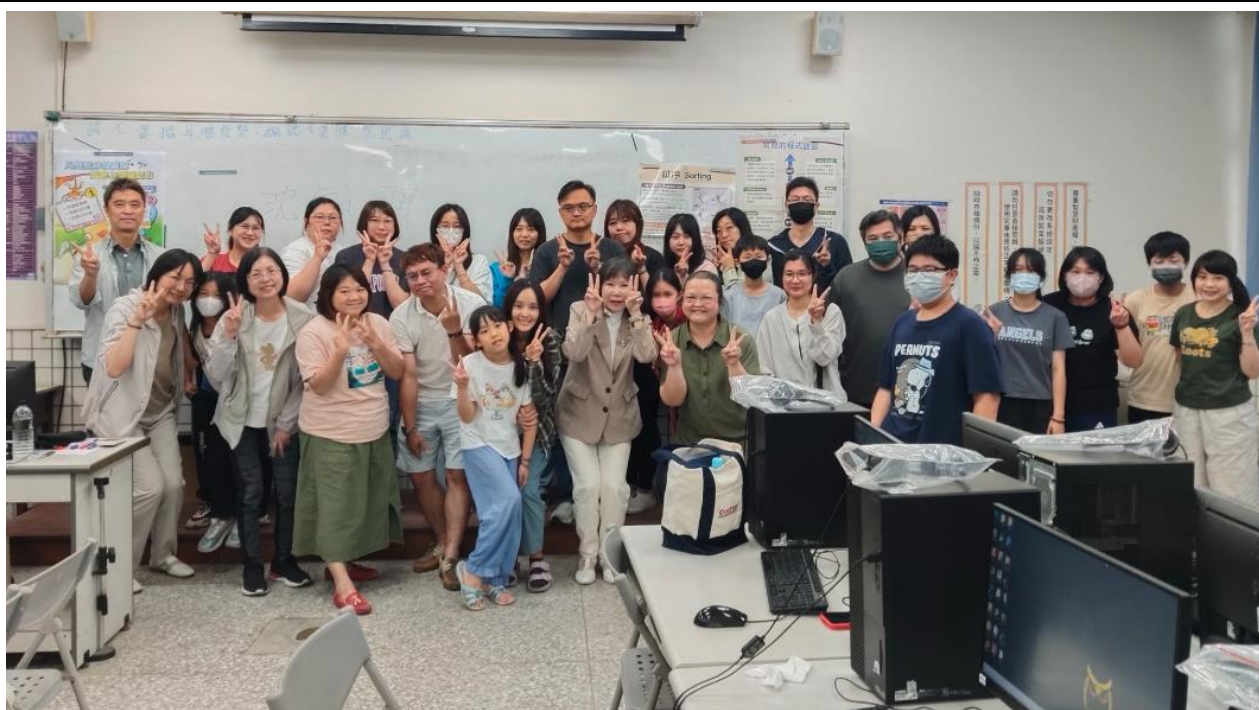
參與的社區居民和講師和主辦單位的大合照