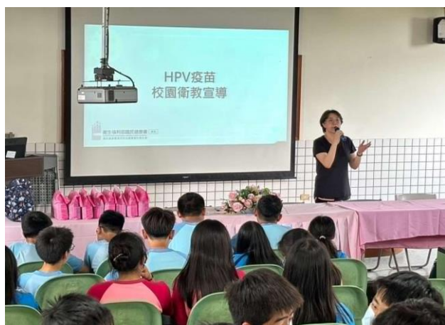
說明:施打 HPV 疫苗前與同學溝通何為 HPV?