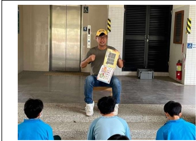
說明:利用健體課程宣導時食療重要性。