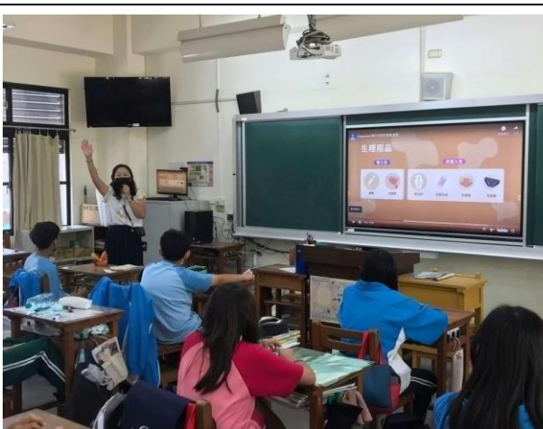
說明:利用創新實踐課程, 講解性教育與 HPV 相關內容。