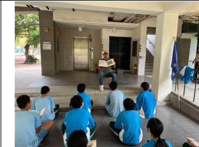
說明:營養成分攝取及注意事項。