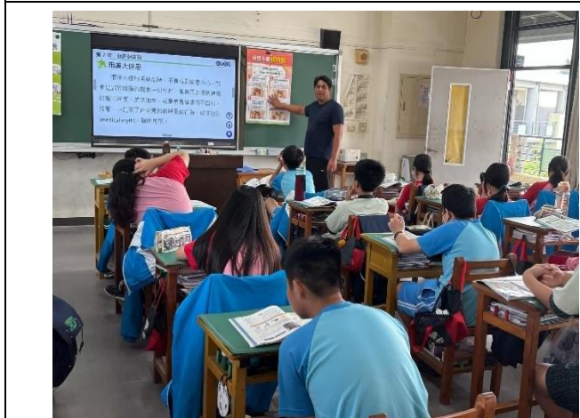
說明:宣導用藥相關知識及看診注意事項。