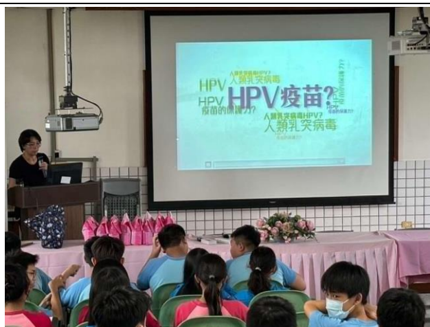
說明:利用學生生活教育時間宣導 HPV 疫苗。