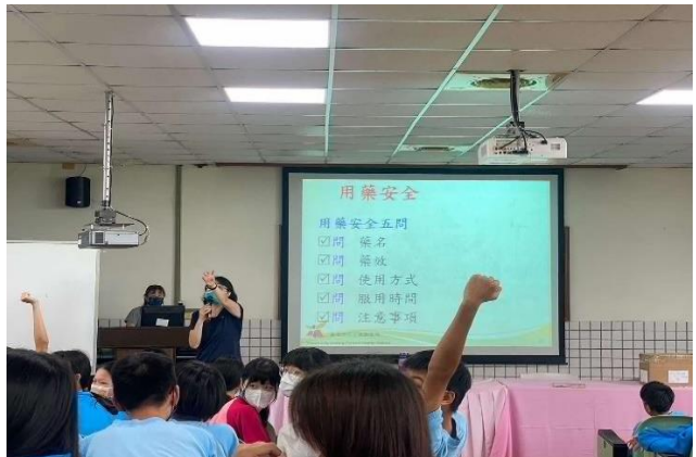
說明：用藥安全宣導搶答。