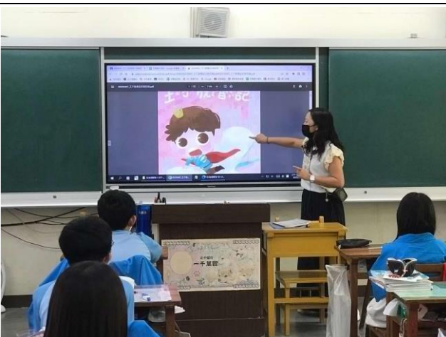
說明:體衛組長說明月經與 HPV 相關性。