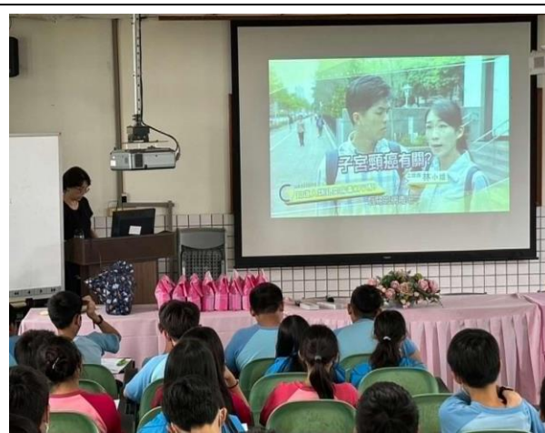
說明:利用影片告知子宮頸癌和陰莖癌根源。