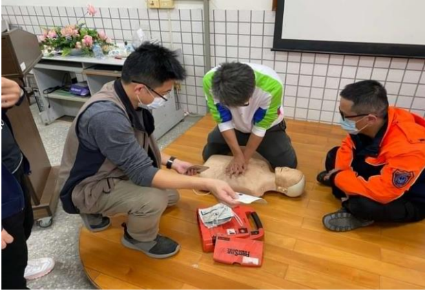
說明：針對教師和學生 CPR 講習。