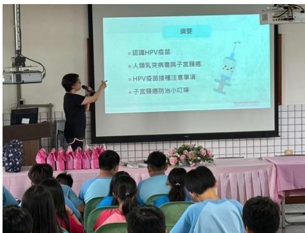
說明:HPV 疫苗及相關病毒說明。