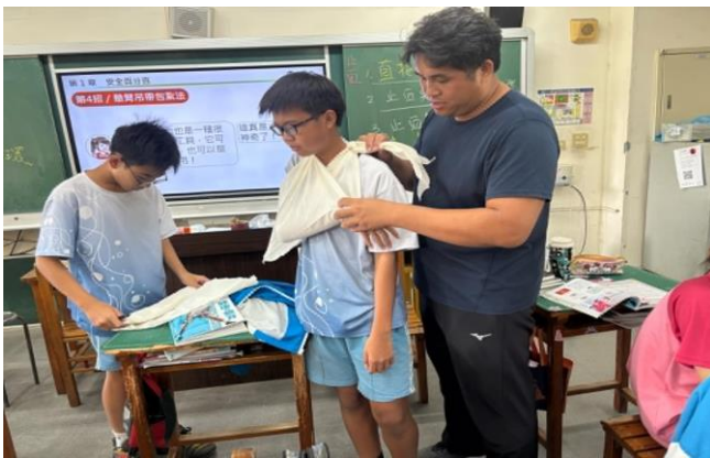
說明：聘請防護員教導學生包紮技巧。