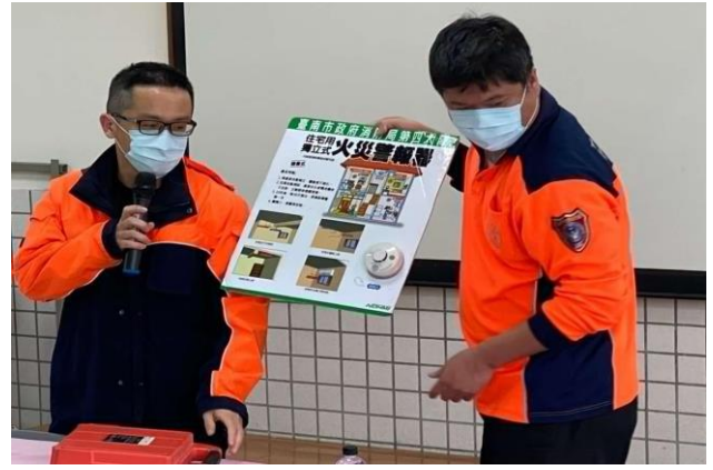
說明：消防隊到本校做家庭防災宣導活動。