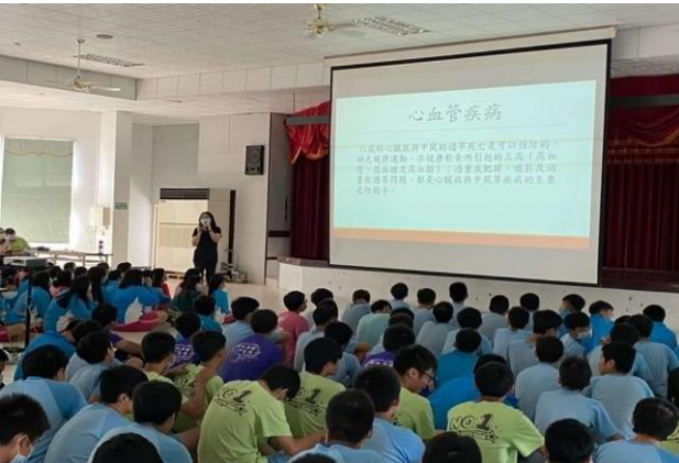
說明：相關健康議題宣導—心血管疾病。