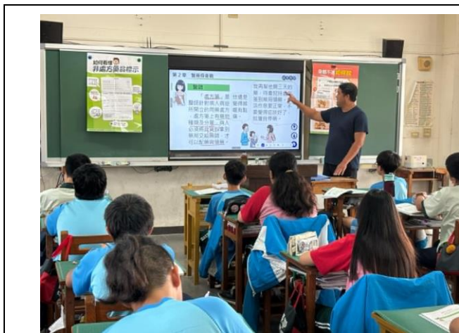
說明:利用健康與體育課時間宣導用藥安全。