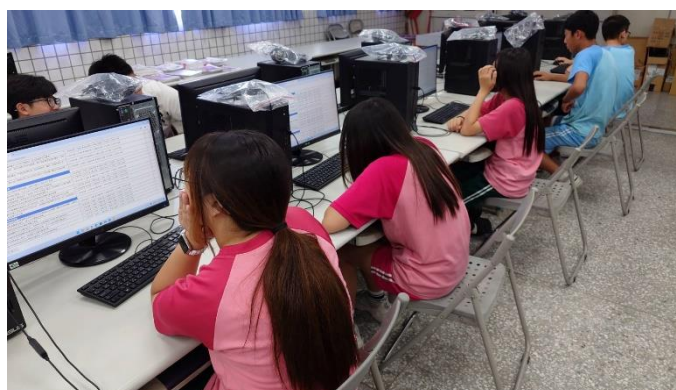
人權問卷施測情況