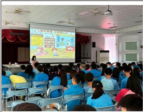
說明：菸害防治宣導一