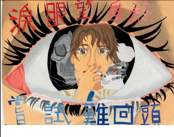
說明：班級壁報呈現