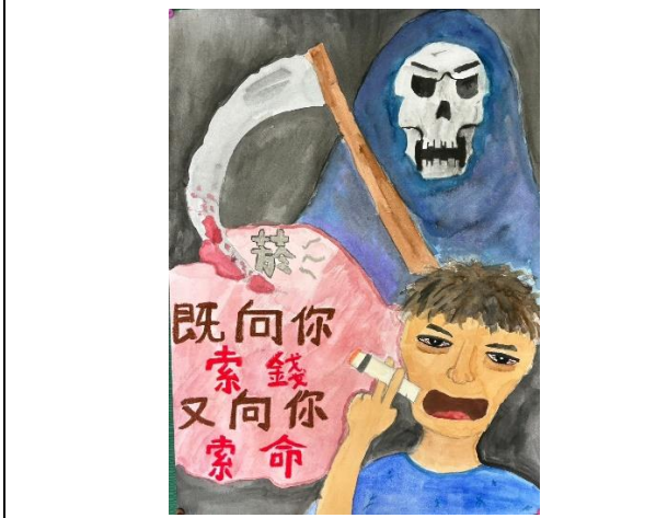
說明：健促標語設計比賽學生作品一