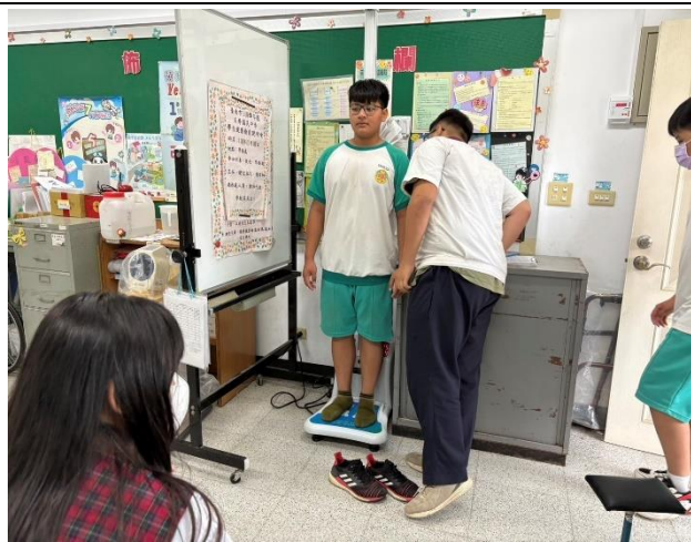
說明：成立體重控制班。