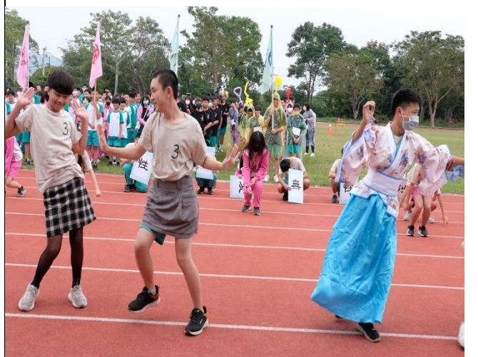
說明：運動會推動健促議題(創意進場)。