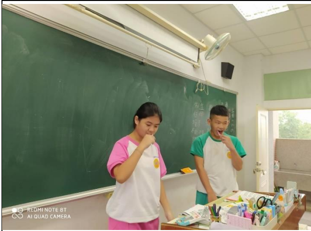
說明：全校潔牙活動。