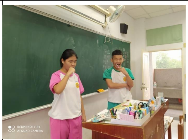
說明：全校潔牙活動。