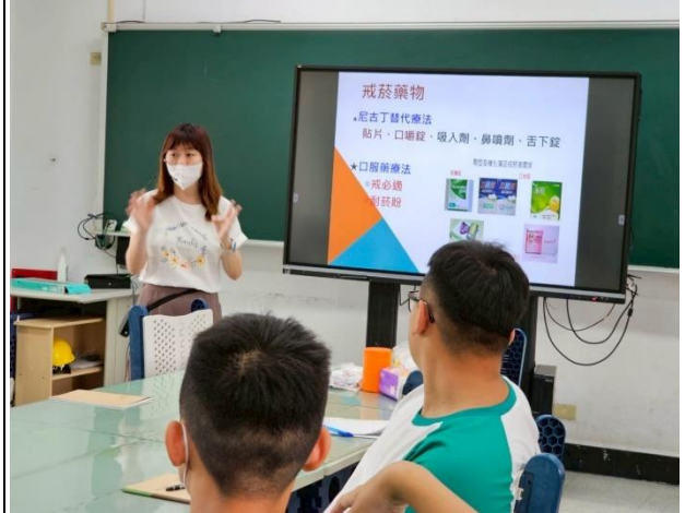
說明：成立拒菸大使班。