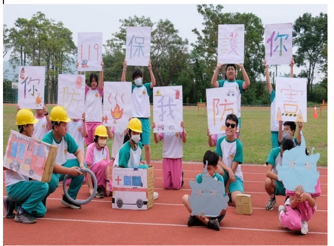
說明：運動會推動健促議題(創意進場)。