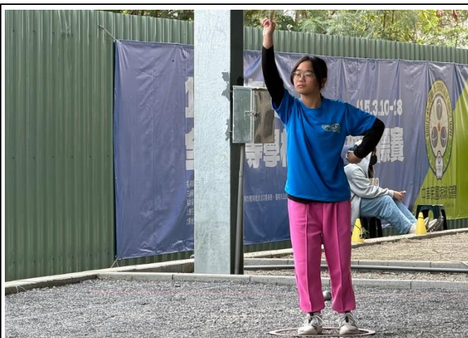
說明：榮獲114年全國中等學校法式滾球女子雙打第一名。