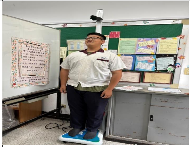
說明：成立體重控制班。