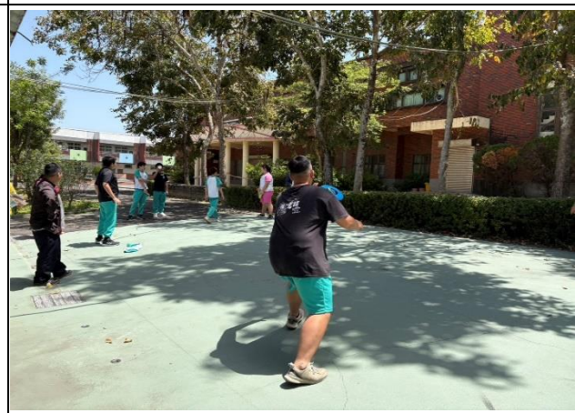
說明：成立體重控制班。