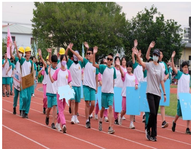
說明：運動會推動健促議題(創意進場)。