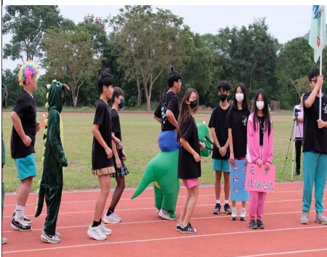
說明：運動會推動健促議題(創意進場)。