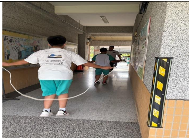
說明：成立體重控制班。