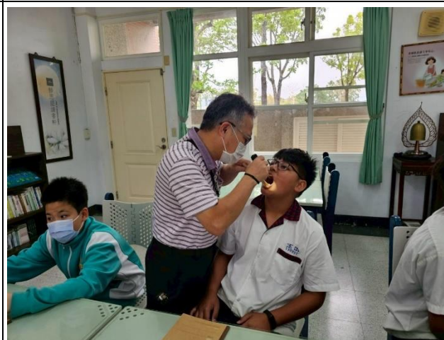
說明：醫師檢查抽菸學生口腔。