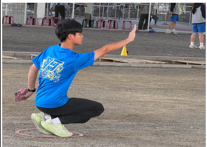
說明：榮獲114年全國中等學校法式滾球混雙第一名。