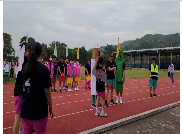
說明：運動會推動健促議題(創意進場)。