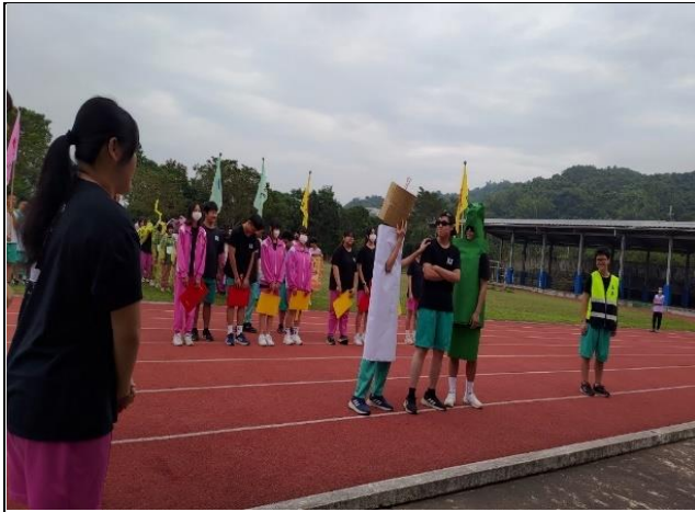
說明：運動會推動健促議題(創意進場)。