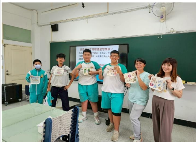
說明：成立拒菸大使班。