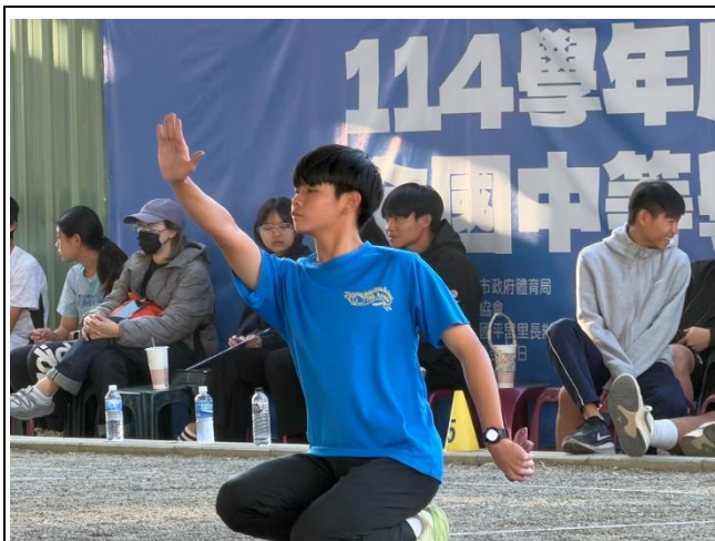
說明：榮獲114年全國中等學校法式滾球混雙第一名。