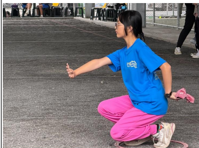
說明：榮獲114年全國中等學校法式滾球女子雙打第一名。