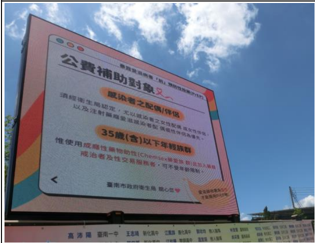
說明：透過本校跑馬燈提供民眾訊息。