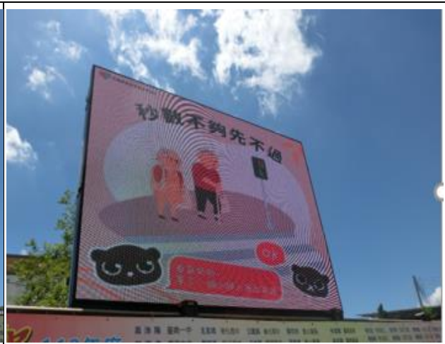
說明：透過本校跑馬燈提供民眾訊息。