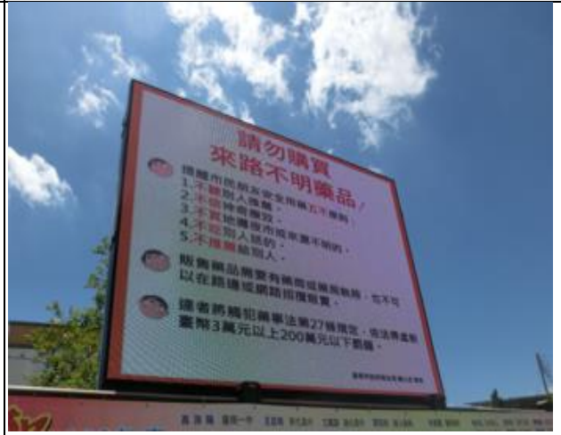
說明：透過本校跑馬燈提供民眾訊息。