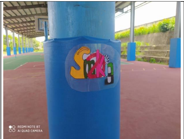
說明：製作成反菸貼紙，張貼於校園內。