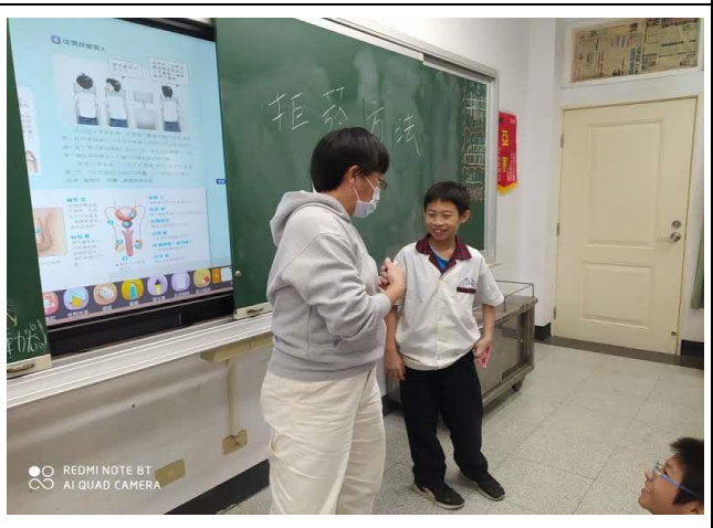
說明：利用實際演練，讓學生拒絕菸害。