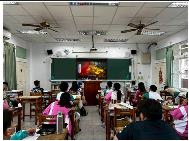
說明：學生設計一日健康飲食菜單。