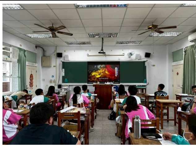
說明：學生設計一日健康飲食菜單。