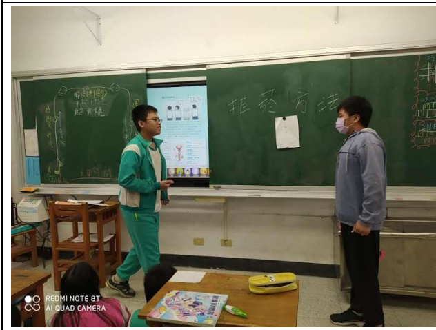
說明：利用實際演練，讓學生拒絕菸害。