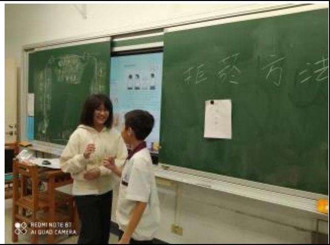
說明：利用實際演練，讓學生拒絕菸害。