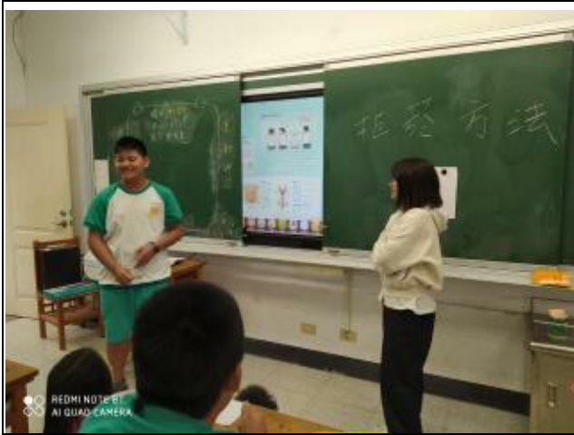
說明：利用實際演練，讓學生拒絕菸害。