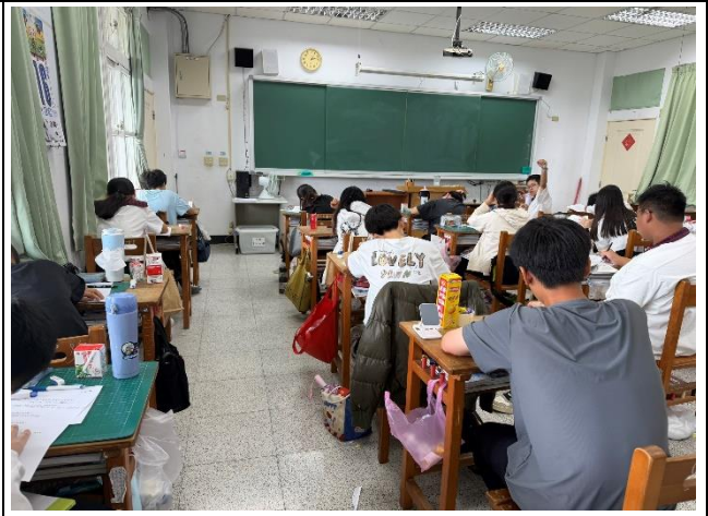
說明：學生設計一日健康飲食菜單。