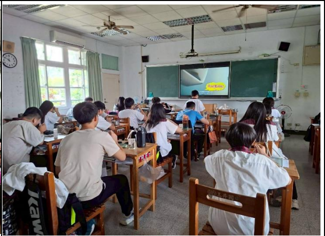
說明：學生設計一日健康飲食菜單。