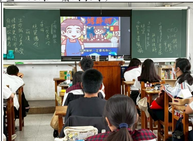
說明：午餐健康飲食影片宣導。