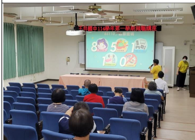
說明：親子講座宣導健康促進議題。