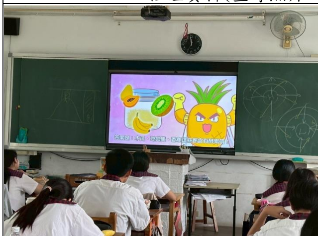
說明：午餐健康飲食影片宣導。