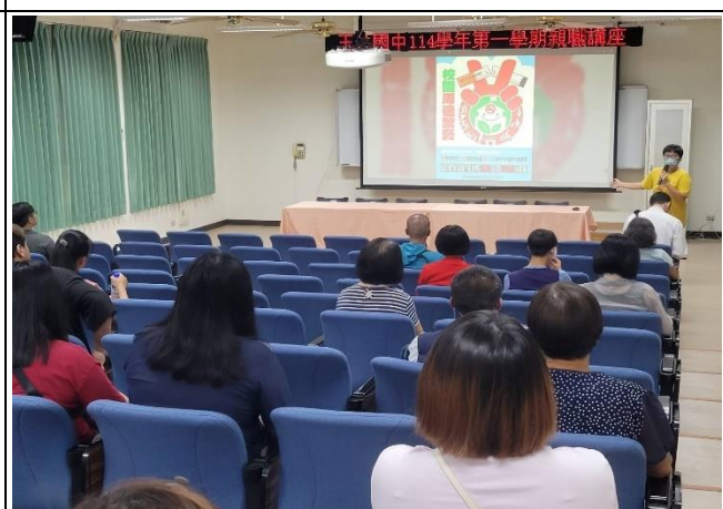
說明：親子講座宣導健康促進議題。