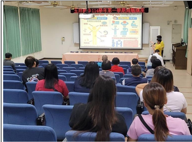
說明：親子講座宣導健康促進議題。