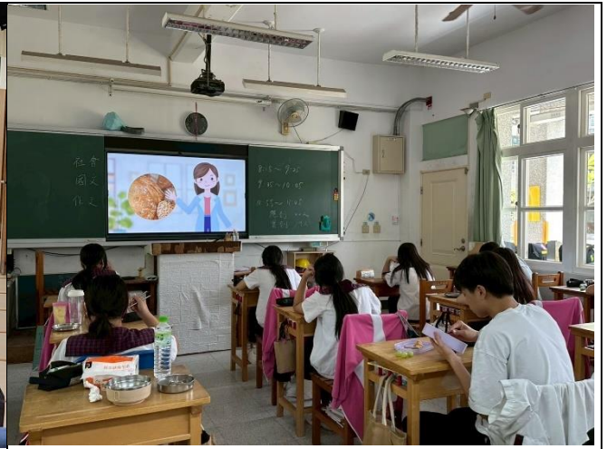
說明：午餐健康飲食影片宣導。