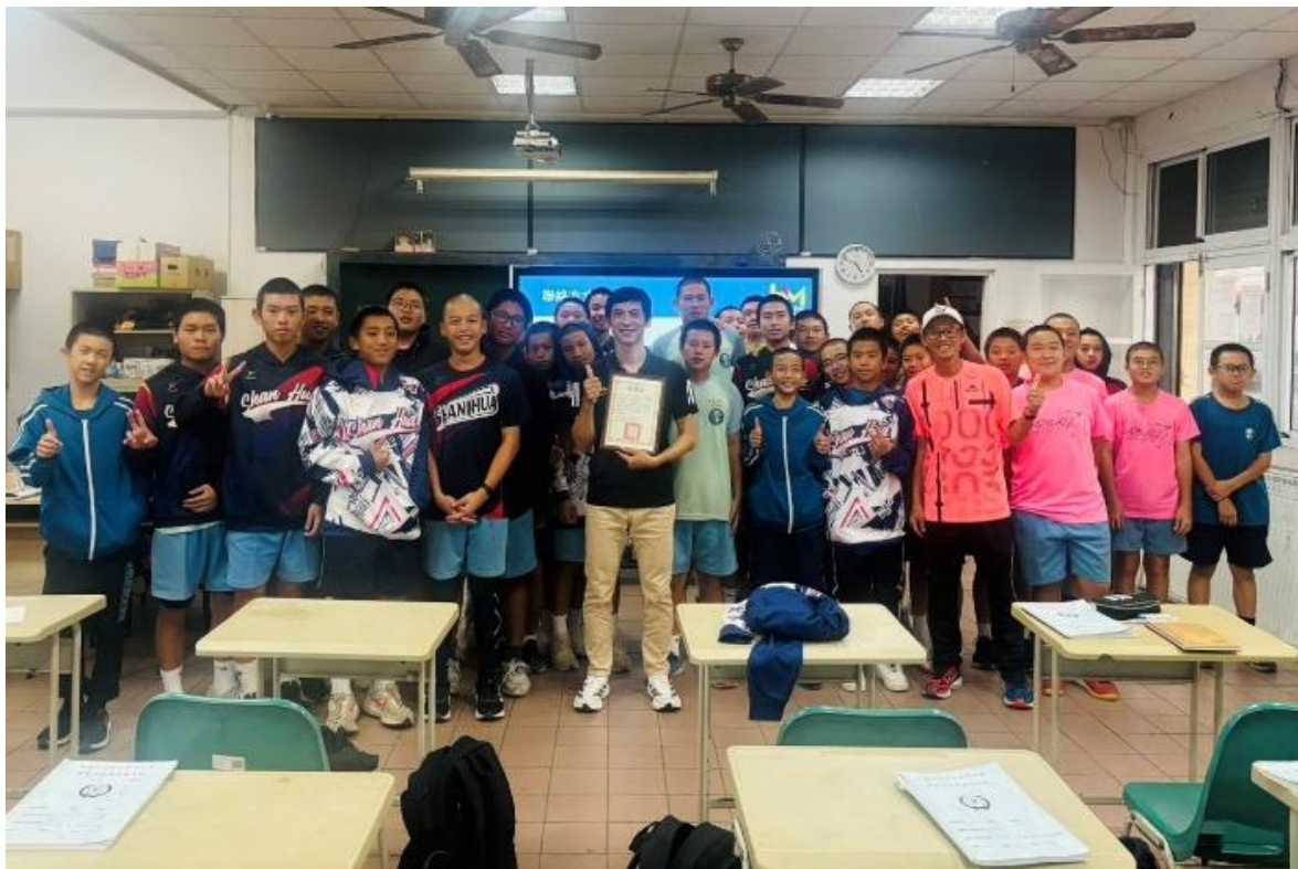
說明：運動正向心理學的認識