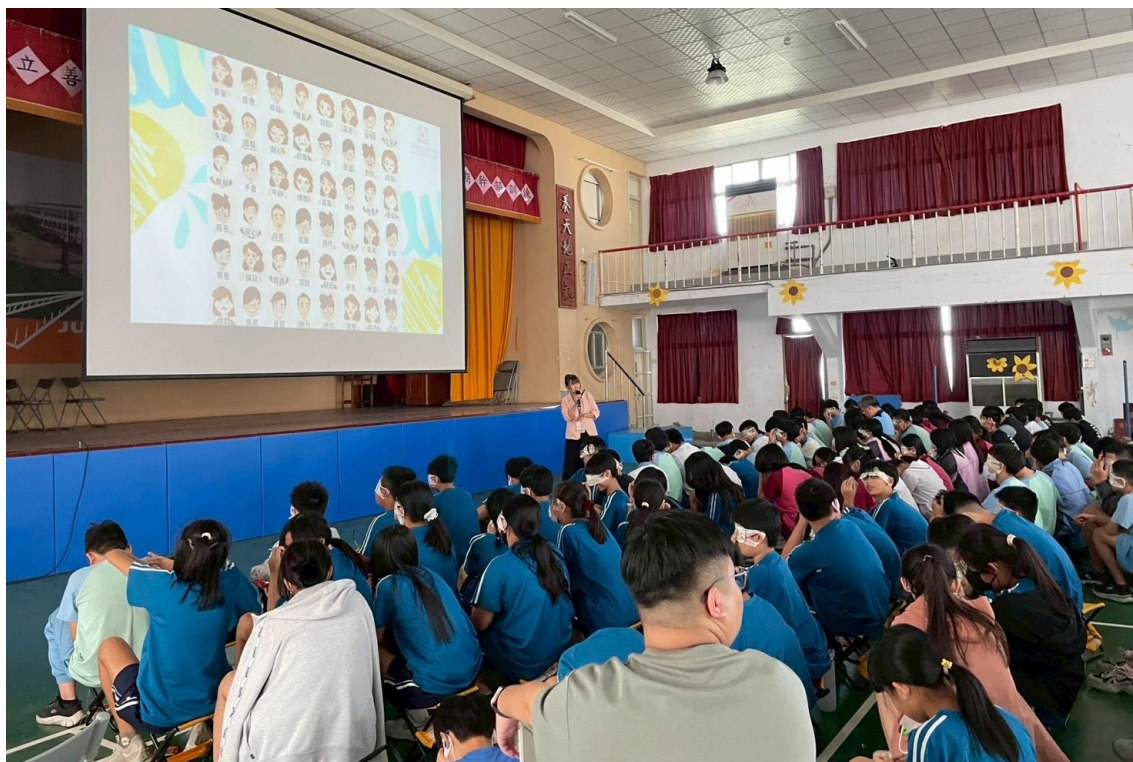
說明：情緒圖-認識情緒