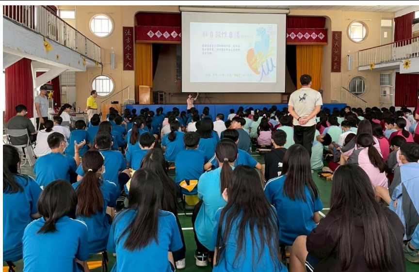
說明：面對非自殺性自傷-回應方式