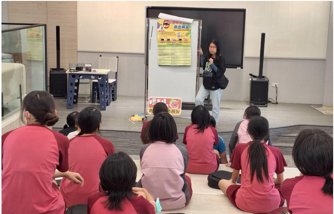
說明：青春不交檳朋友-菸檳防治宣導