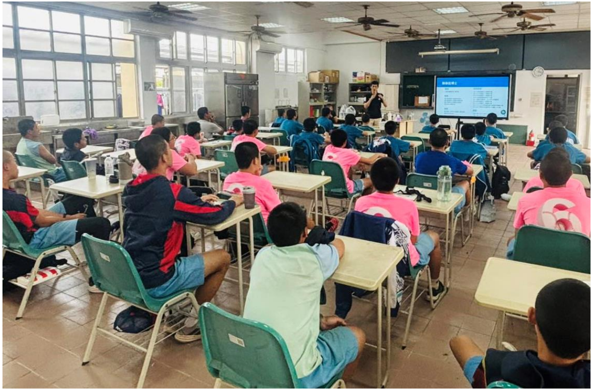
說明：運動正向心理學的認識