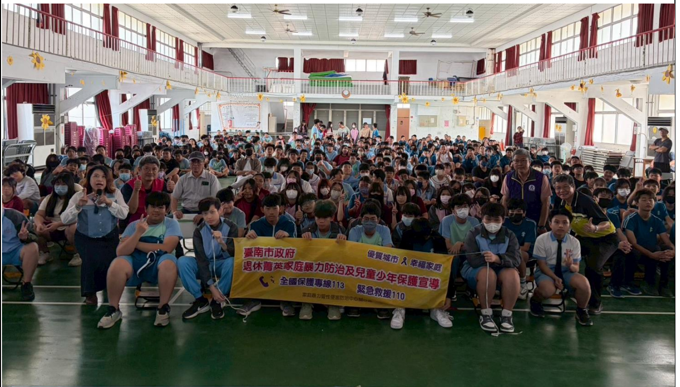
說明：活動留影合照