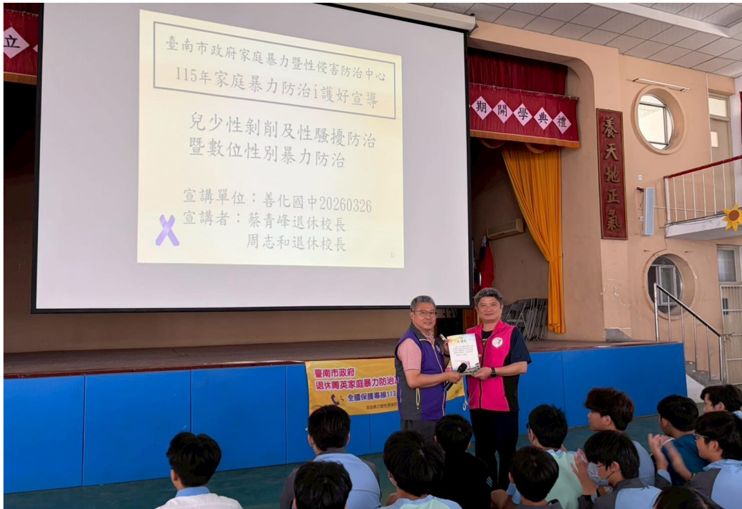
說明：身體自主與界限