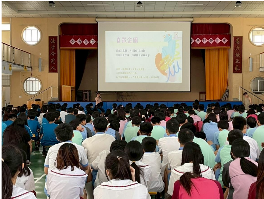
說明：面對有自殺企圖的回應方式