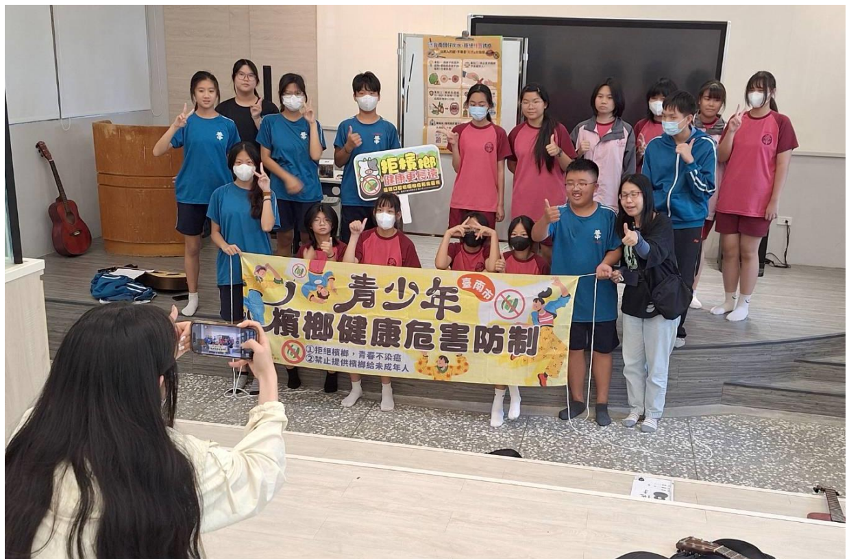
說明：身體界線-身體紅綠燈