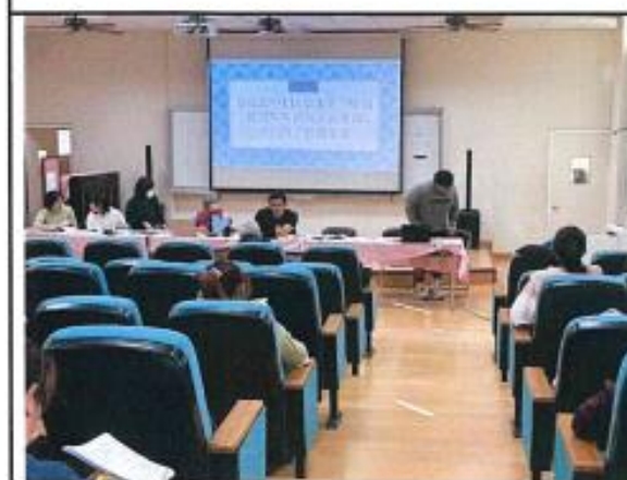
圖說2說明本學期性平入班各年級內容