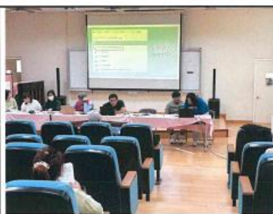
圖說3說明校網下載性平入班資料位址