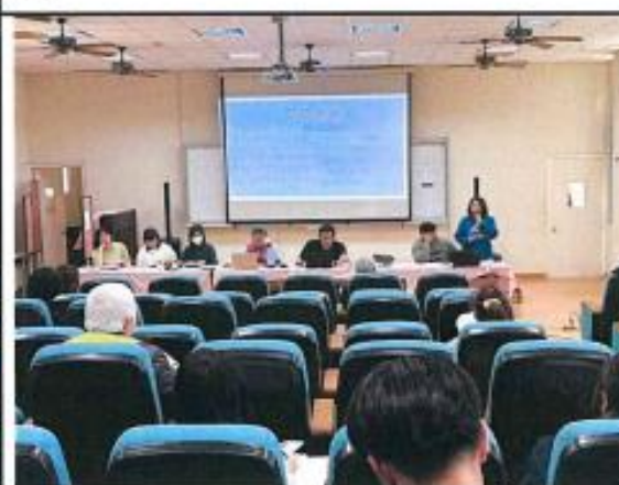
圖說4說明各項關各項關懷專線