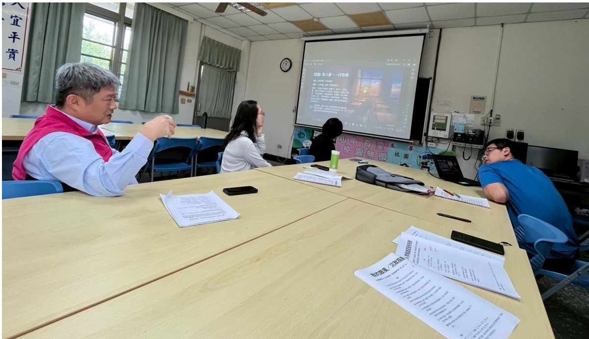
教師社群—SEL 議題影片與融入課程討論