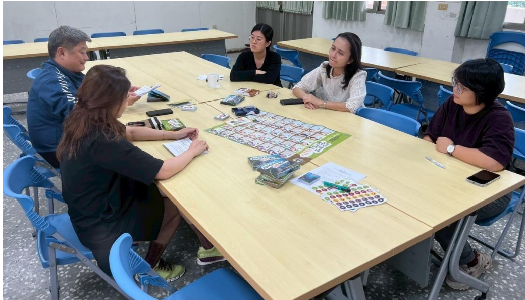
教師社群—SEL 主題討論