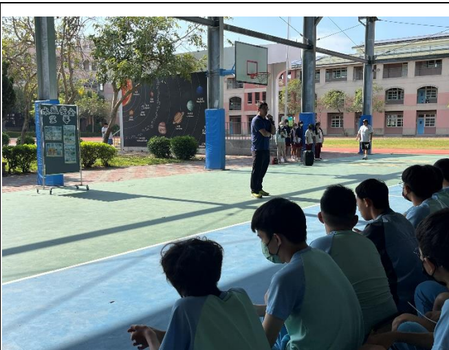
朝會宣導-全體師生