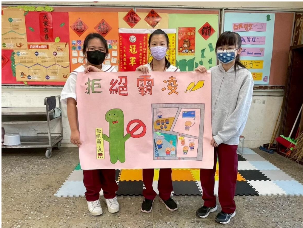
SEL 議題融入課程-海報製作