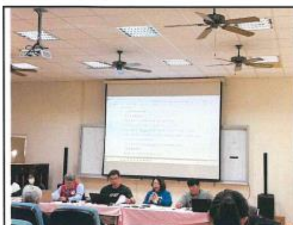
圖說1說明各項兒少保護及通報