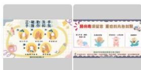
1) 正確勤洗手,手護你和我.PNG 2) 腸病毒須留意重症前兆急就醫.PNG