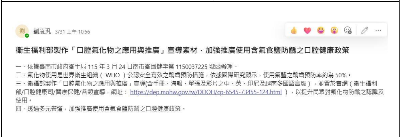
說明：teams-公告口腔相關宣導素材