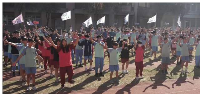
校慶運動會全校熱舞表演