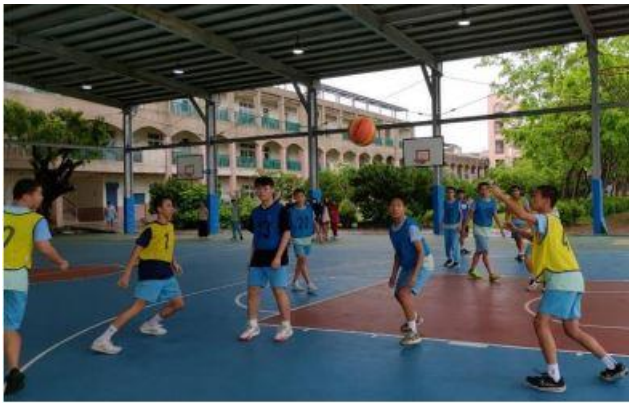
辦理九年級班際五對五籃球比賽