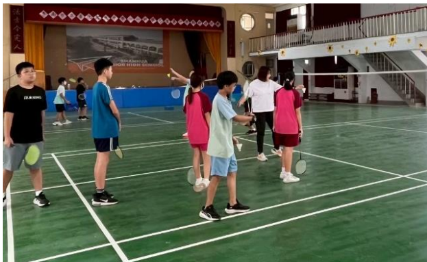
成立運動性社團-目加溜灣社