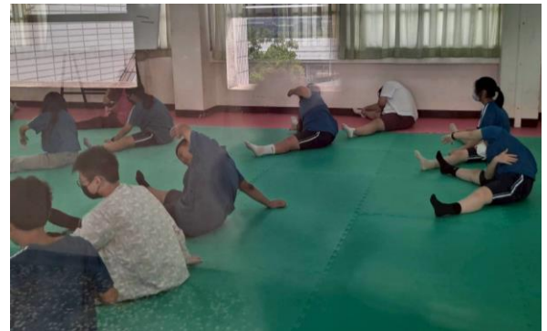
114-1體控班體重改善獎勵名單