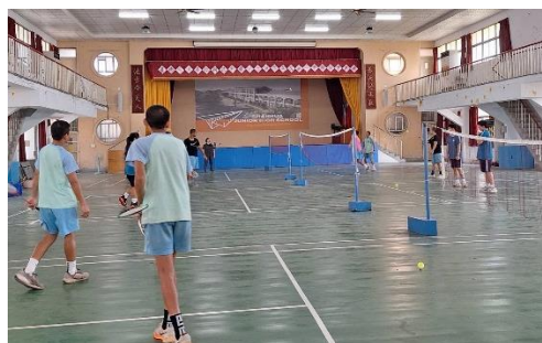
體控班學生利用早自修自主減重管控