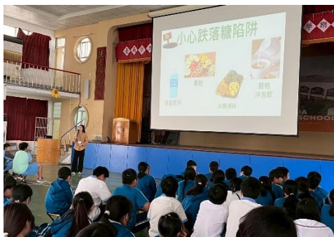
衛生所辦理營養與飲食教育宣導