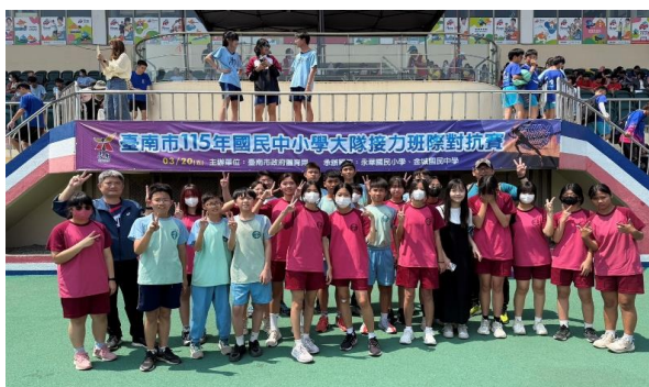
參加台南市普及化運動-班際大隊接力