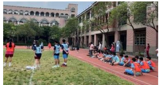
成立運動性社團-帶式橄欖球社