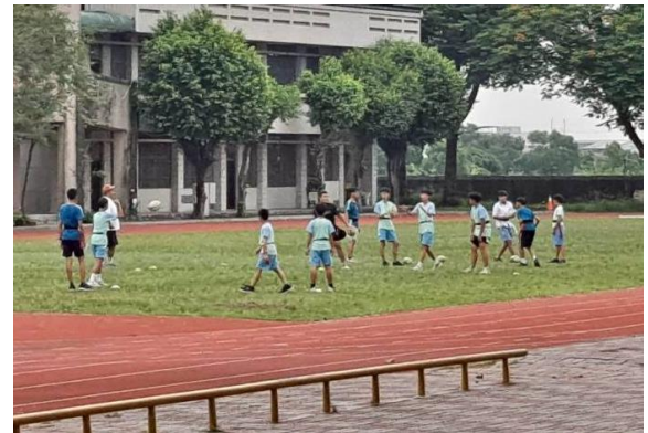
成立運動性社團-熱舞社