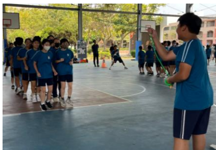
成立運動性社團-羽球社