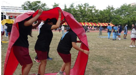
校慶運動會辦理多項運動項目-趣味競賽