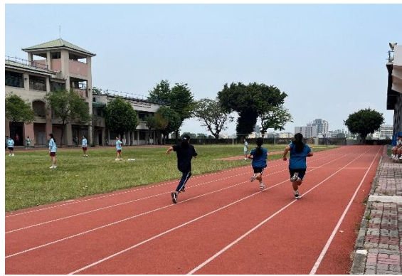
鼓勵學生參加校外運動比賽-田徑(早修晨練)