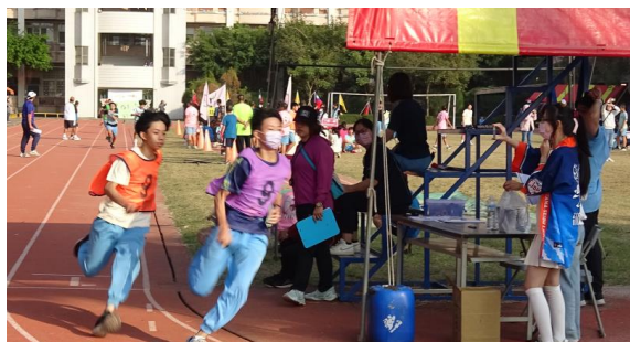
校慶運動會辦理多項運動項目-大隊接力