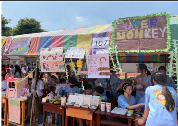
班級提供自備環保杯折價優惠