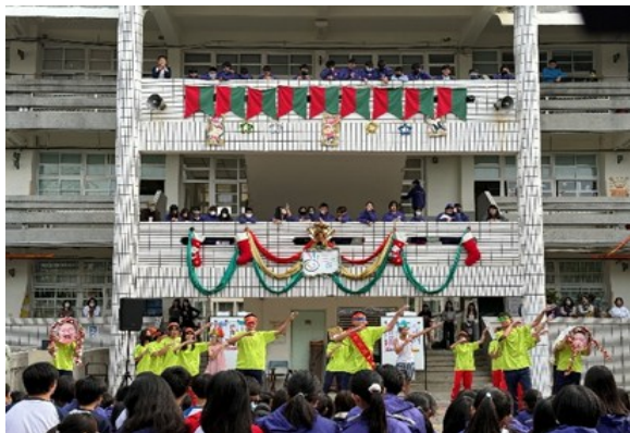
歲末感恩快閃表演，讓學生奉獻自己的才能帶給他人喜悅與溫暖