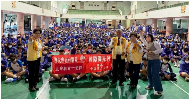
佛光山生命教育宣導