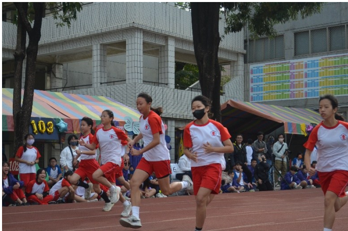
運動會設置各項田徑競賽