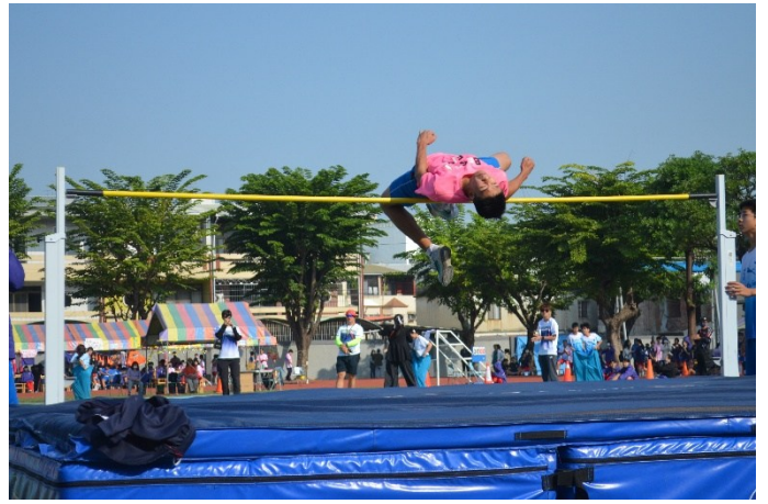
運動會設置各項田徑競賽