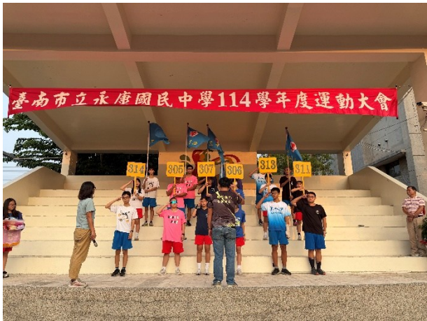
運動會精神總錦標頒獎