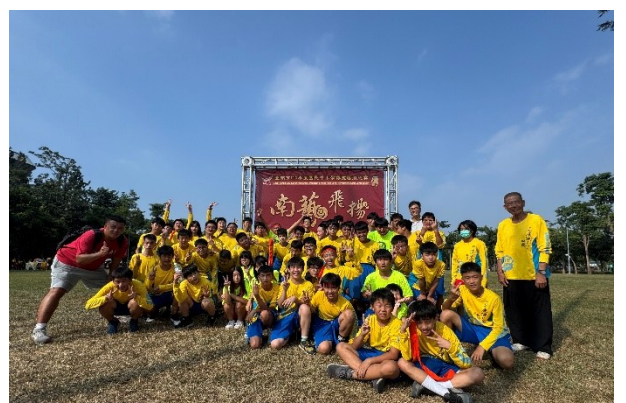
推廣民俗傳統藝陣