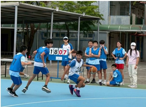
二年級班際籃球賽