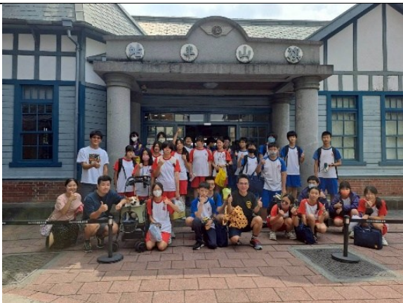
旗山地區走讀活動