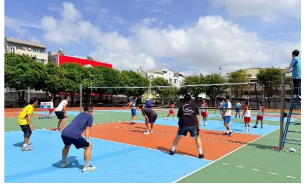
三年級班際排球比賽與師生對抗賽