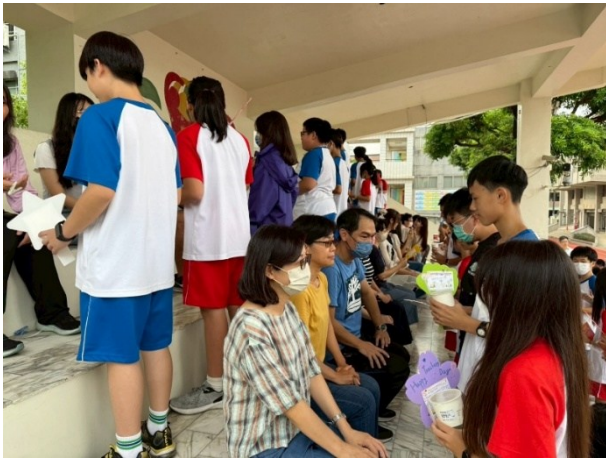
教師節感恩-各班代表獻感恩卡片與茶飲料