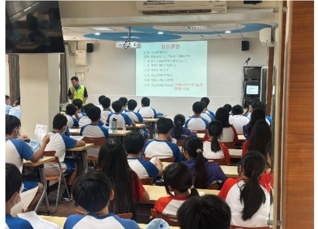
介穩反毒教育宣導