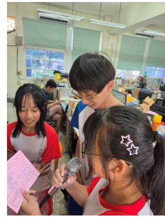
教師節感恩-廣播美聲傳愛活動~點歌單