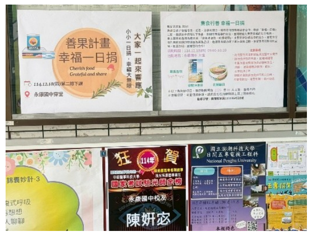
善果計畫校園宣導