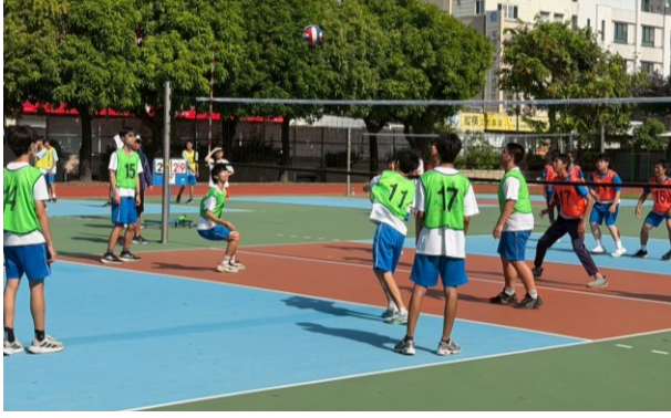
三年級班際排球比賽與師生對抗賽