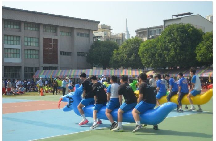
運動會設置全班參與之趣味競賽