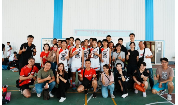
籃球校隊參加各項比賽