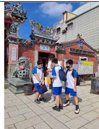
旗山地區走讀活動