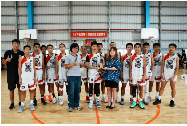
籃球校隊參加各項比賽