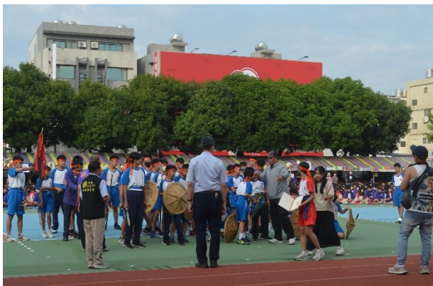
推廣民俗傳統藝陣