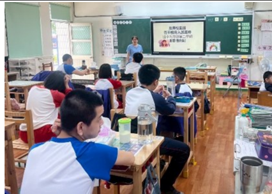
性平入班宣導-特教班