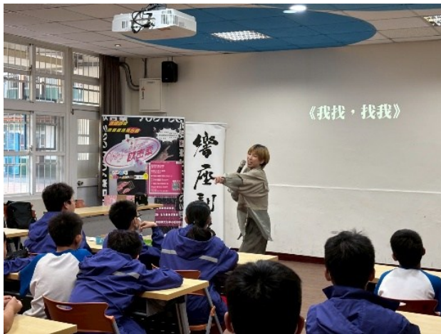
響座劇場《我找，找我》心理健康講座