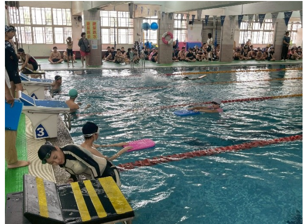
一年級游泳接力賽