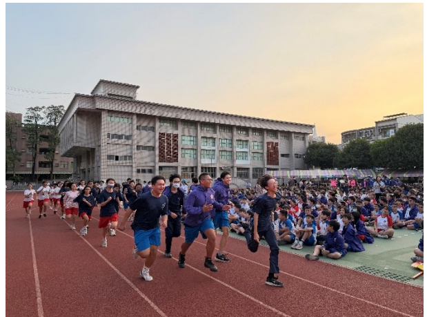
運動會獲獎班級跑步慶祝呼應