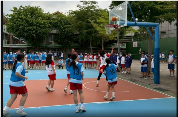
二年級班際籃球賽