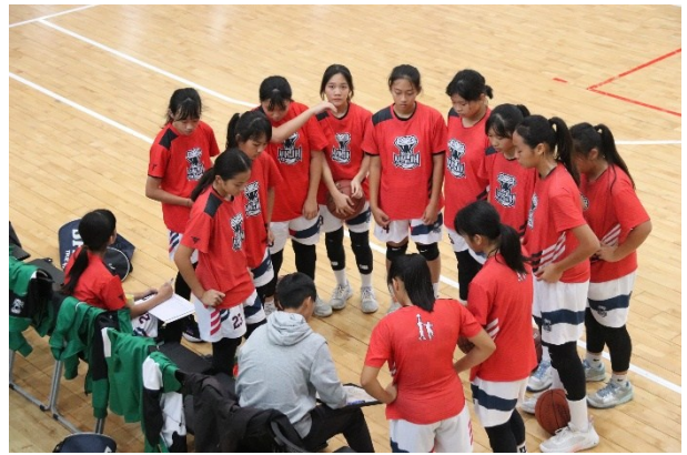
籃球校隊參加各項比賽