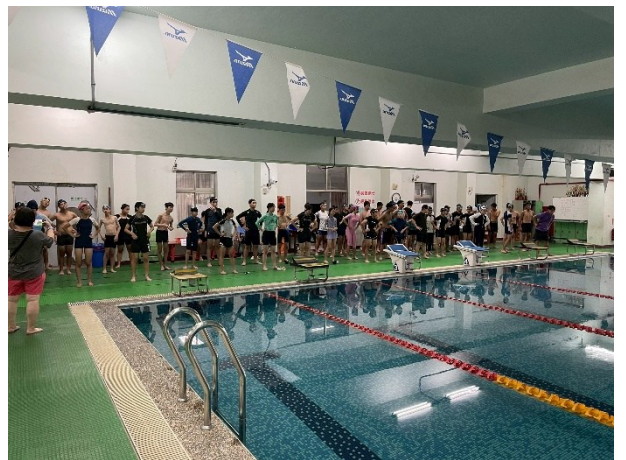
一年級游泳接力賽