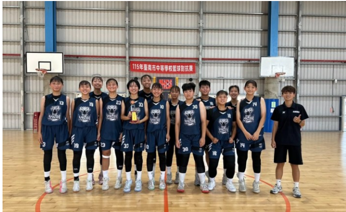
籃球校隊參加各項比賽