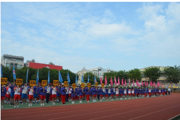
運動會運動員列隊