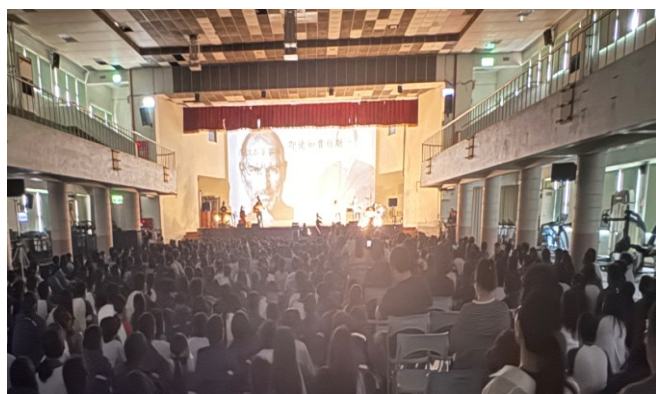
玫瑰墓樂團到校演唱宣導生命教育