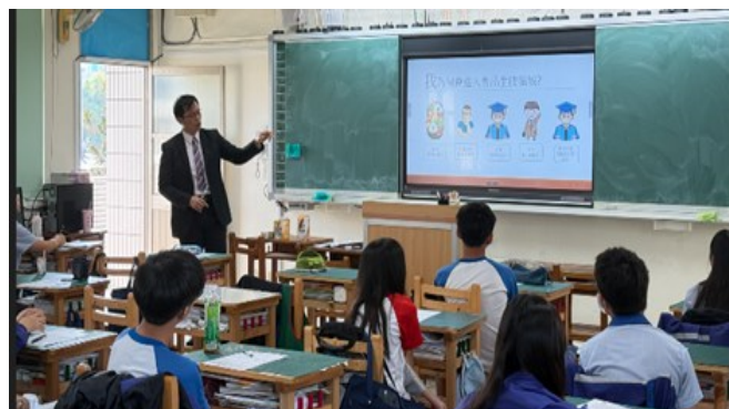
職業達人班級宣導_02