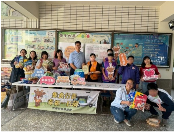
善果計畫校園宣導