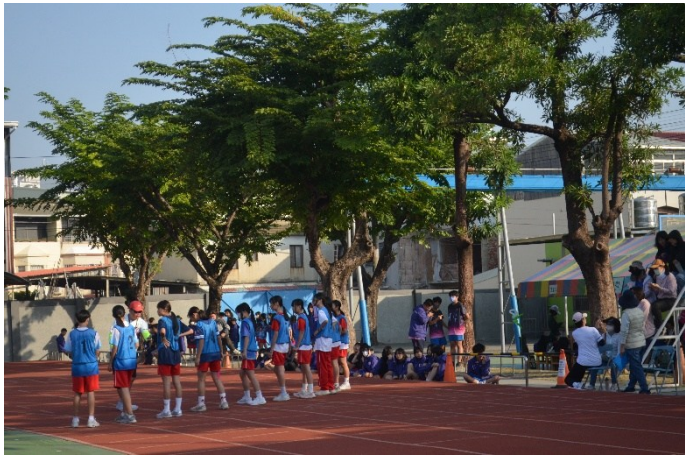
運動會設置各項田徑競賽