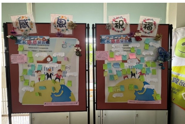
感恩與祝福留言板，表達對他人的感恩與祝福