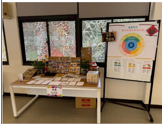
說明：食農社團成果發表