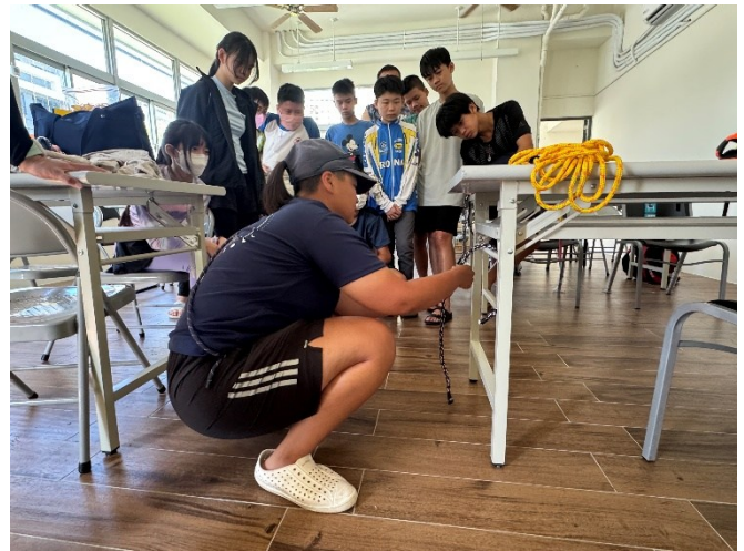
活動前水域安全教育與水中自救技能學習