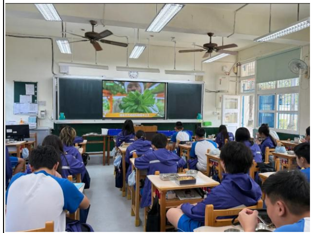
說明：菜中之王——菠菜