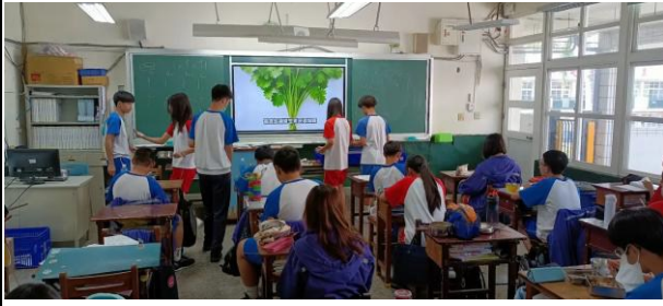
說明：為什麼有些人會討厭香菜！