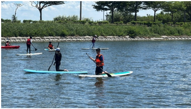
SUP、獨木舟操作與體驗