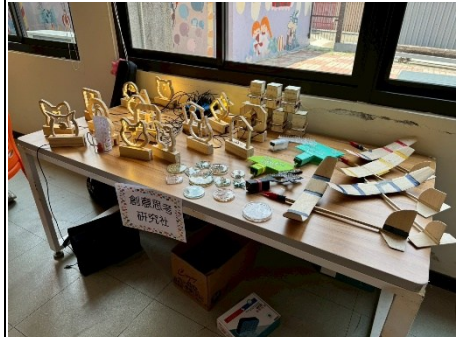
說明：其他社團靜態成果