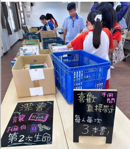
說明：學生參與選書