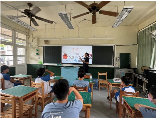
活動行前課程-認識台灣海岸線、水域活動