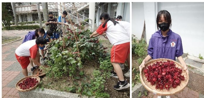
一年級學生綜合課程-校園探索，到農業教室觀察洛神葵。