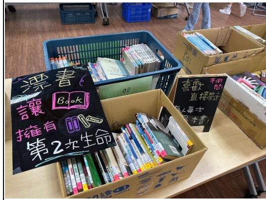
說明：漂書活動讓書有第2次生命