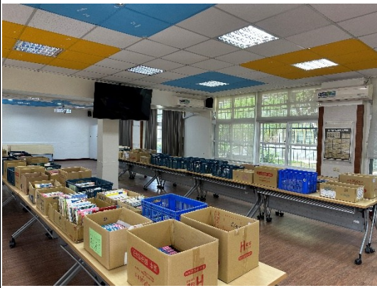
說明：事前整理舊書