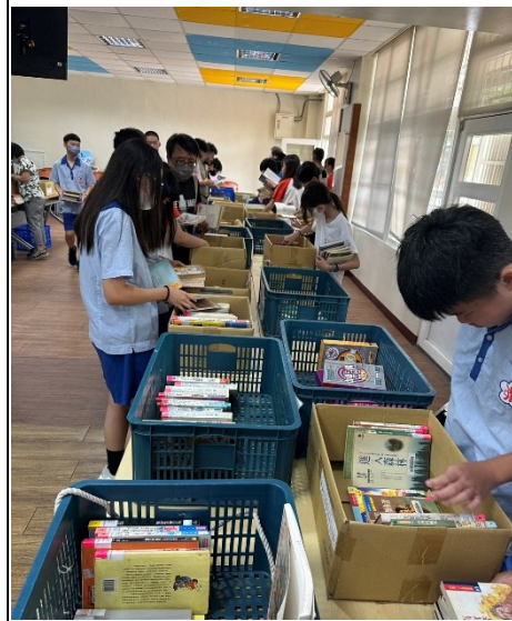
說明：學生與老師參與選書