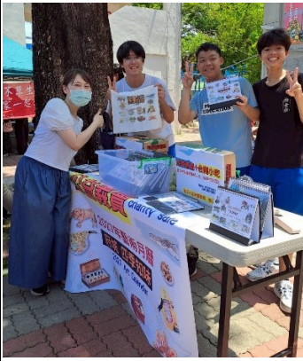
說明：美術班復原台南小吃