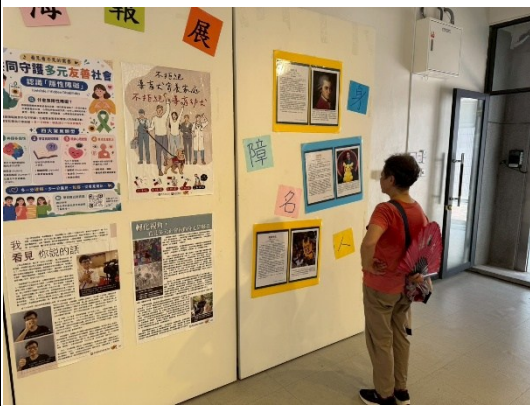
說明：社區民眾參觀靜態展覽