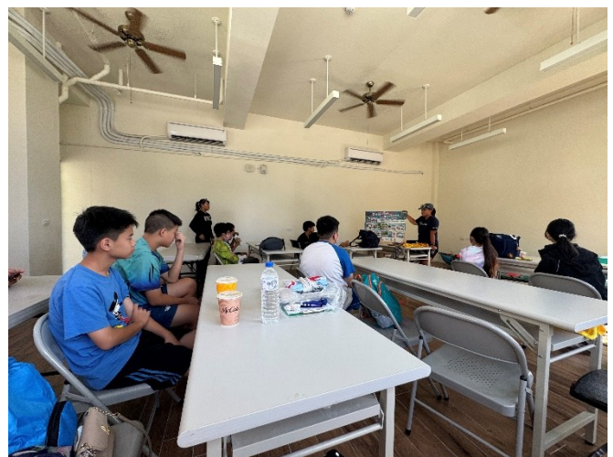
活動前水域安全教育與水中自救技能學習