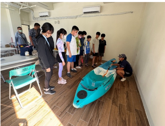
活動前水域安全教育與水中自救技能學習