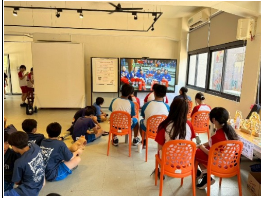
說明：食育影片播放