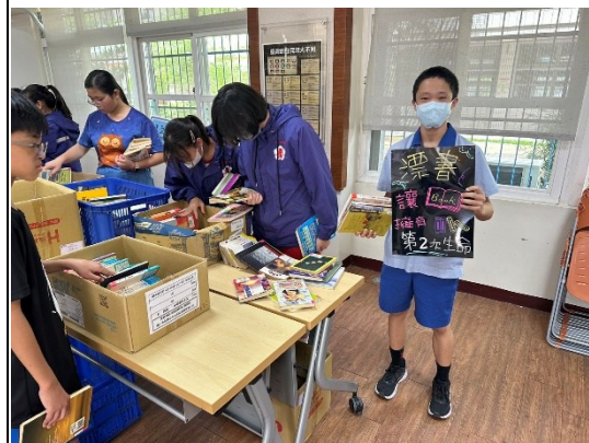
說明：學生參與選書