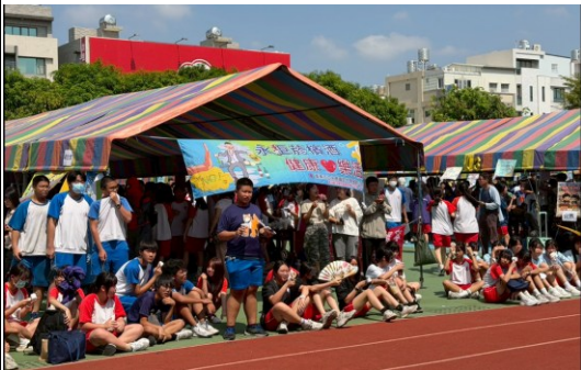
說明：園遊會倡議健康樂活