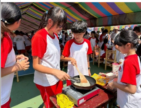
說明：學生學習製作食物販賣