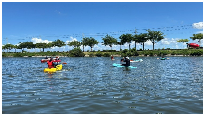
SUP、獨木舟操作與體驗