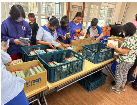
說明：學生與老師參與選書