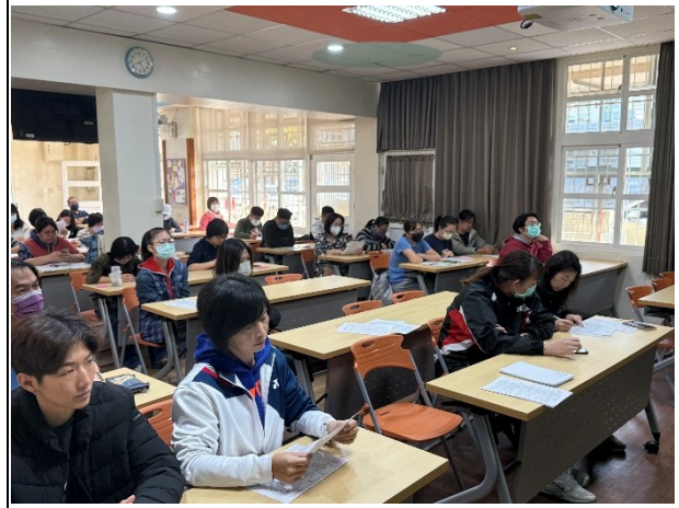
說明：體育組說明各組工作事項