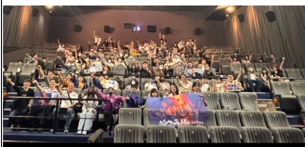
說明：參與師生合照