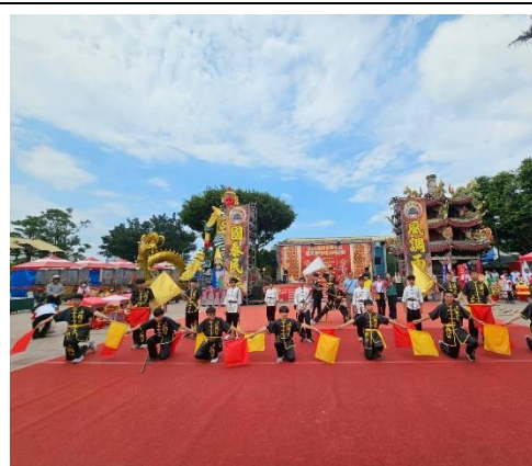
受邀到鹽水烽跑慶典暨進行表演