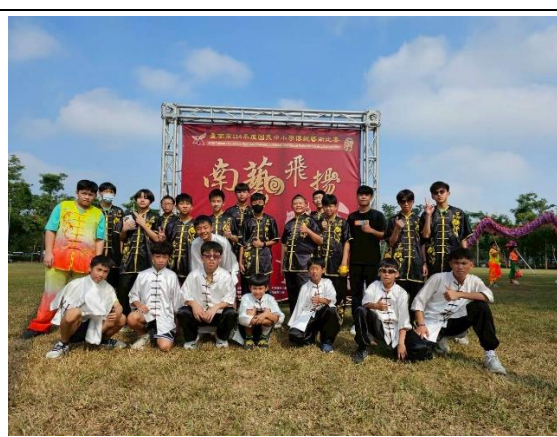
武術隊大合照，從學校到社區表演