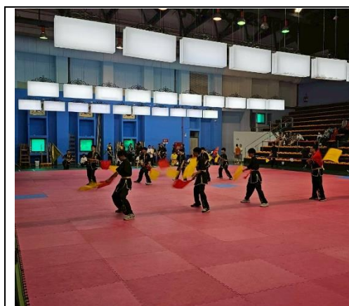
參加台南市傳藝武術比賽