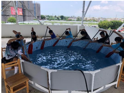
為國際龍舟錦標賽作準備