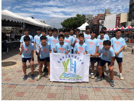
參加台南市國際龍舟錦標賽