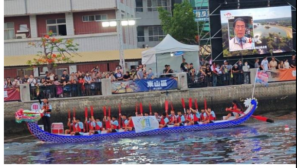
積極參與校外活動，多元展能