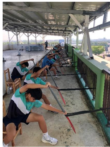
賽前龍舟划手訓練