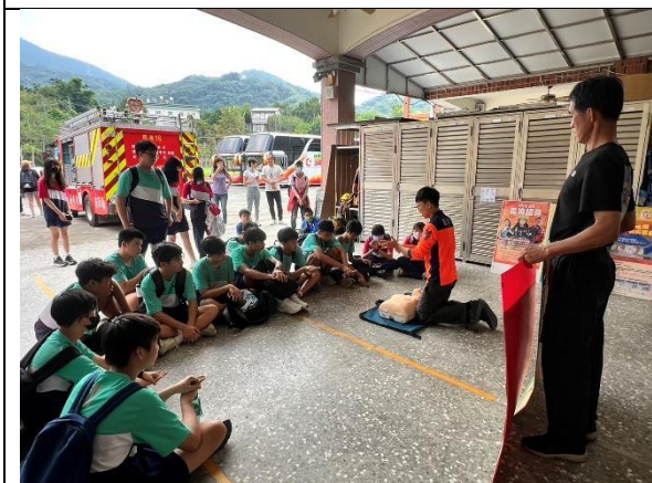
認識山裡面的消防知識