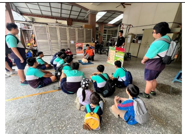
沒有人比我們更認真