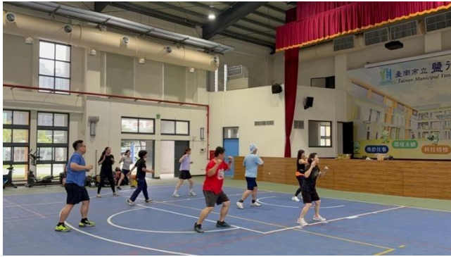
教職員暨家委會羽球聯誼賽：比賽獎品合影