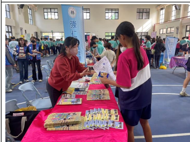
多元的技職教育博覽會