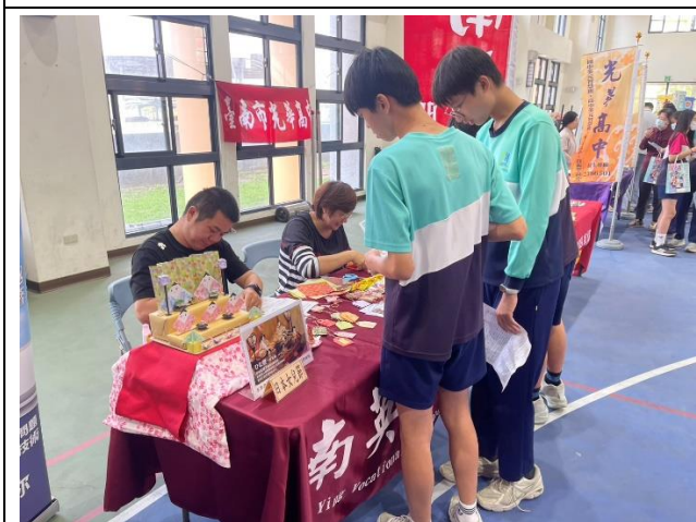
多元的技職教育博覽會