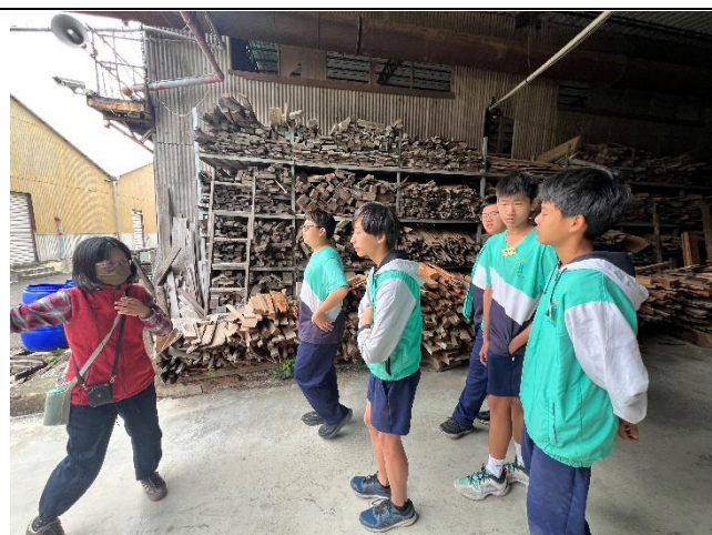
導覽員介紹家具製作流程