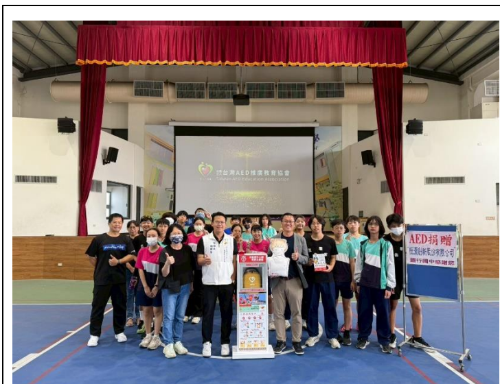
企業捐贈本校 AED 設備