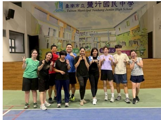
教職員暨家委會羽球聯誼賽：比賽照片