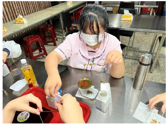
導師、主任、外師、學生與教練合影