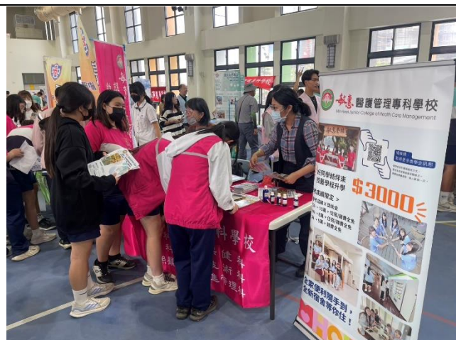
多元的技職教育博覽會