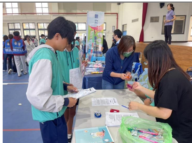
多元的技職教育博覽會