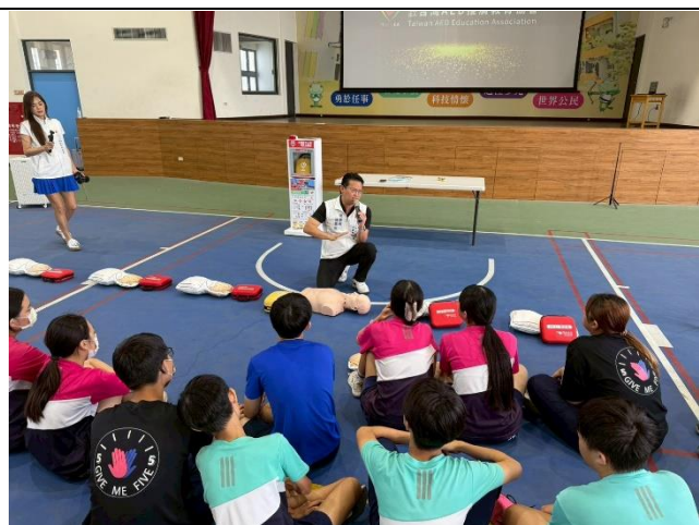
急救教育推廣協會理事長親自教學 CPR & AED