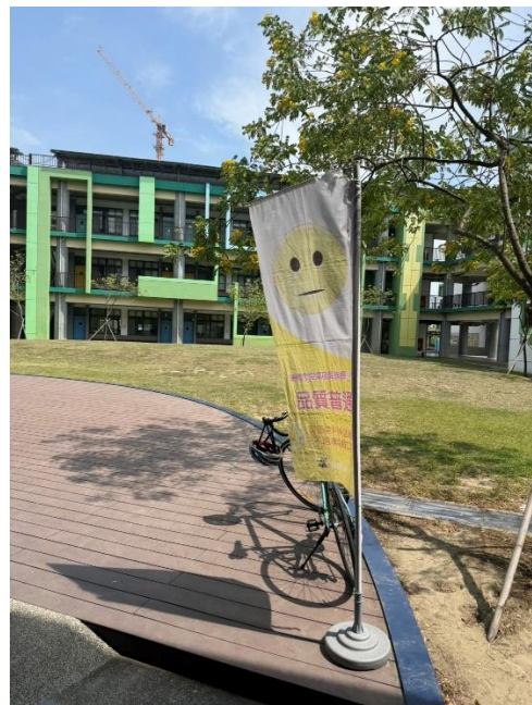
體衛組志工負責每日 AQI 旗幟掛放