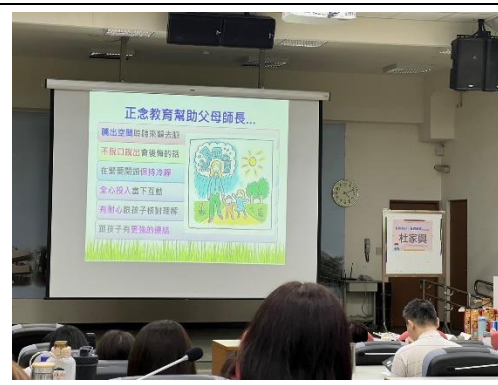
親職教育座談，邀請正念教育專長講師