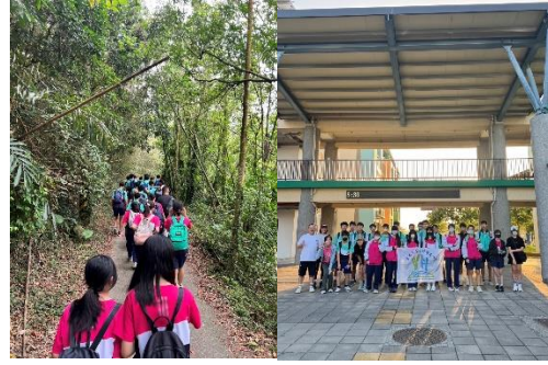
與家長一同登山，共同促進彼此身心健康