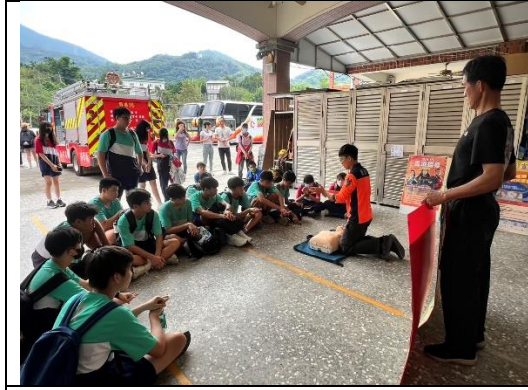
每年大凍山登山活動前的急救教育演練