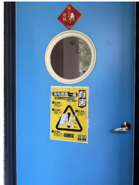
處室門口張貼菸害海報