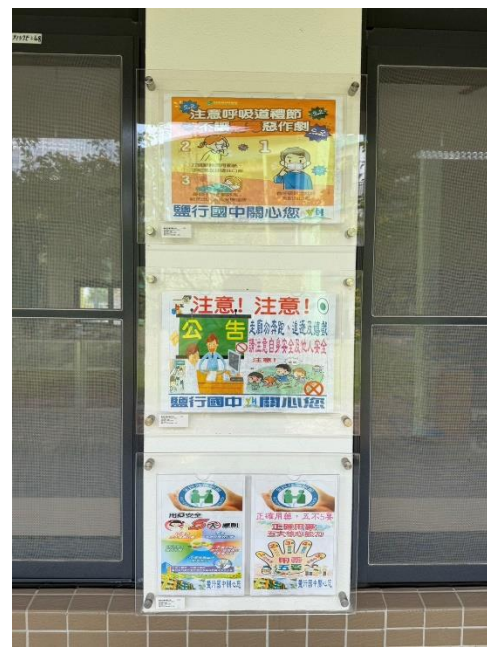
健康中心張貼衛教相關宣導