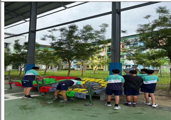
小志工協助清洗班際球賽球衣