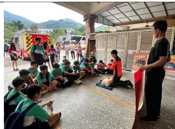
認識山裡面的消防知識