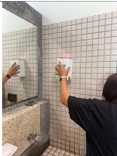
小志工於廁所設置衛生棉收納盒