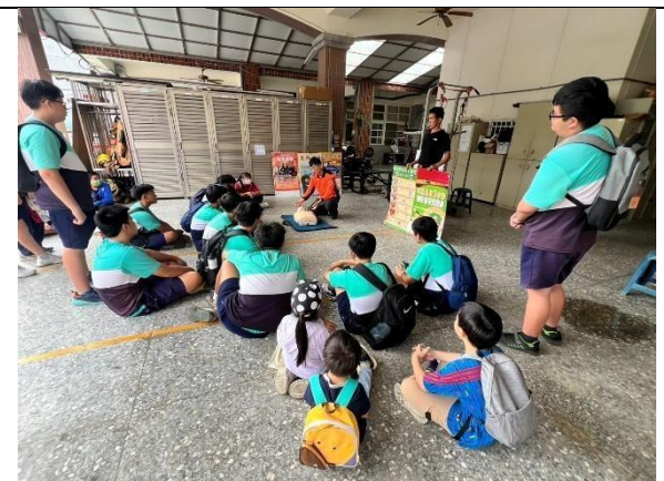
沒有人比我們更認真