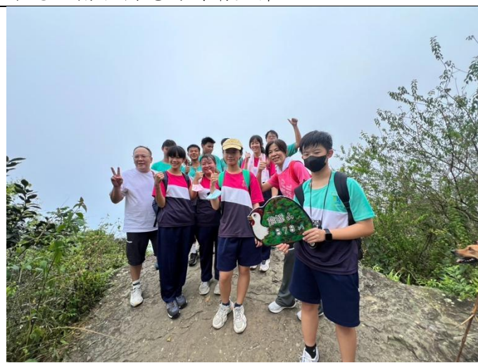
學生與家長一同登山倡導健康生活習慣