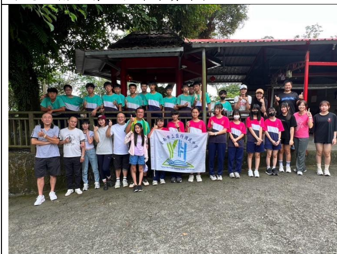
學生與家長一同登山倡導健康生活習慣