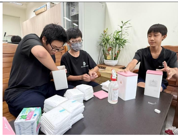
小志工協助補充女廁衛生棉