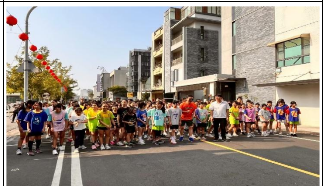
舉辦反菸拒檳-健康路跑活動