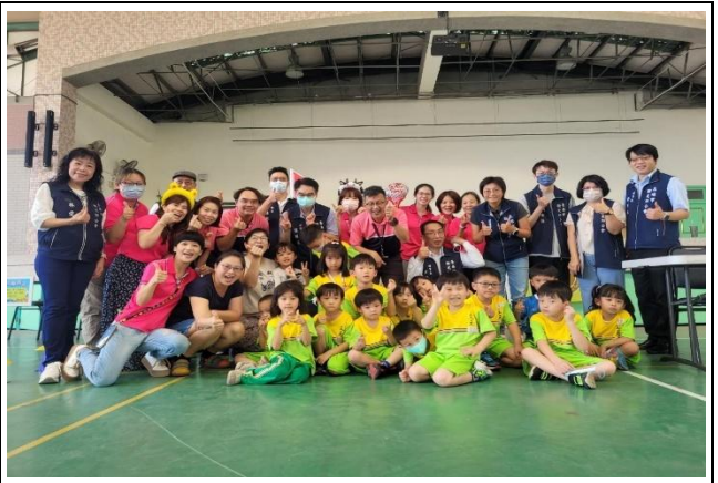
視力保健闖關活動大合照