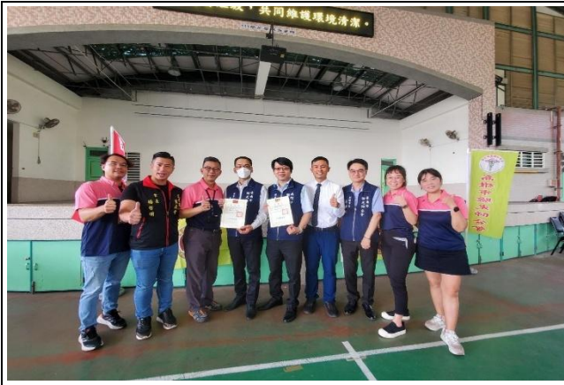
校長與四處主任致贈感謝狀予驗光師公會