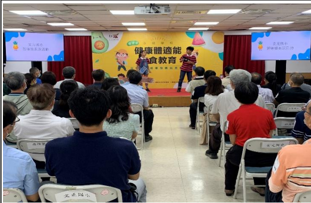
受邀參加市府舉辦健康體適能暨飲食教育之記者會開場演出