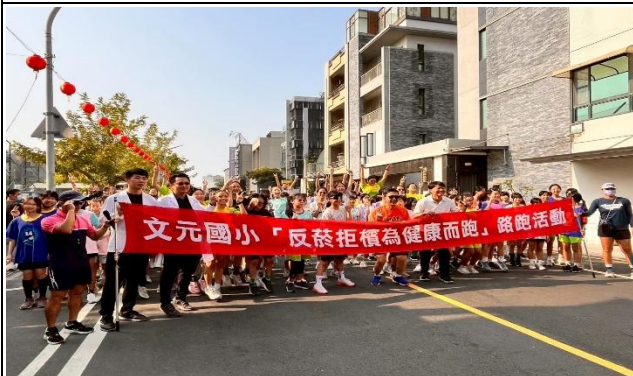
舉辦反菸拒檳-健康路跑活動