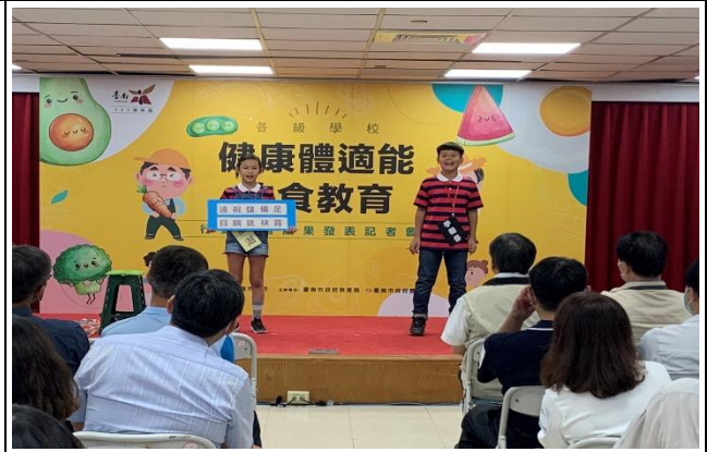
受邀參加市府舉辦健康體適能暨飲食教育之記者會開場演出