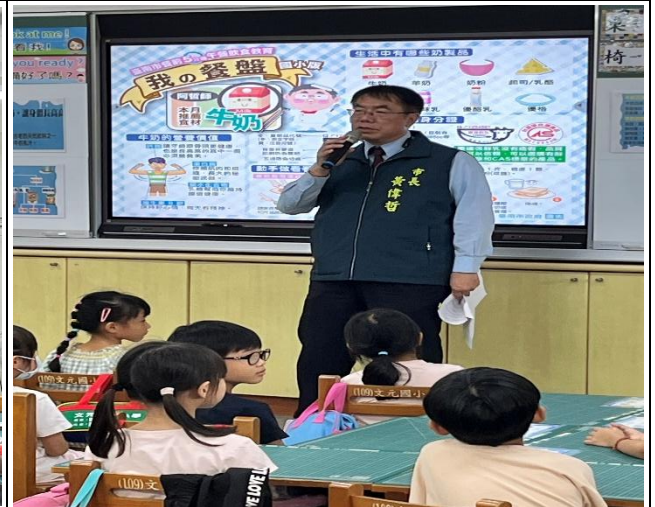
主辦市府國產乳品宣導記者會