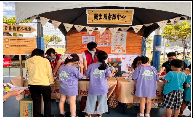
參加健康小學堂-健康我最行-闖關活動