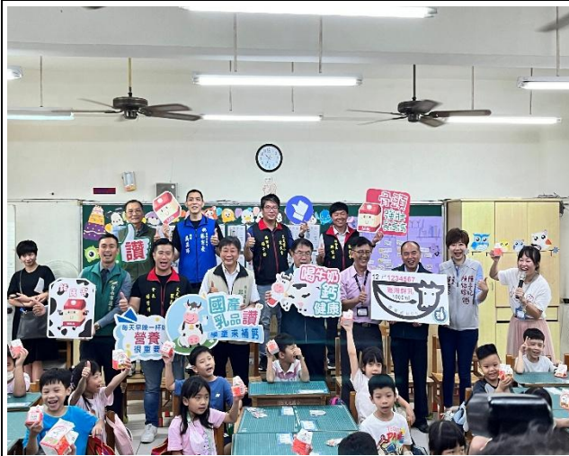
主辦市府國產乳品宣導記者會