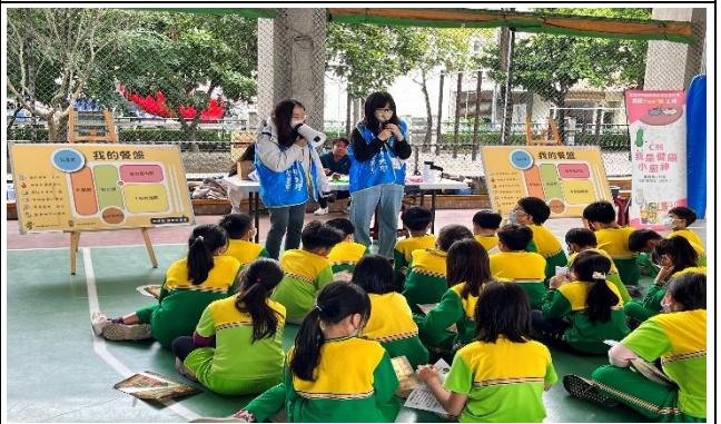
學生參與營養教育巡迴列車闖關活動