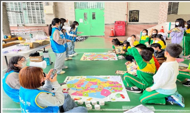
學生參與營養教育巡迴列車闖關活動