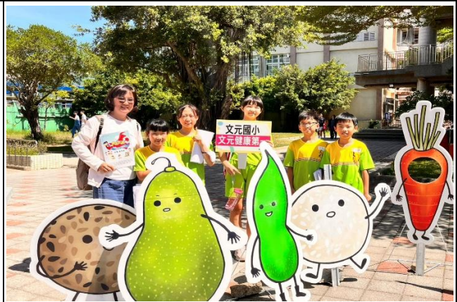
參加健康小學堂-健康知識大挑戰比賽