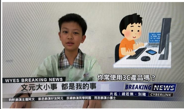
參加健康促進校園主播比賽