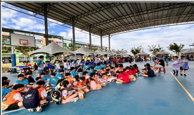
參加健康小學堂-健康我最行-闖關活動