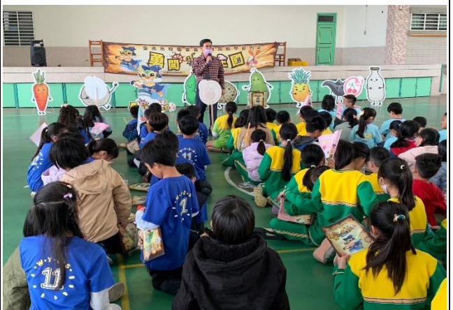
校園營養教育巡迴列車-嘉南藥理科大協辦