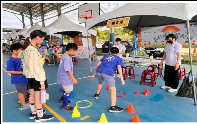
參加健康小學堂-健康我最行-闖關活動