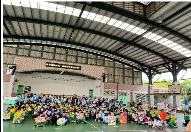
校園營養教育巡迴列車-嘉南藥理科大協辦