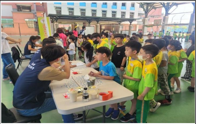
驗光師說明闖關活動