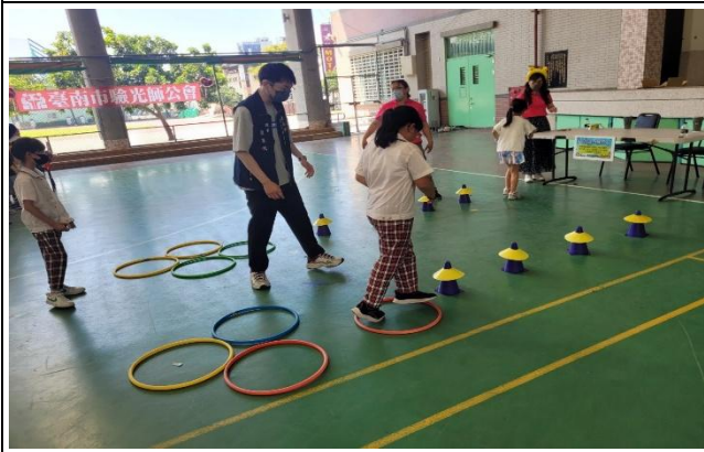
學生參與視力保健闖關活動