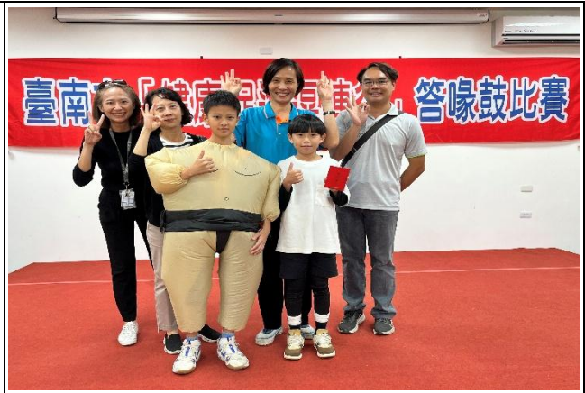
參加台南市健康門陣行-答喙鼓比賽