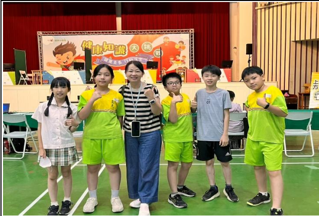
參加健康小學堂-健康知識大挑戰比賽