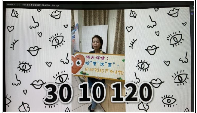
參加健康促進校園主播比賽