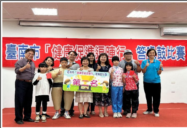
參加台南市健康門陣行-答喙鼓比賽