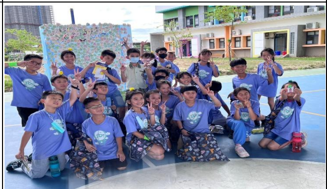
參加健康小學堂-健康我最行-闖關活動