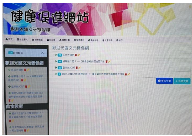
健康促進學校網站