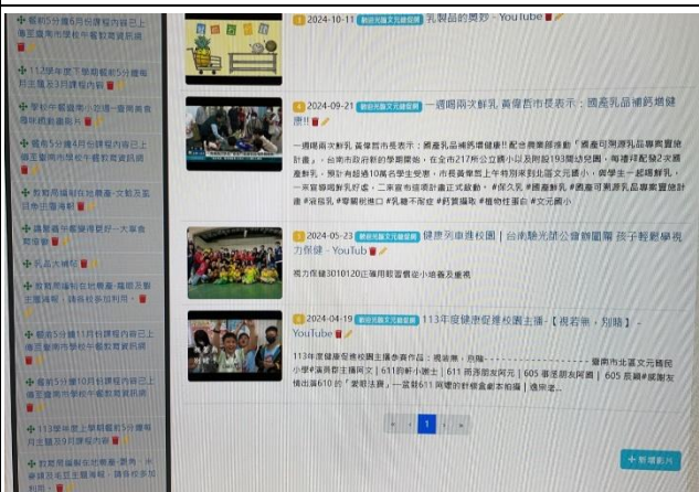
內容豐富程度涵蓋各健促議題