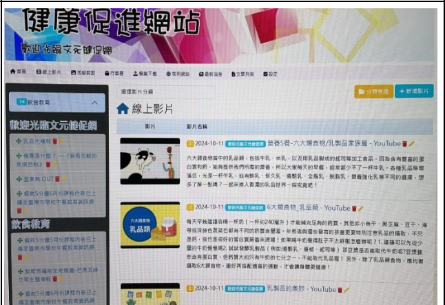
內容豐富程度優質