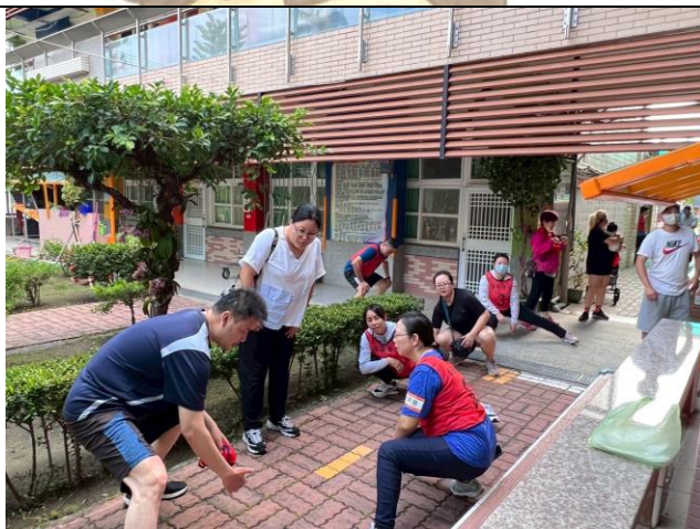
家長們迫不及待暖身