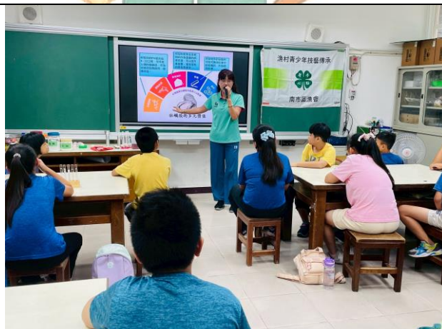
讓學生了解蚵殼的多元價值