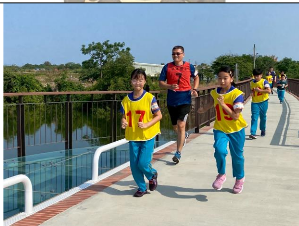
與孩子們共同健康路跑