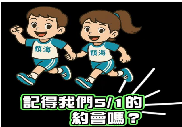
將路跑活動辦在 5/1 方便家長參與