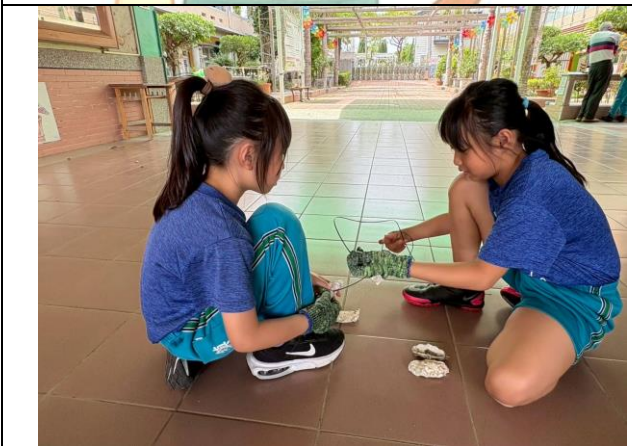
小朋友倆倆一組練習綁蚵殼串