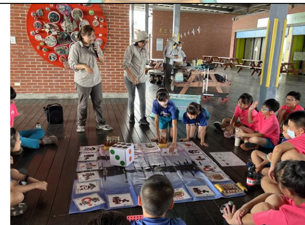
透過遊戲了解養蚵、環境與個人生活的關係。