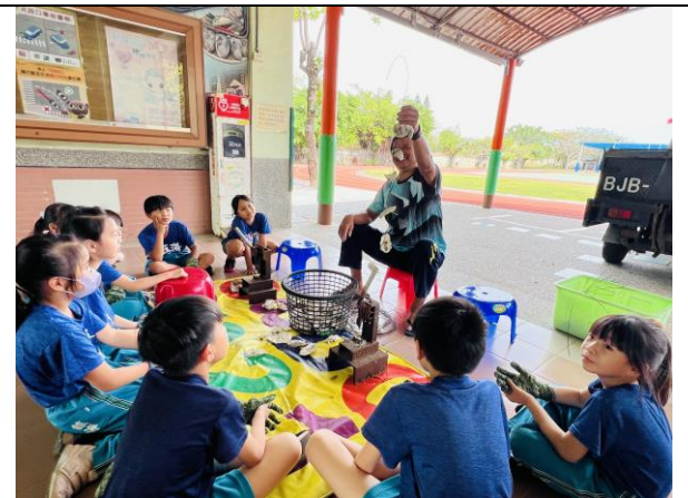
達人示範蚵殼串的綁法