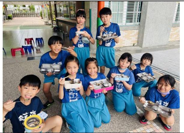
大家一起品嚐好吃的蚵仔湯