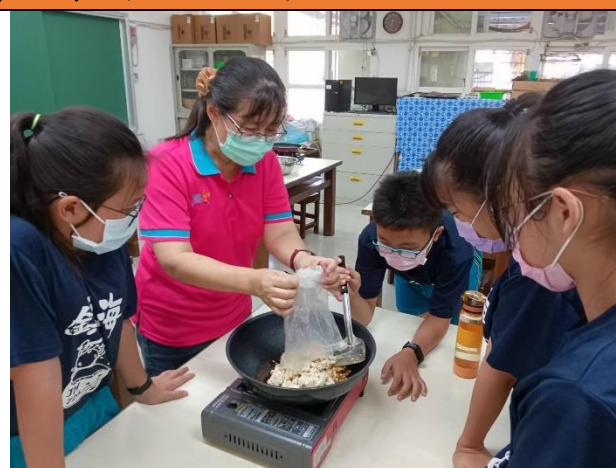
利用蒸熟的虱目魚柳製作魚鬆