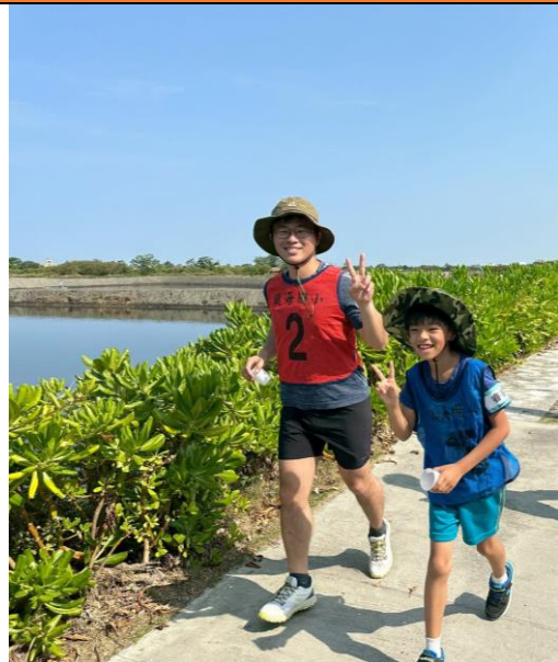
有空的家人們都到場陪跑