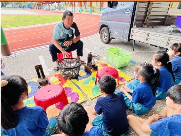
養蚵及鋟蚵工具介紹