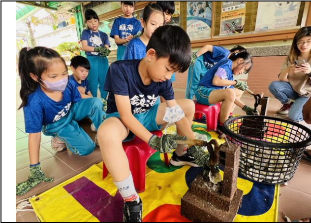
小朋友進行鑽孔練習