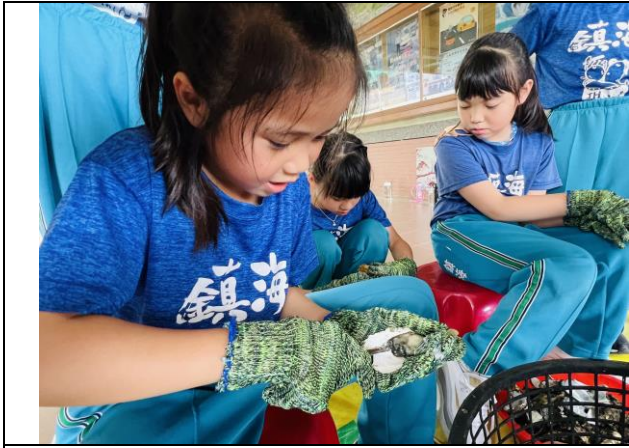
小朋友努力的把大胖蚵挖出來