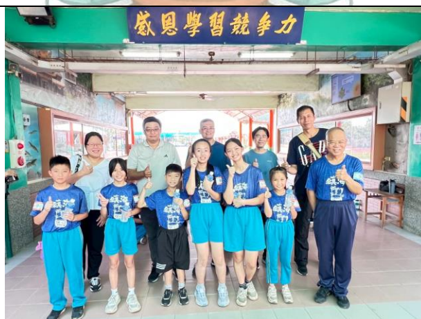
邀請家長擔任頒獎嘉賓