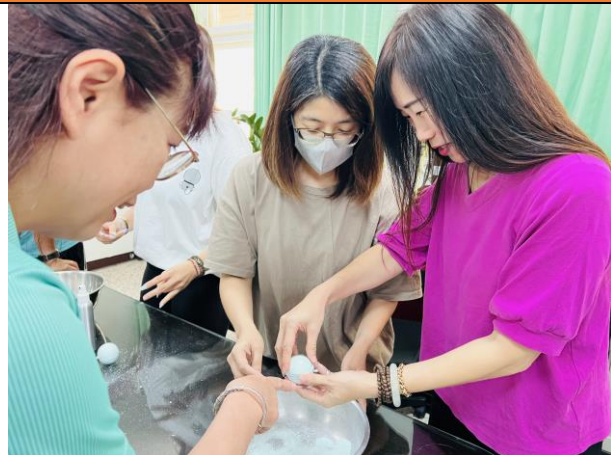
將材料混合均勻製作蚵殼粉泡澡球