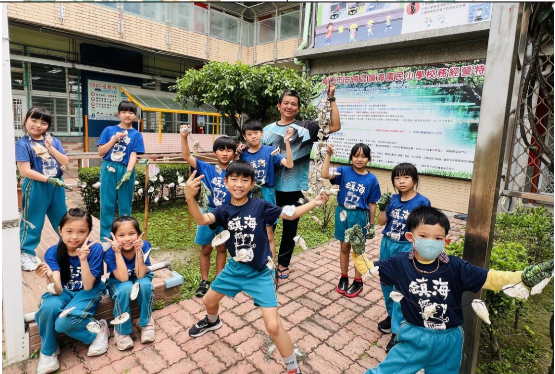
達人 是鎮海的大學長喔！感謝他回校來指導學弟妹們