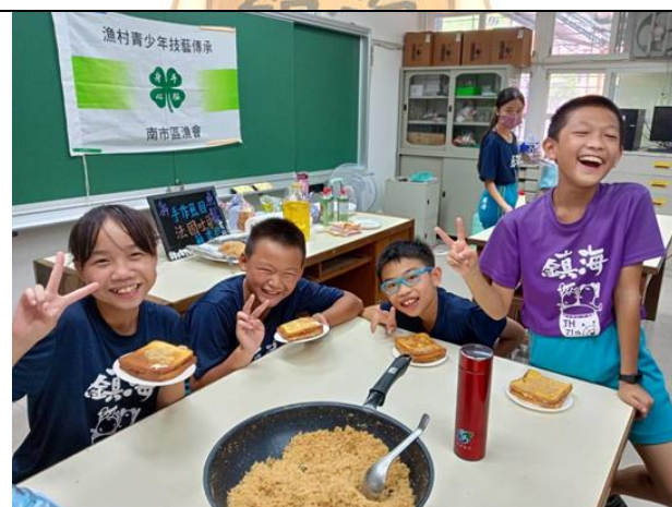
中西合併料理-黃金虱目魚鬆土司