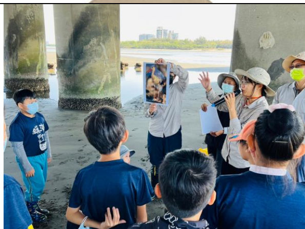
了解海洋廢棄物對海洋生物的危害