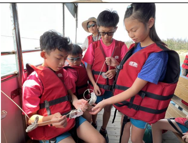
搭船前往汐湖期間練習綁蚵串