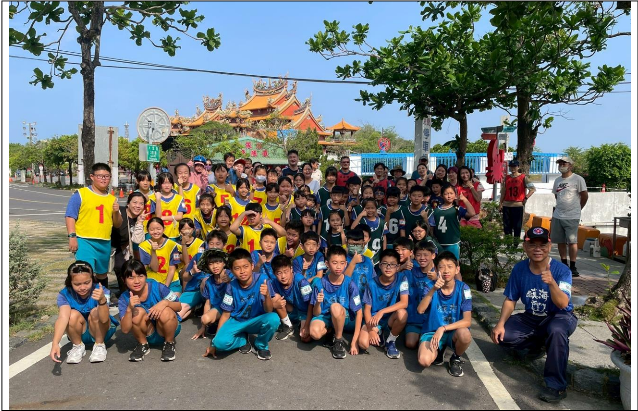
出發前集體大合照