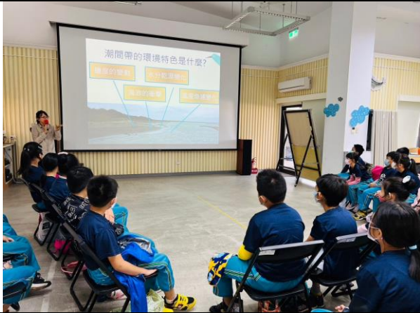
中年級台江好潮課程