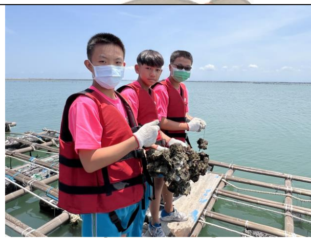
感受蚵串的重量，體會蚵農工作辛苦。