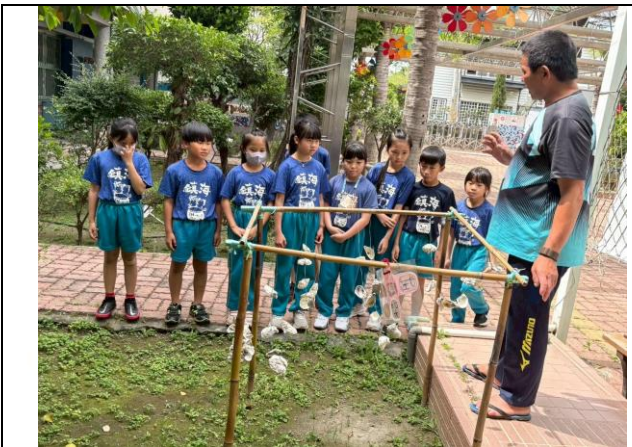
利用校園內的蚵棚介紹浮棚(適用於大海)及倒棚(瀉湖)養殖的差別