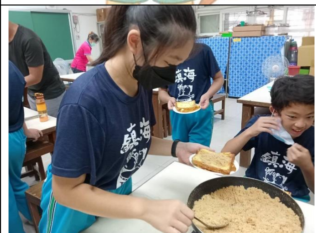
搭配新鮮出爐的虱目魚鬆