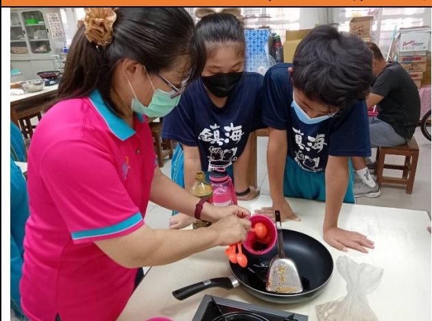
搭配四年級校訂課程-虱慕台江