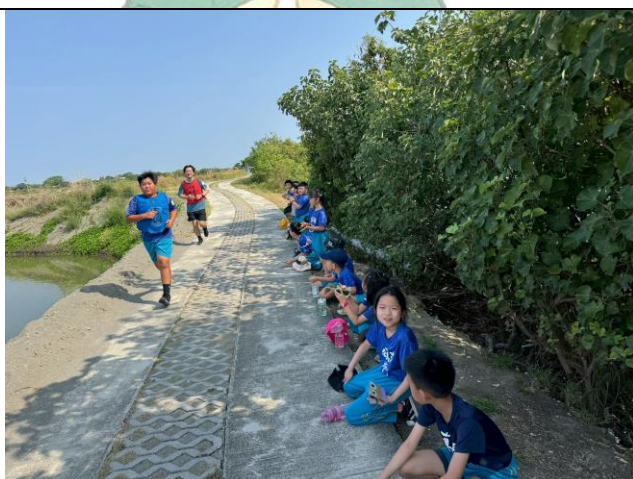
低年級也健走到中途點當啦啦隊