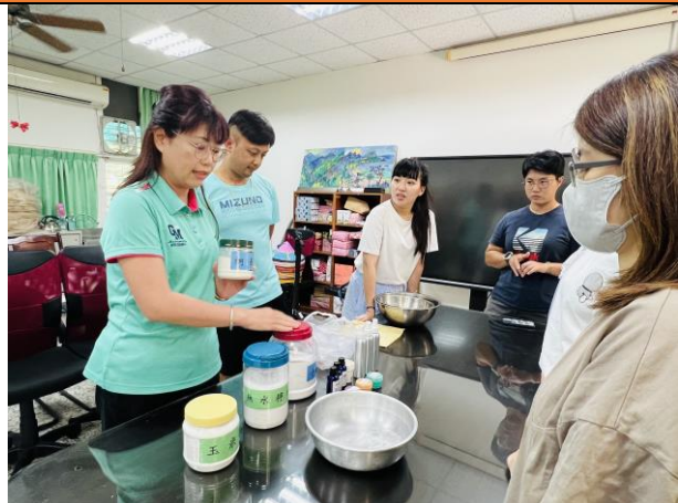
四健會指導員擔任教師研習講師