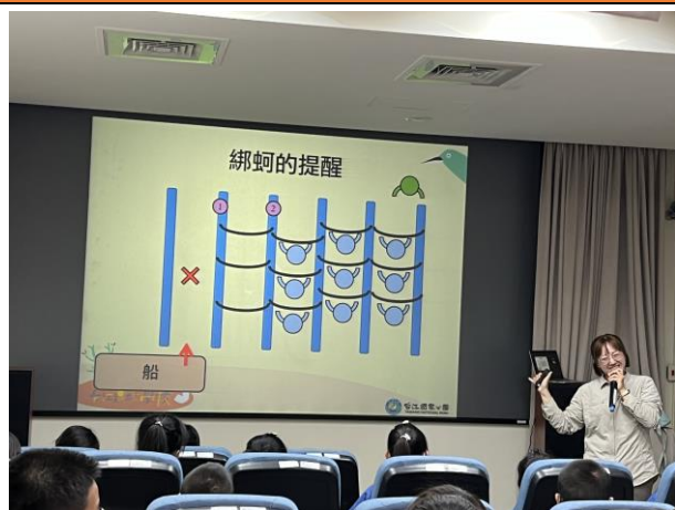
中年級「我是蚵學家」課程延伸