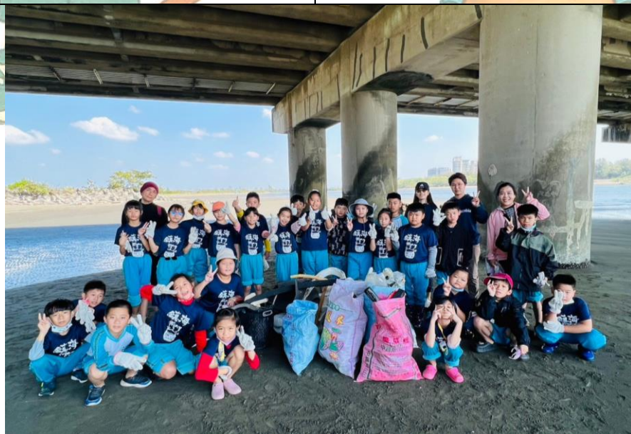
短短半小時的成果，為海洋盡一份心力。