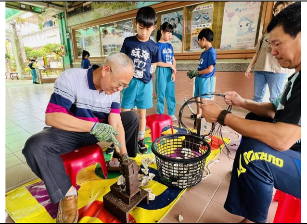
校長也前來回味兒少時光