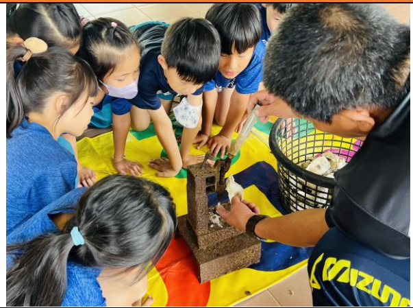
養蚵達人示範如何在蚵殼上鑽孔