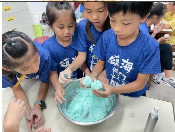
學生練習製作蚵殼粉泡澡球