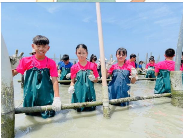
下到潟湖中練習綁蚵串