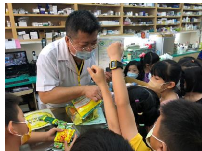
參訪社區藥局，了解學校周邊鄰居