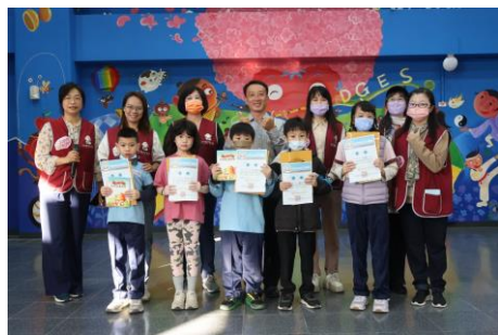
社區志工媽媽蒞校協助