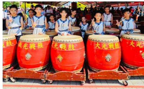
學生團隊參加社區宮廟表演