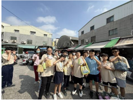
參訪延平市場，了解學校周邊鄰居，適時發揮健促影響力