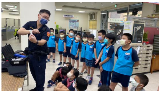
參訪警察局，了解學校周邊鄰居，適時發揮健促影響力