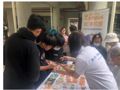
淨零志工團體到校宣導結合社區共同營造「永續淨零共生圈」願景