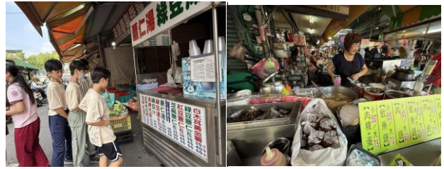
參訪延平市場，融入學校本土課程