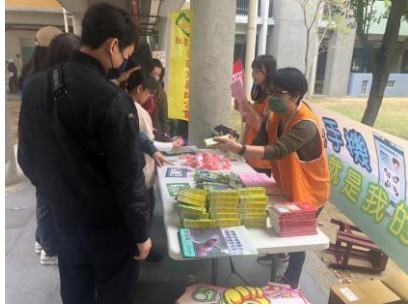
健保局南區業務組在本校運動會對家長與學生進行健保新知宣導