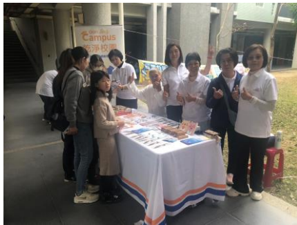
邀請社區乾淨校園淨零志工團體到校宣導健康環保的優點