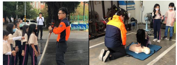
參訪社區消防隊，了解學校周邊鄰居，適時發揮健促影響力