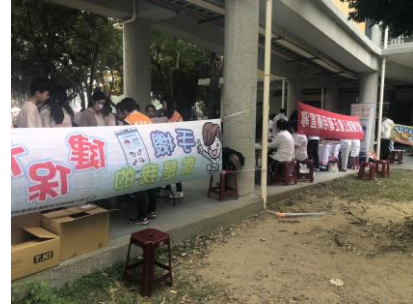
健保局南區業務組在運動會對家長與學生推廣健保手機 APP