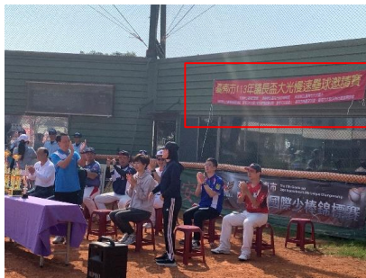
參與社區大光壘球隊比賽