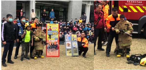
消防隊蒞校宣導居家安全