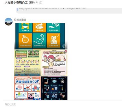
網路群組轉發健康中心訊息並提供健康諮詢服務