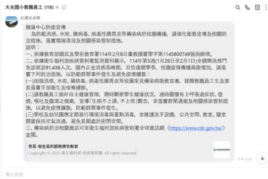
利用網路社群轉發宣導健康資訊 做好自主健康管理