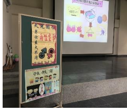
進行各類宣導諮詢與服務