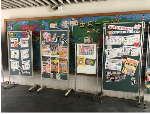
川堂設置大型看板宣導各類健促相關事宜 讓全校親師生每日必見潛移默化