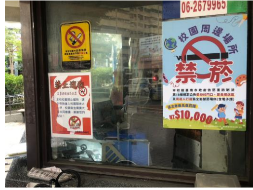
校園內外張貼反菸標語，提醒家長校園禁止抽菸，健康中心亦提供戒菸訊息