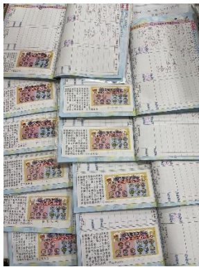
聯絡簿轉貼班級流感注意事項 提醒學生務必多留意