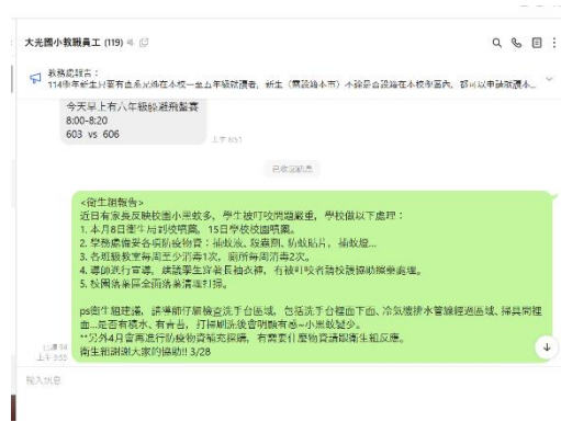
衛生組轉發登革熱注意事項 提醒全校師生共同防疫