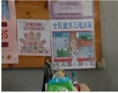
張貼相關健康資訊於學校公佈欄