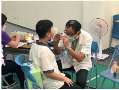
杏林診所到校進行四年級健康檢查