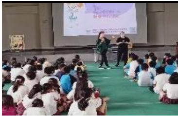
針對高年級-市立醫院性教育及愛滋宣導