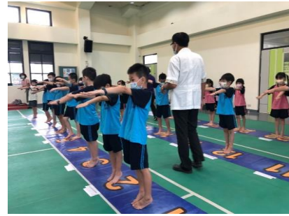
杏林診所到校進行一年級健康檢查