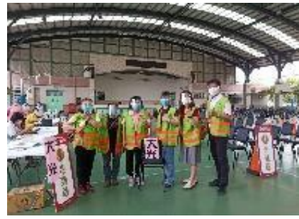
台南醫院營養師蒞校做營養教育宣導與闖關 遊戲