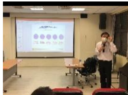
週三研習 奇美醫院藥劑師蒞校宣導提供藥劑方面解答