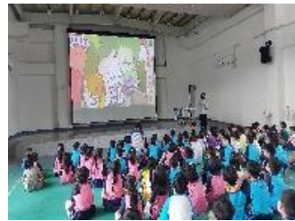
針對中年級學生做營養教育宣導