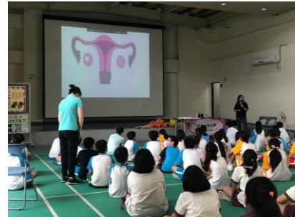
護理師進行兩性教育宣導