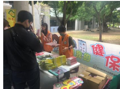
邀請「健保局南區辦公室」瑜運動會對家 長與學生進行健保業務宣導