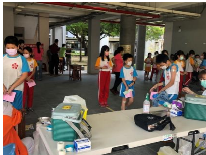
醫療團隊到校施打學生疫苗