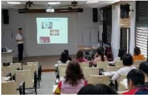
牙醫師 蒞校對親師做牙齒保健宣導與醫療服務