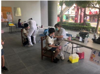
醫療院所到校施打流感疫苗