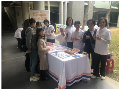
邀請環境淨0團隊於運動會對家長與學生 進行環保宣導