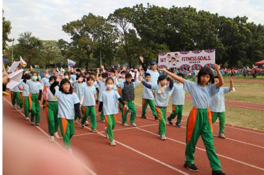
【健促小奧運】班級製作健康運動雙語標語進場宣導