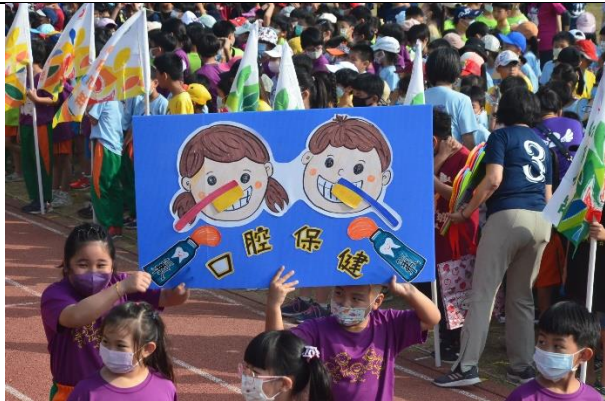
【健促小奧運】班級製作口腔保健看板進場宣導