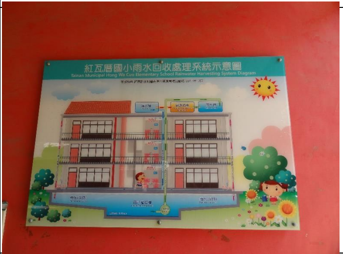
雨水回收再利用系統配置圖