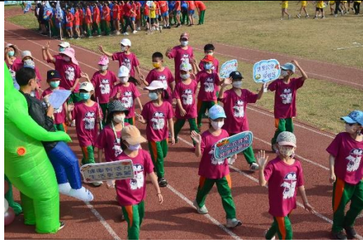
【健促小奧運】班級製作健康標語手板進場宣導