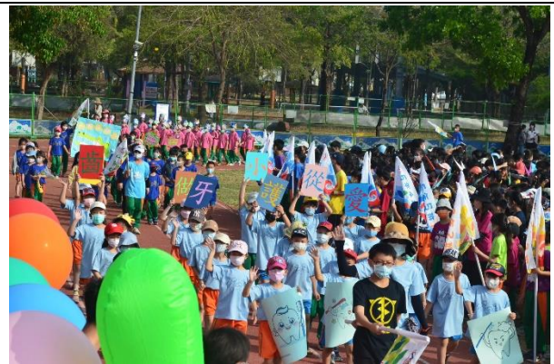
【健促小奧運】班級製作口腔保健海報進場宣導