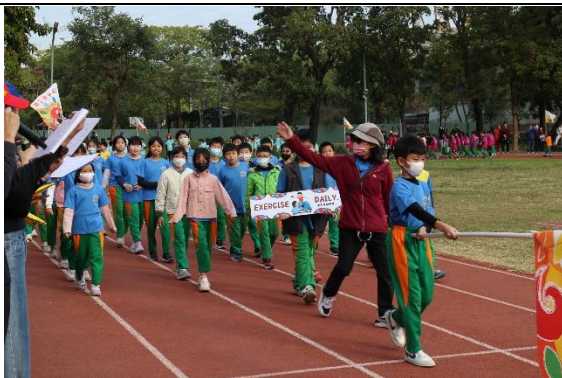
【健促小奧運】班級製作每天運動雙語標語進場宣導