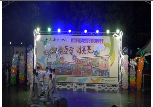
本校自 109 學年起年年舉辦社團成果發表會