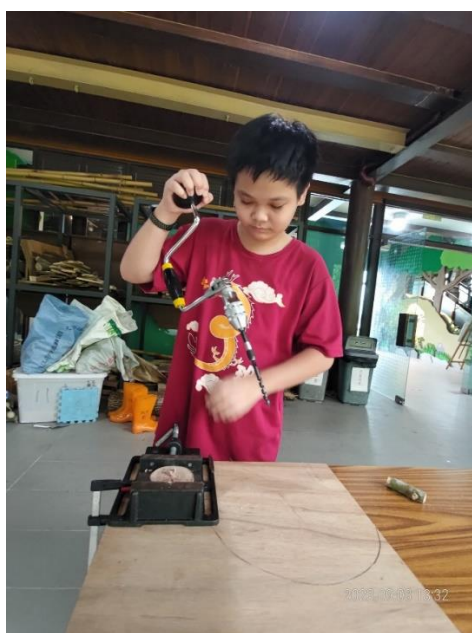
創意回收作品—利用廢棄枯枝條製作海馬