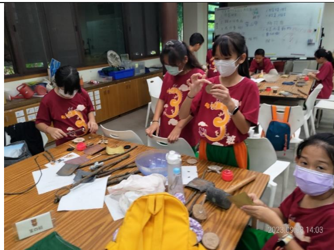
利用廢棄枯枝條製作動作模型