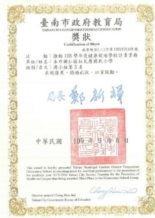
108 學年度健促績優學校評選第 3 名