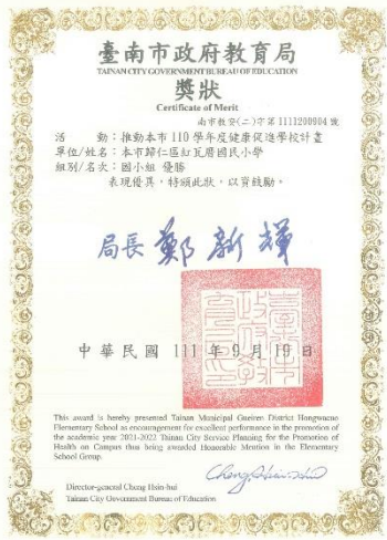
110 學年度健促績優學校評選國小組優勝