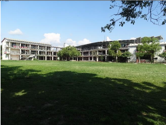
綠意盎然大草原，可舒緩疲勞眼睛