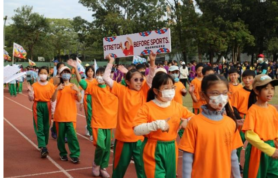
【健促小奧運】班級製作健康運動雙語標語進場宣導