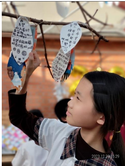
學生利用廢棄紙容器寫下願望掛於許願樹祈福