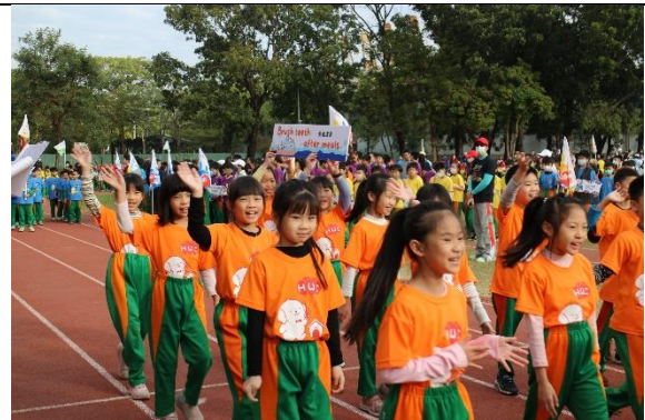
【健促小奧運】班級製作餐後潔牙雙語標語進場宣導