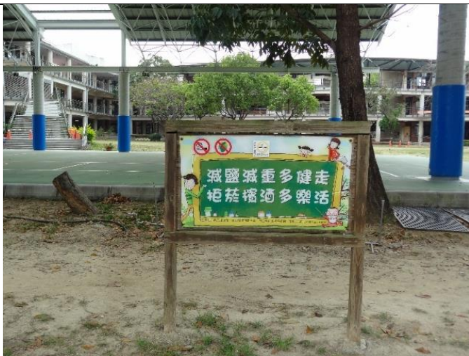
步道周邊設立健康促進宣導立牌