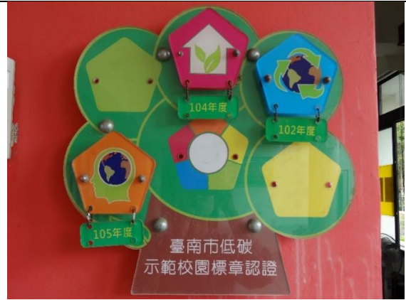
低碳示範校園標章-資源循環