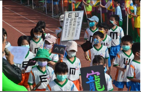
【健促小奧運】班級製作視力保健看板進場宣導