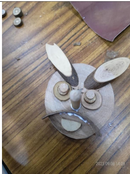
創意回收作品—利用廢棄枯枝條製作熊貓臉