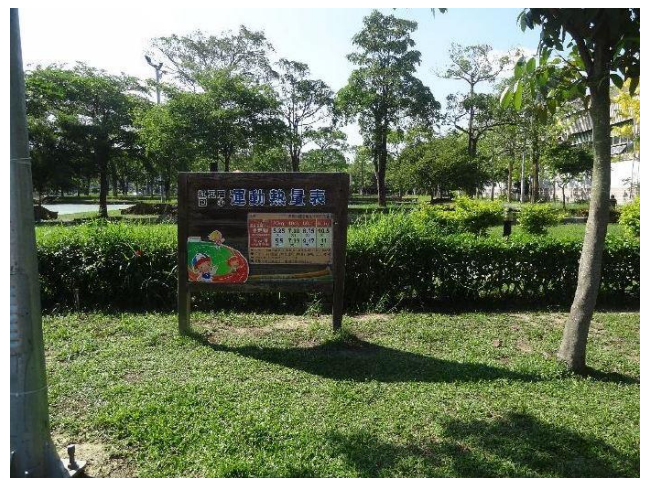
操場跑道周邊設立運動熱量立牌