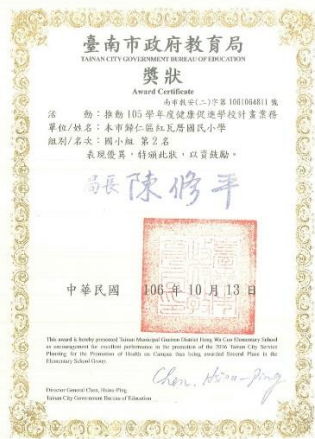
105 學年度健促績優學校評選第 2 名