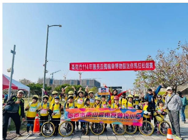
本校熱烈參與114年議長盃獨輪車博物館迷你馬拉松競賽。