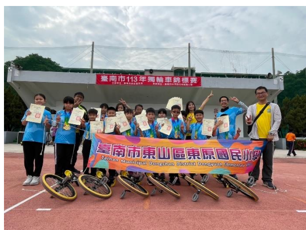
本校熱烈參與113年獨輪車錦標賽。 (113. 11. 23)