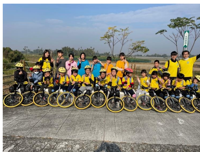
寒假嘉南大圳自行車道集訓。(114. 01. 22)