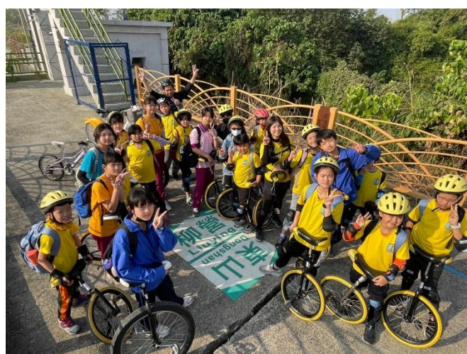
寒假嘉南大圳自行車道集訓。(114. 01. 22)