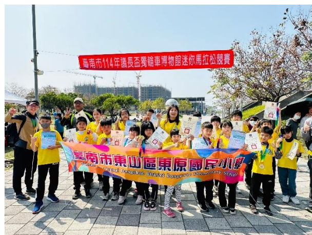
本校熱烈參與114年議長盃獨輪車博物館迷你馬拉松競賽。