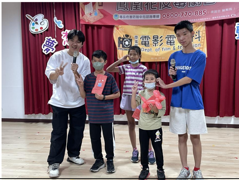
說明：鳳凰花反毒劇團成員用心引導學生反毒觀念。