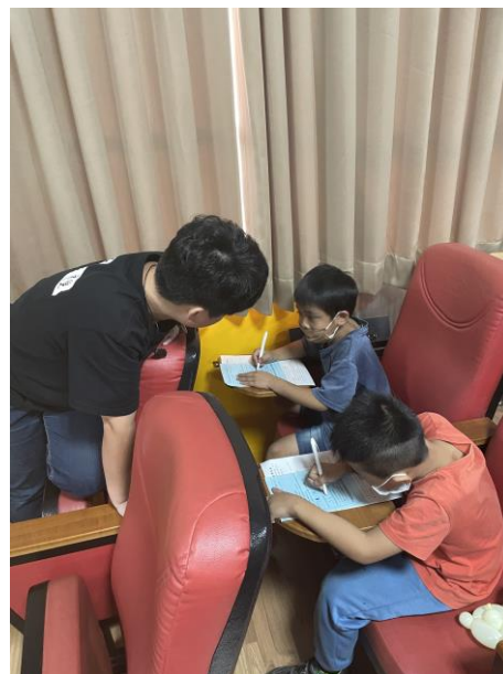
說明：鳳凰花反毒劇團成員用心引導學生書寫反毒學習單。