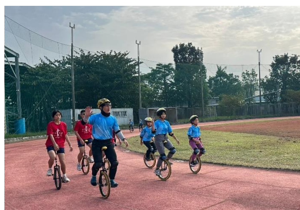
本校熱烈參與113年獨輪車錦標賽。 (113. 11. 23)