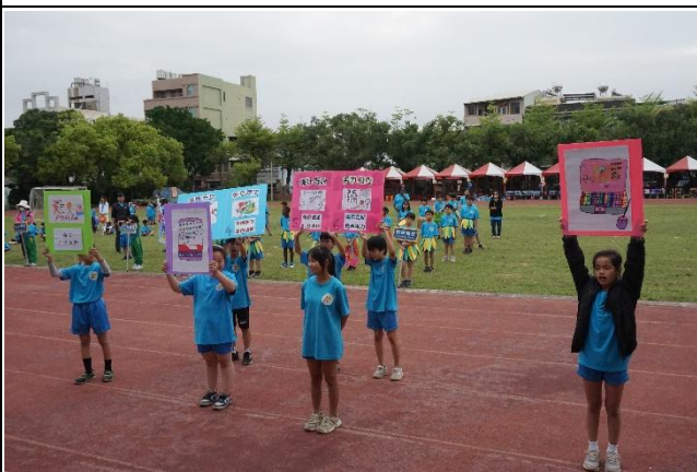
說明：運動會向家長進行視力保健宣導