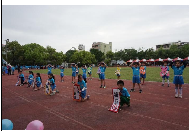
說明：運動會向家長進行菸害防制宣導