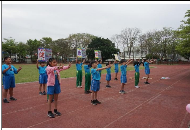
說明：運動會提醒家長關心學童健康體位