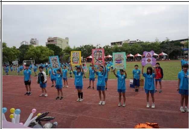
說明：運動會向家長進行安全教育宣導