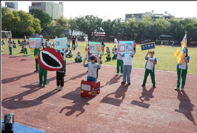
說明：運動會提醒家長口腔保健的重要