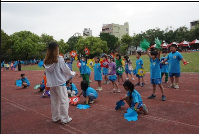
說明：運動會向家長說明均衡飲食的重要