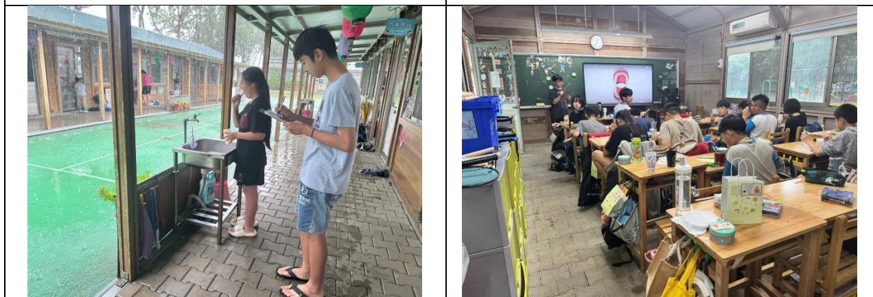
說明：潔牙小天使協助登記是否潔牙