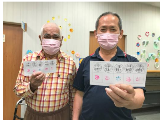
恭喜長者們完成任務嘍