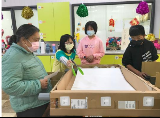
肌耐力組—學生向長者說明遊戲玩法