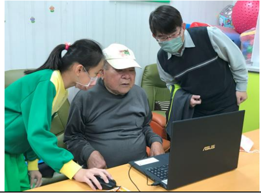
咀嚼力組—學生請長者跟著電腦畫面張開嘴巴