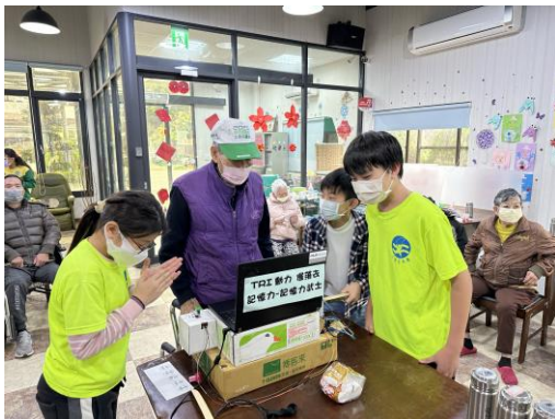
記憶力組—學生請長者記住螢幕上出現的水果