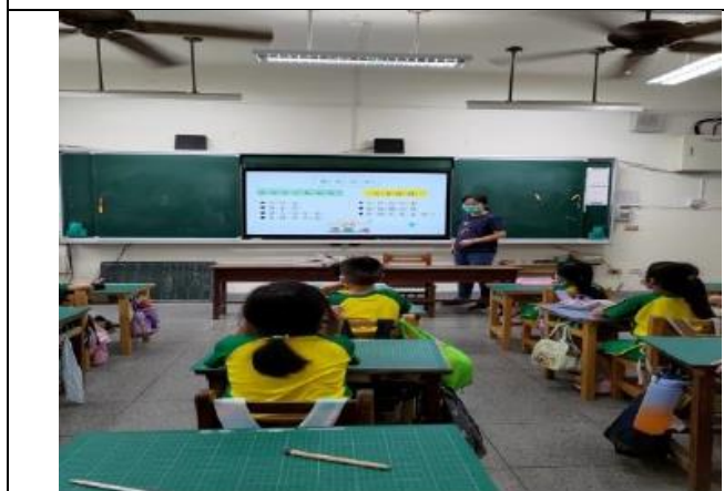
(導師班級宣導性別刻板印象)