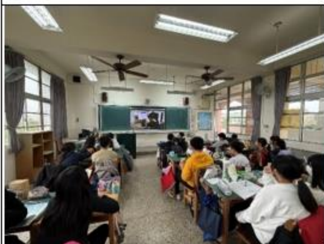
導師以媒體影片宣導性別平等概念