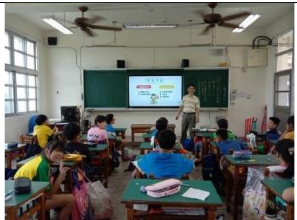
(性平宣導-性侵害防治)