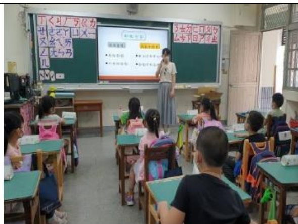
(導師以身體界線宣導-身體自主權)