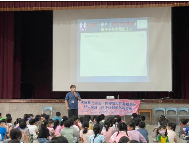
(專家入校-兒少保護及性騷擾防治宣導)