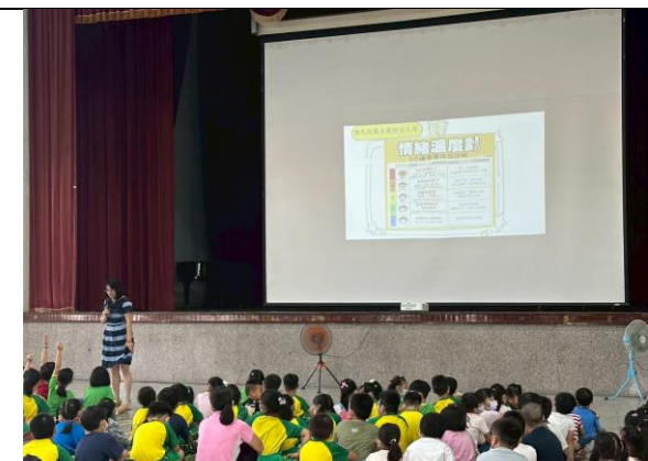
(人際關係宣導-情緒溫度計)