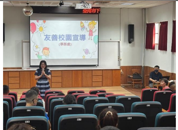
(友善校園宣導-親職講座)