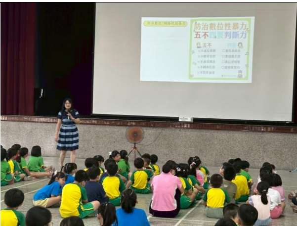
(始業式宣導-防治數位/網路性別暴力)