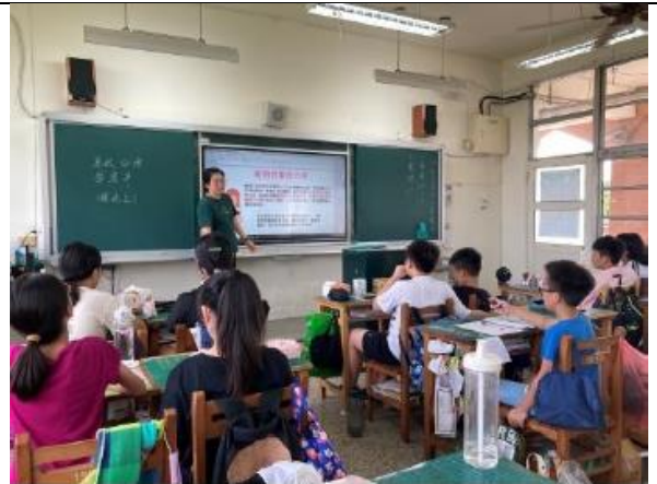
(兩性關係宣導-過度追求)