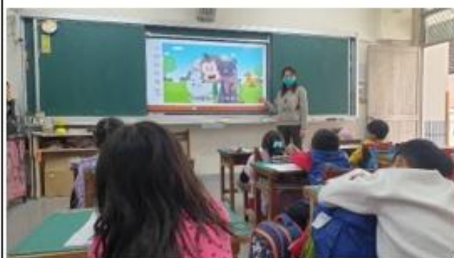
導師以媒體影片宣導性別平等概念