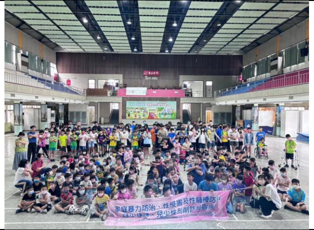
(專家入校全校宣導-兒少公約/性平宣導)