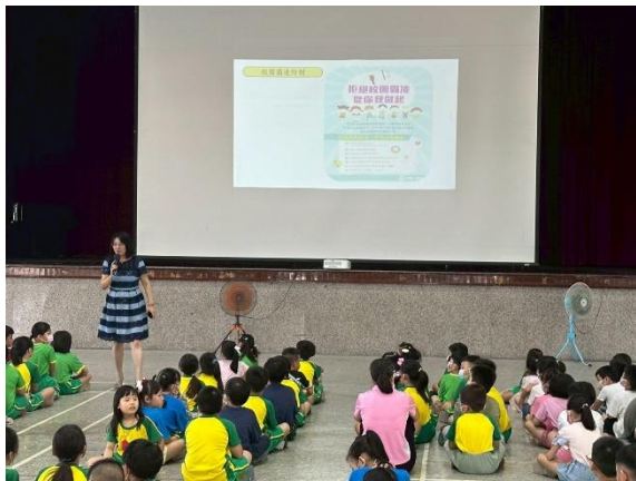
(反霸凌宣導-校園霸凌防治)