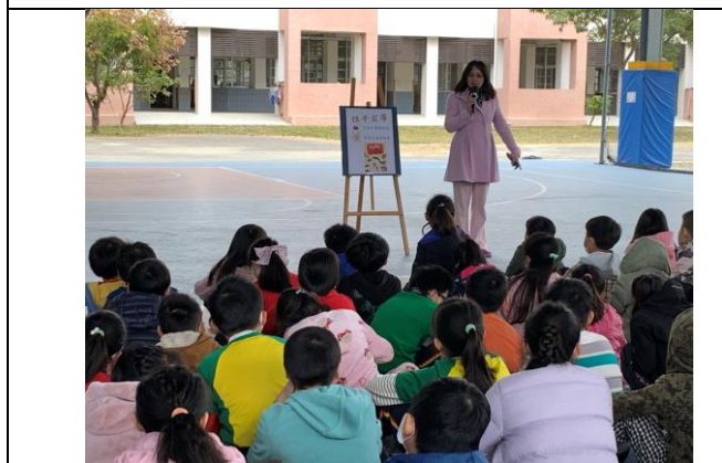
(兒童朝會主題宣導-性別平等)