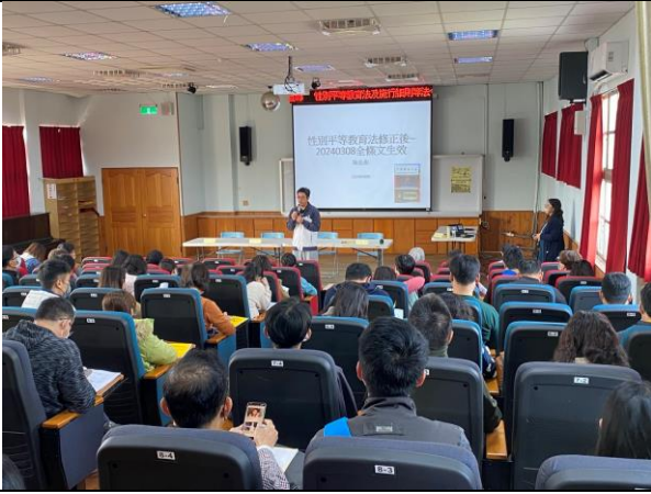
(性別平等教育法修正重點宣導)