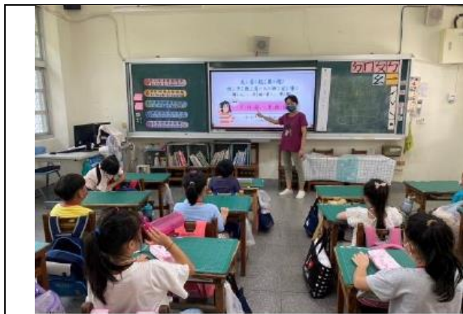
(導師班級宣導身體自主權)