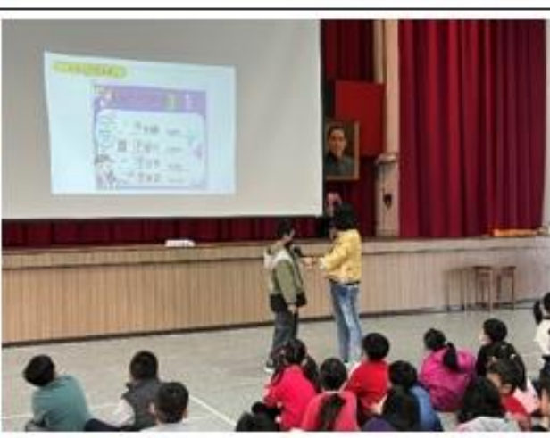
學生集會宣導拒絕兒少性剝削