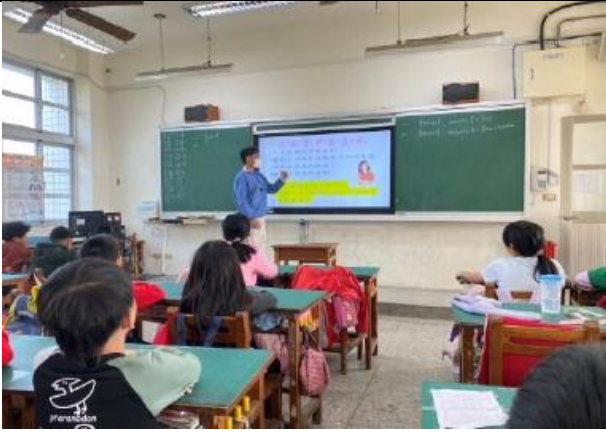
(性平宣導-預防性騷擾)