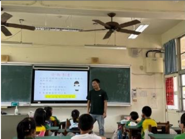
(性平宣導-性侵害防治宣導)