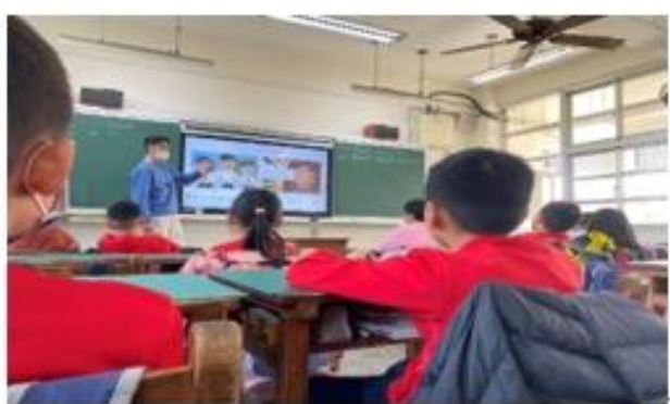
導師以媒體影片宣導性別平等概念