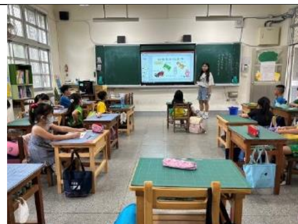
(性平宣導-性別刻板印象)