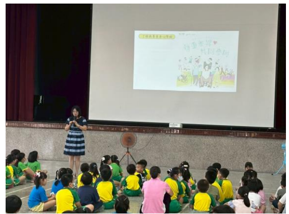
(友善校園宣導-了解與尊重身心障礙者)