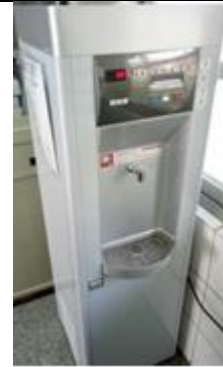
(檢查合格供水正常飲水機)