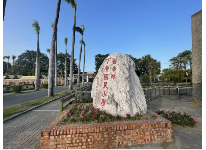
(校園綠美化-種植花卉)