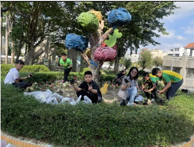
(校長帶領學生進行校園綠美化)