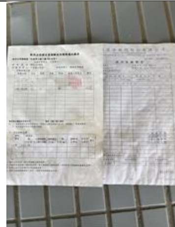
(每台飲水機每月定檢，定期更換濾心)