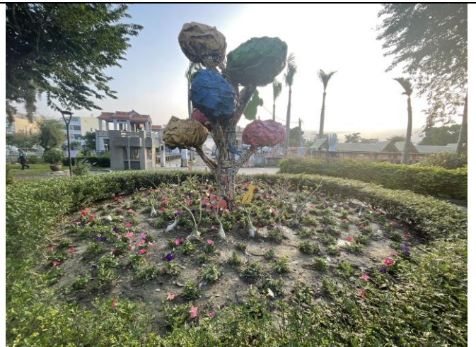
(綠色校園-種植綠色植物與花卉)