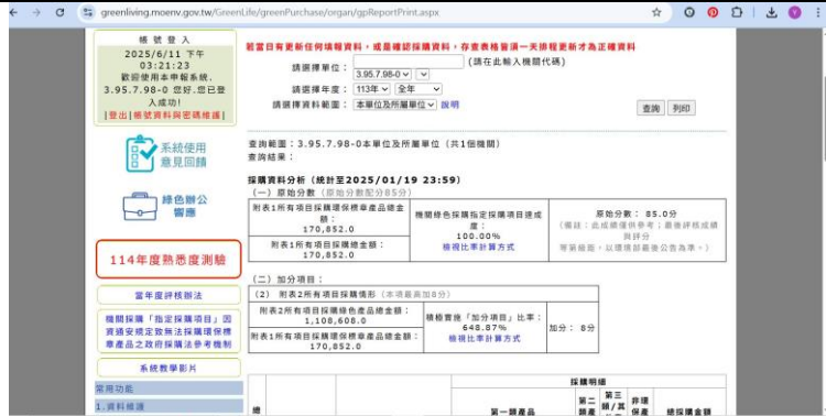
(綠色採購指定項目達程度100%)