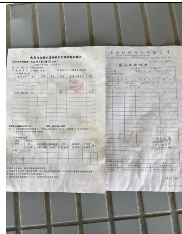
(飲水機每月保養維護)