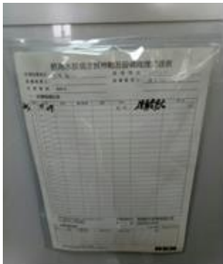
(每台飲水機每月定檢，定期更換濾心)