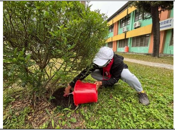
(運用落葉堆肥施肥-永續綠循環)