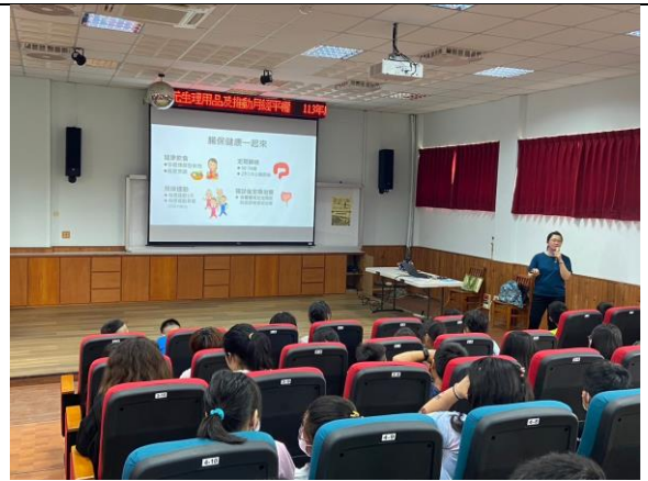
(衛生所人員宣導腸胃保健)