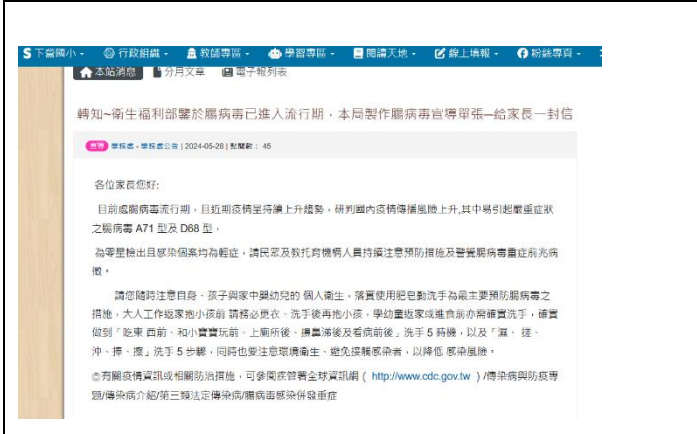
(學校網站- 校園傳染病-腸病毒、流感、新冠肺炎、水痘及腸胃炎防治宣導)