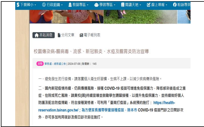
(學校網站- 校園傳染病-腸病毒、流感、新冠肺炎、水痘及腸胃炎防治宣導)