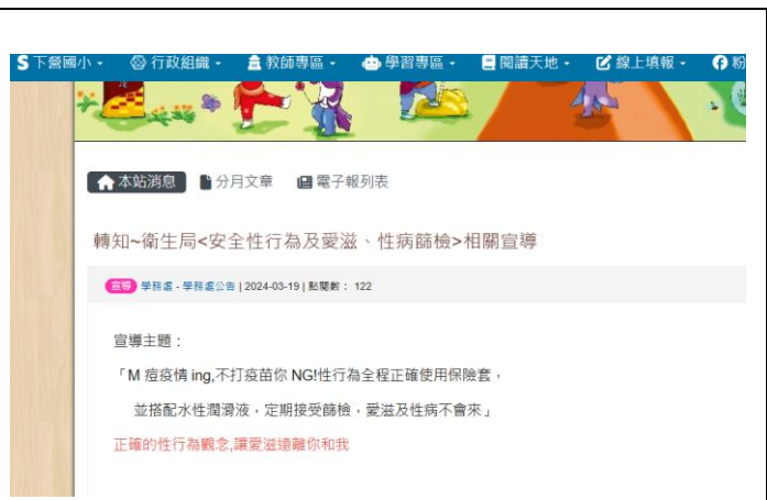
(學校網站-轉知~衛生局<安全性行為及愛滋、性病篩檢>相關宣導)