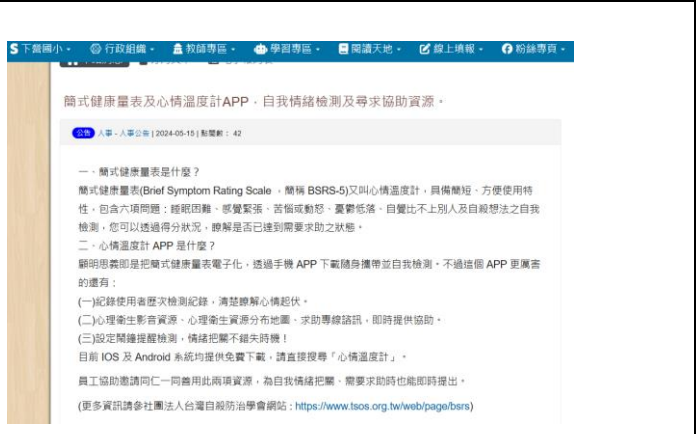
(學校網站-簡式健康量表及心情溫度計 APP，自我情緒檢測及尋求協助資源)