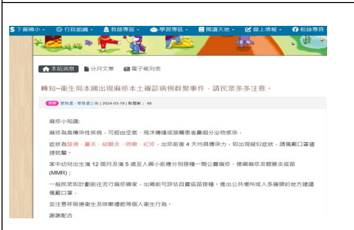
(學校網站-轉知~衛生局本國出現麻疹本土確診病例群聚事件，請民眾多多注意。)