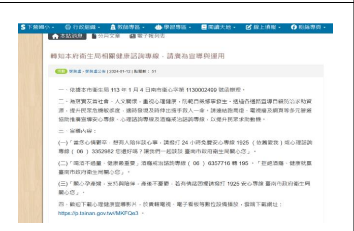
(學校網站-轉知本府衛生局相關健康諮詢專線，請為宣導與運用)