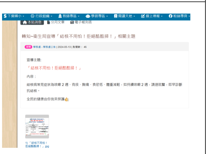
(學校網站-轉知~衛生局宣導「結核不用怕！拒絕酷酷掃！」相關主題)