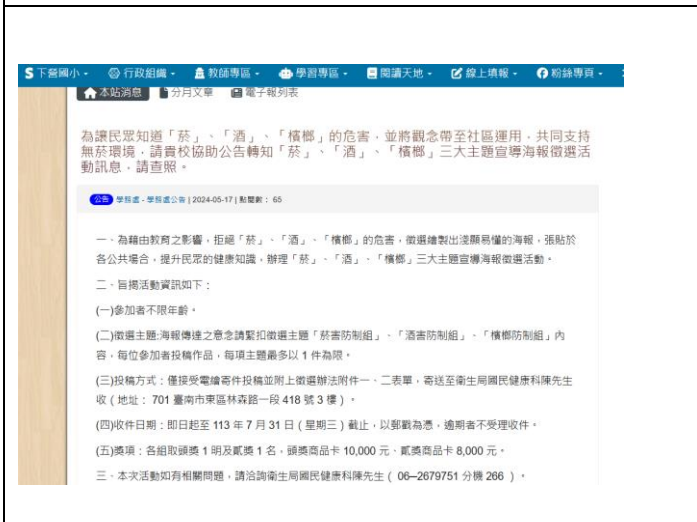
(學校網站- 為讓民眾知道「菸」、「酒」、「檳榔」的危害，並將觀念帶至社區運用，共同支持無菸環境，請貴校協助公告轉知「菸」、「酒」、「檳榔」三大主題宣導海報徵選活動訊息)