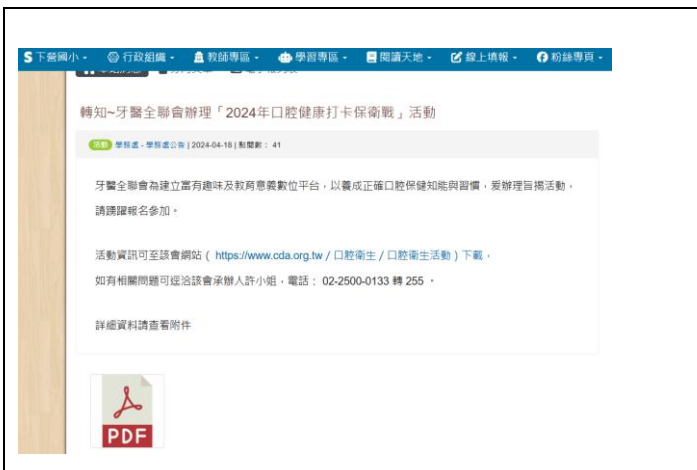
(學校網站-轉知~牙醫全聯會辦理「2024年口腔健康打卡保衛戰」活動)