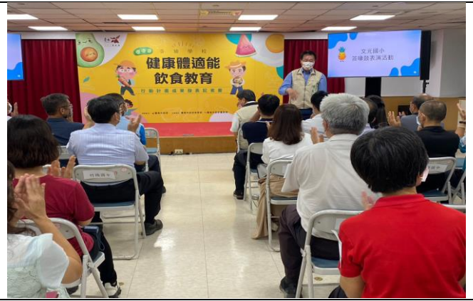
(健康體適能飲食教育行動成果-記者會)