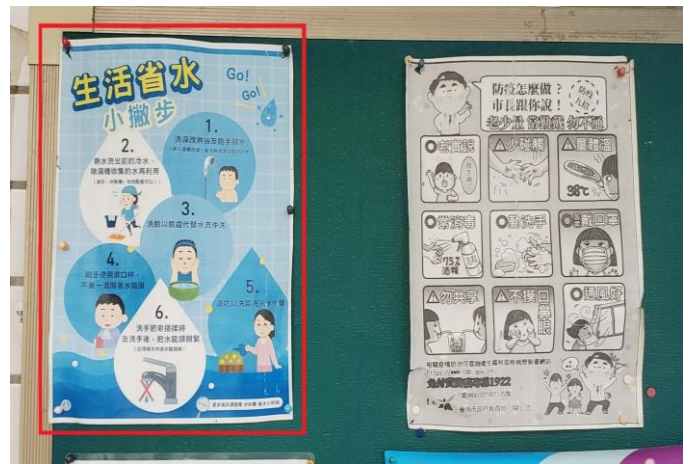
(健康管理宣導-防疫)