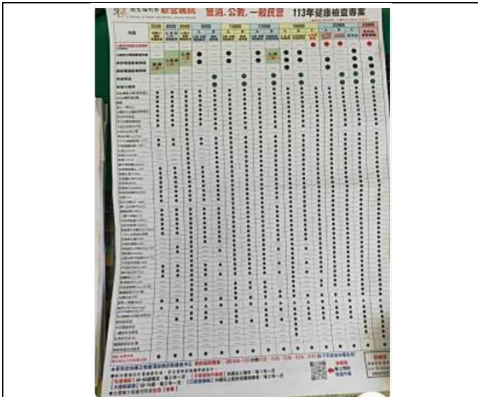
(提供師長、家長健檢參考)