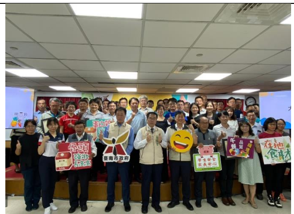
(健康體適能、飲食教育行動成果-記者會)