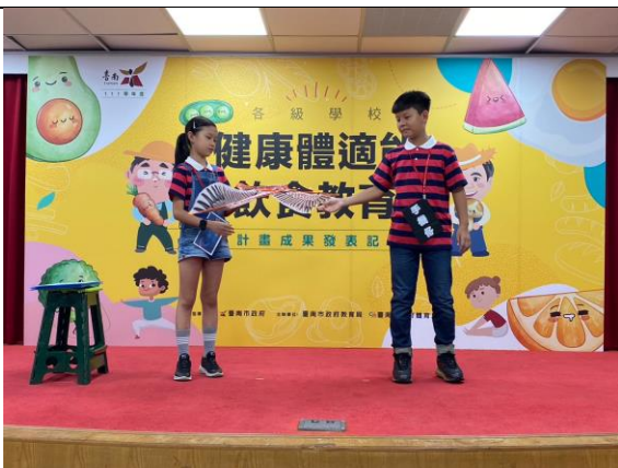
(健康體適能、飲食教育行動成果-記者會)