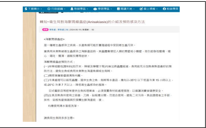
(學校網站-轉知~衛生局對海獸胃線蟲症(Anisakiasis)的介紹及預防感染方法)