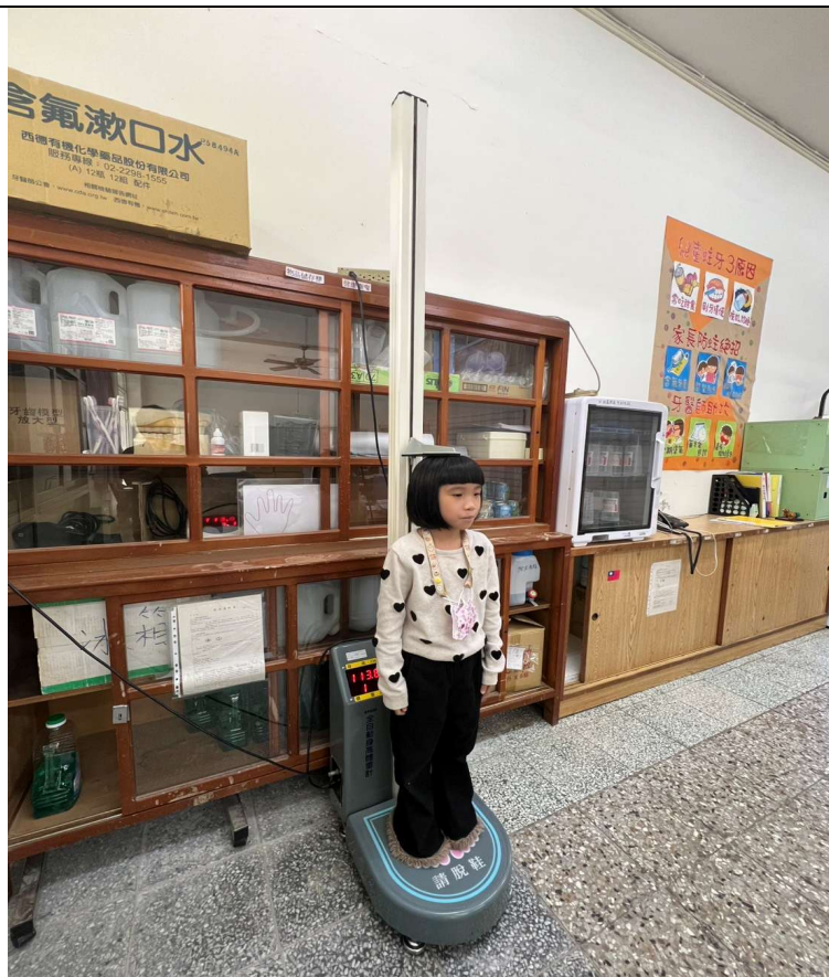
體位不良定期追蹤-過輕