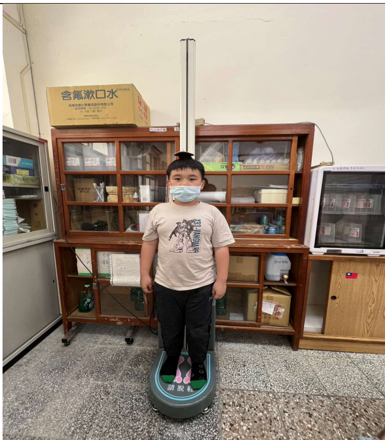
體位不良定期追蹤-超重