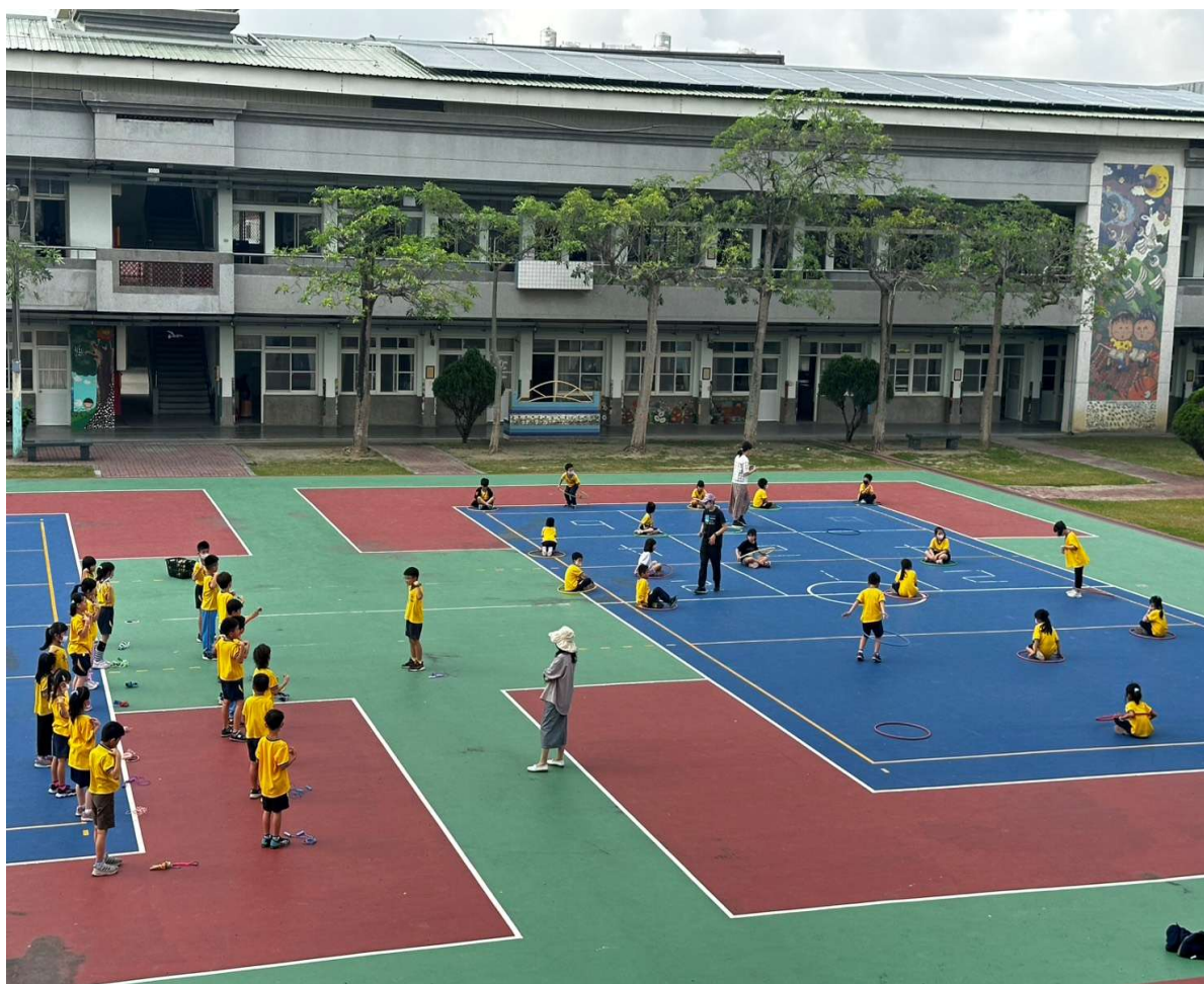
週三樂活日，透過團體參與提升學習樂趣與健康意識。