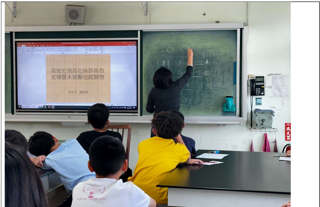
高度近視暨位就醫關懷宣導