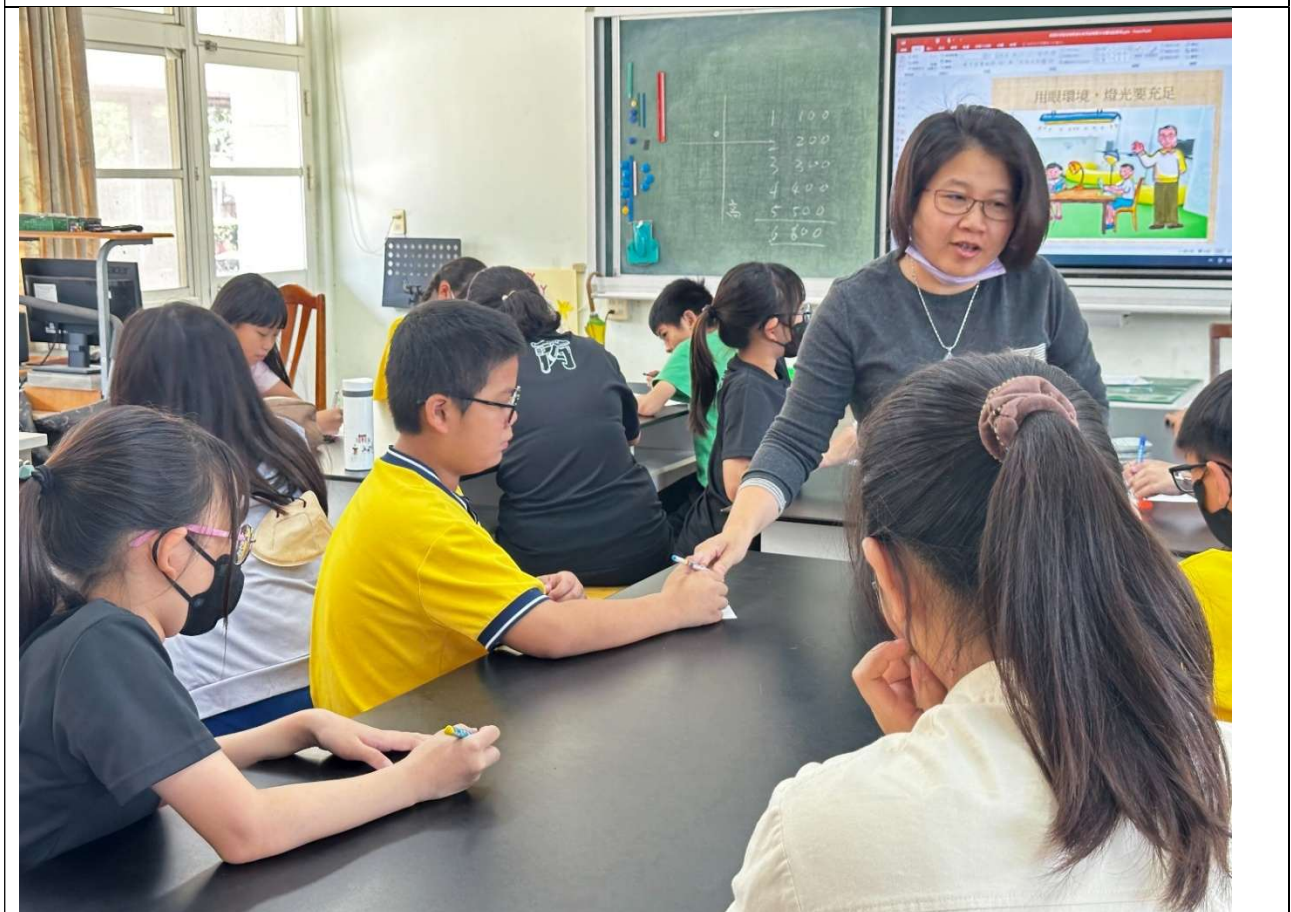
高度近視宣導-指導寫字正確高度