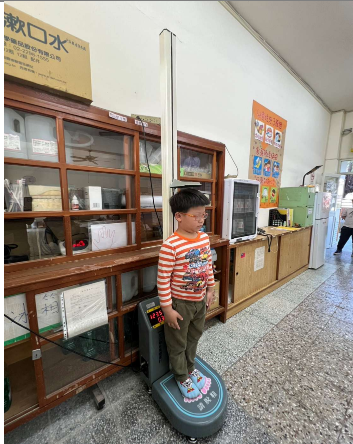
體位不良定期追蹤--過重