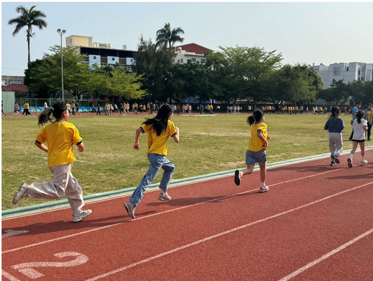
學生朝會後，全校大跑步