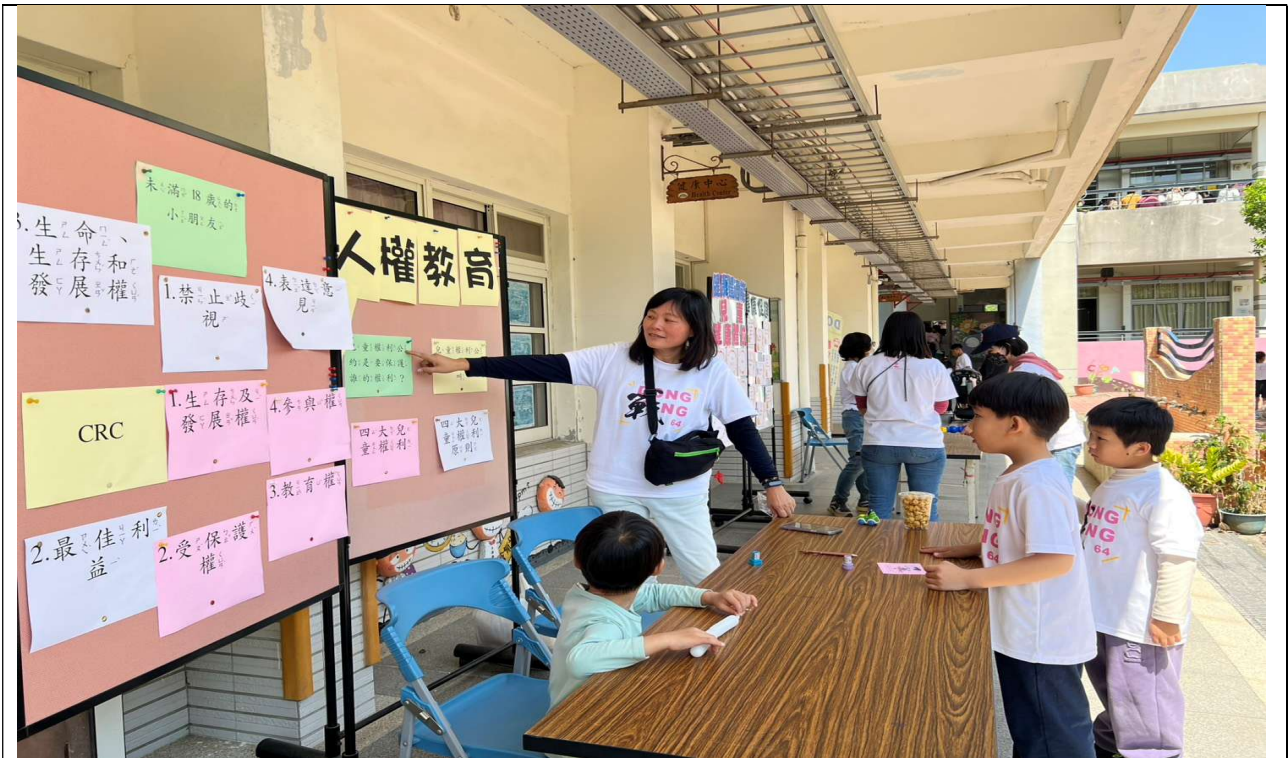
說明：校慶運動會人權教育議題闖關