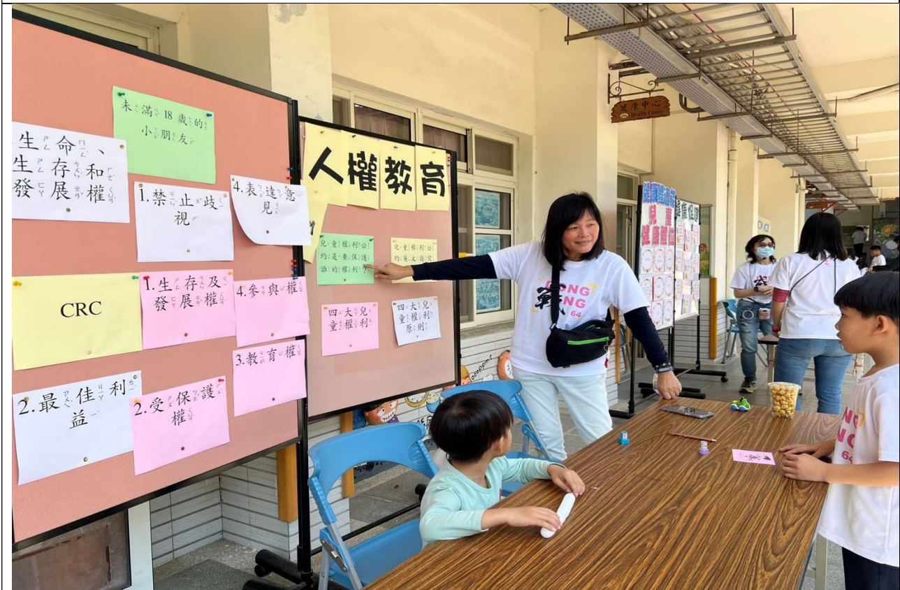
說明：校慶運動會人權教育議題闖關