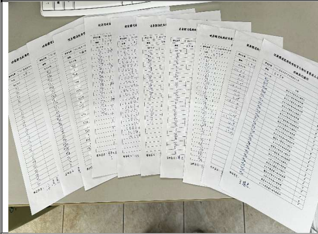
班級實施餐前五分鐘檢核表