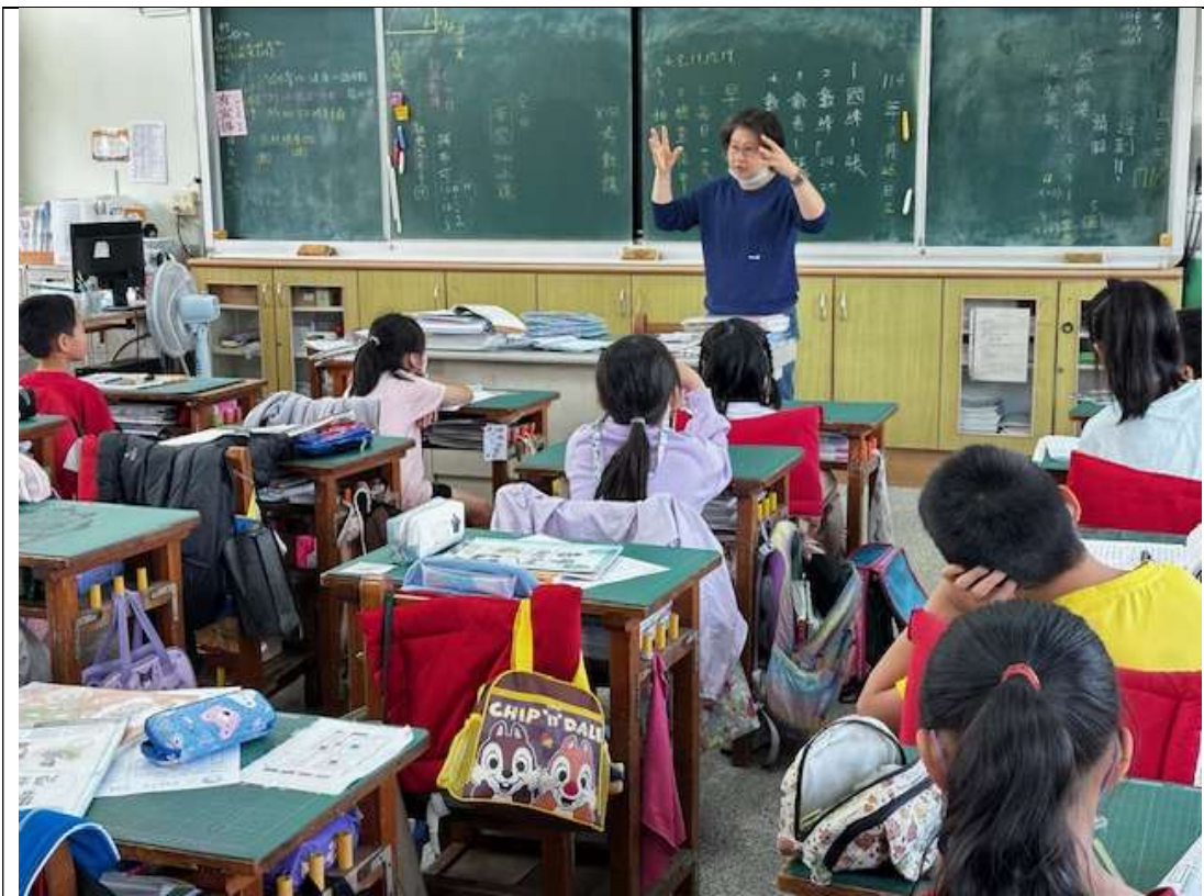
手部衛生教育宣導