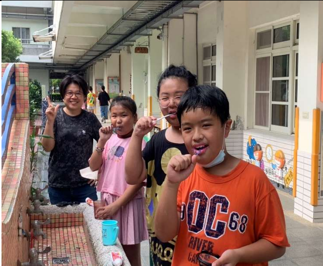
護理師做潔牙指導