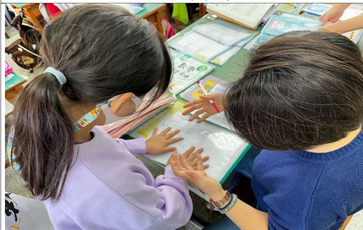
手部衛生教育宣導