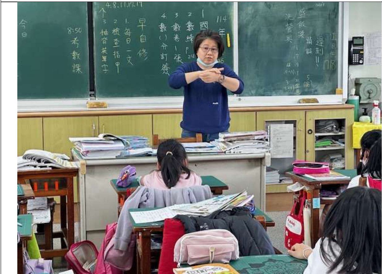
手部衛生教育宣導