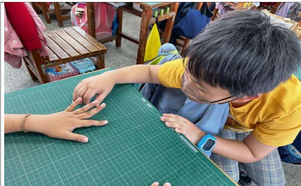
手部衛生教育宣導