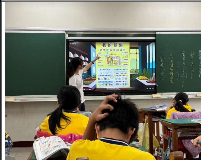
六甲教師教學-我的餐盤