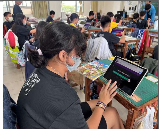
六丙午餐教育-每月測驗